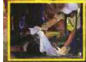
Paramédicos del ERUM trataron de ayudarlo.