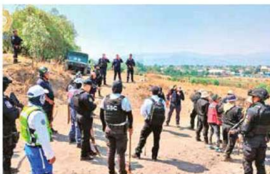
La SSC envió a la zona 50 elementos y 12 vehículos, para garantizar los trabajos de la Fiscalía General de Justicia.