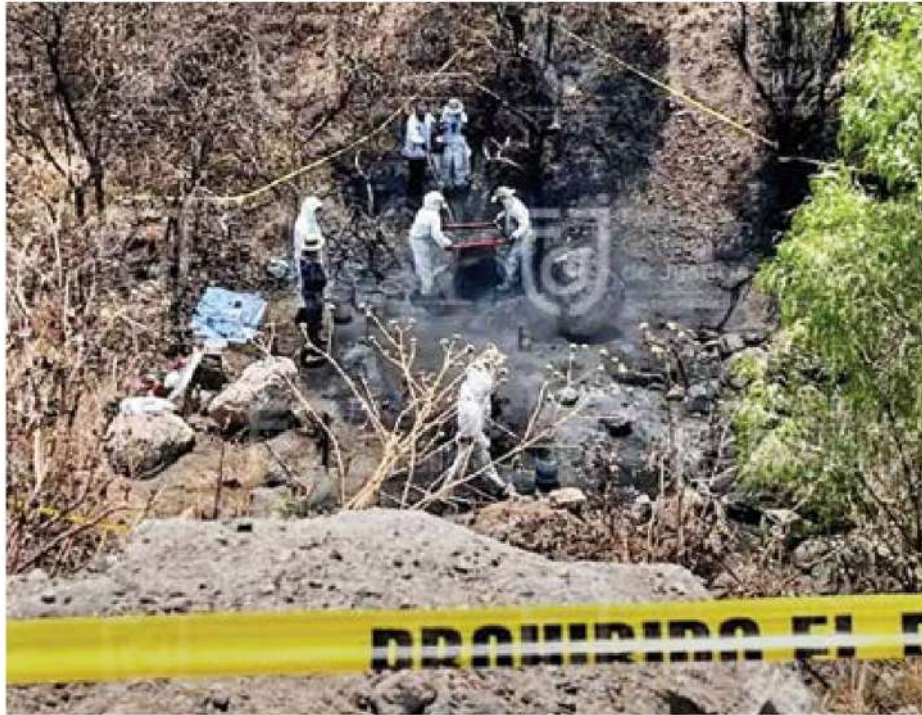
● PUNTO. Peritos revisaron el presunto crematorio denunciado en los límites de Iztapalapa y Tláhuac.