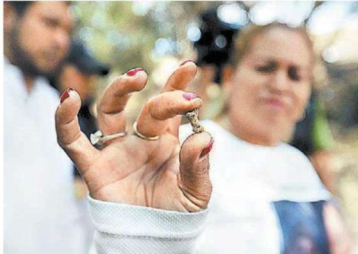
La buscadora muestra posible "falange humana". JAVIERRÍOS