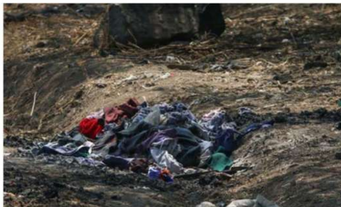
Buscadoras hallaron en el sitio ropa de niños y mujeres.

“Corresponden a la especie canina y ninguno de ellos corresponde a persona alguna. Nuestro personal pericial revisó diversas muestras de cenizas, las cuales corresponden a restos de animales y a diversos materiales como plásticos, llantas y basura”, dijo.