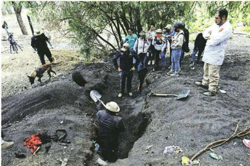
■ Desde la noche del martes, personal de distintas dependencias fue desplegado en la zona del Volcán Xaltepec, en donde madres buscadoras habían realizado una jornada de búsqueda.