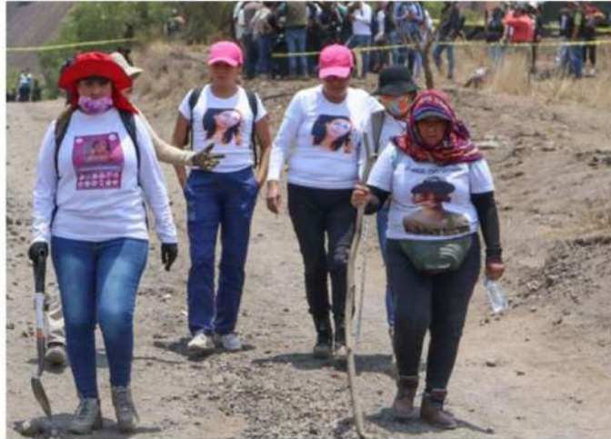
Inregantes de "Una luz en el camino" lamentaron que se alarme a las madres buscadoras sin saber si hay restos humanos en el lugar.