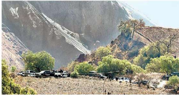
La zona, en inmediaciones del volcán Xaltepec. JAVIERRÍOS