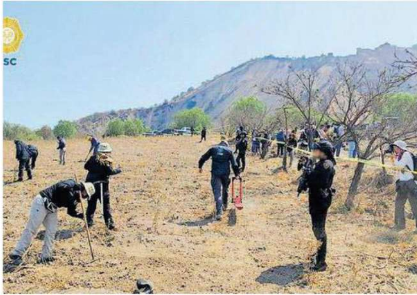
El perímetro fue resguardado por policías capitalinos, uniformados de la Guardia Nacional, así como del Ejército