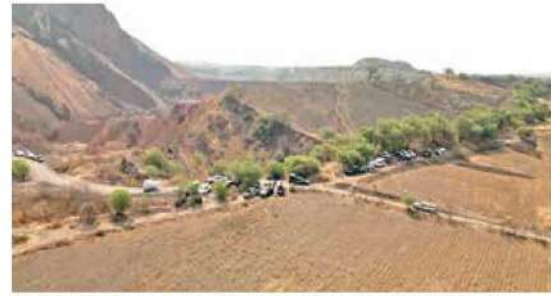
El sitio donde se realizó la diligencia es en las faldas del volcán Xaltepec, a 500 metros de la zona habitacional.