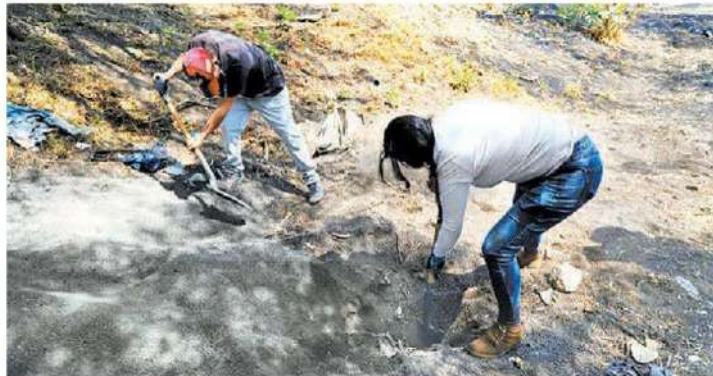
Equipo de Flores sigue explorando en la región. JAVIERRÍOS