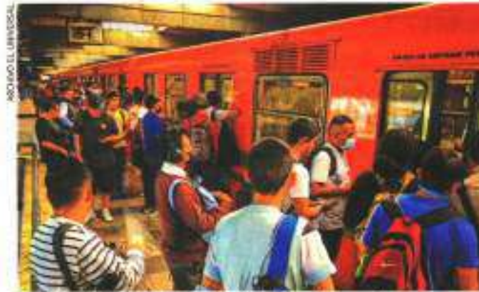
En 2023, el Metro recibió 2 mil 855.3 millones de pesos extra para enfrentar presiones de gasto y proyectos de inversión.

MILLONES DE PESOS adicionales se destinaron al pago de la deuda pública.