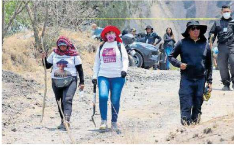
Las madres buscadoras de Ciudad de México acudieron a la jornada