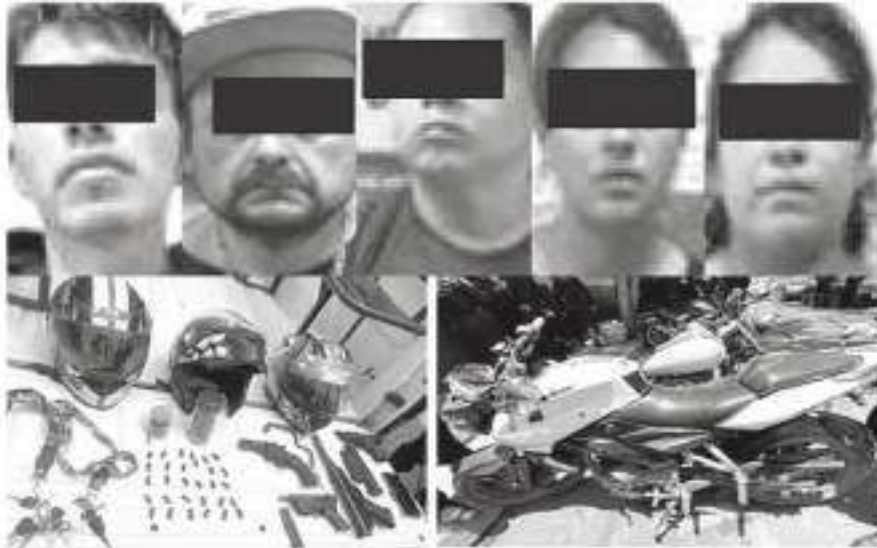
Los mandaron derecho a la cárcel