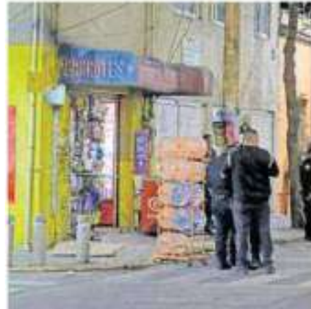
La occisa estaba en la tienda de abarrotes El Cumbias. JOSÉ MELTON

La tienda quedó acordonada en espera de los periciales de la FGJCDMX para realizar la indagatoria y recabar testimonios para dar con el presunto asesino