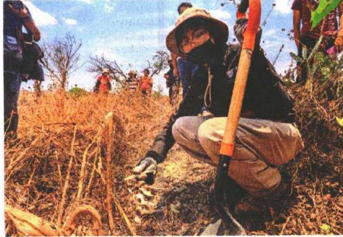
Integrantes de colectivos buscan restos de desaparecidos en el Volcán Xaltepec, en los límites de Iztapalapa con Tláhuac.