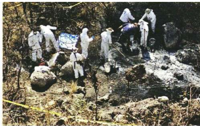
La ceniza hallada correspondía a materiales como plásticos y llantas.