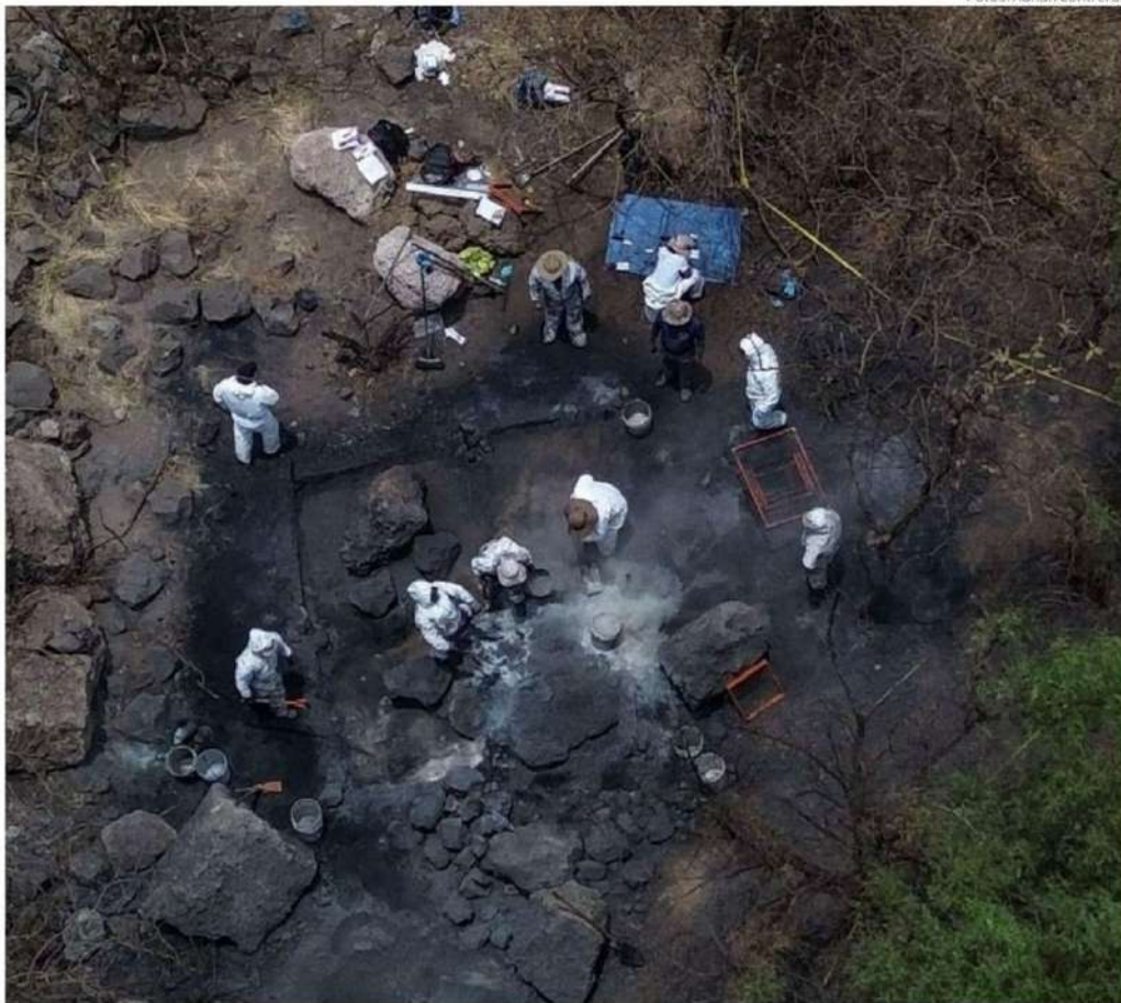
Autoridades continúan las investigaciones en torno al supuesto crematorio clandestino .