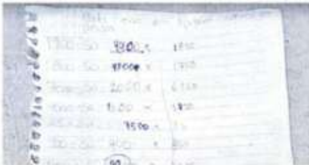
En la vivienda fueron hallados objetos y escritos que evidencian los castigos que sufrían dos menores.