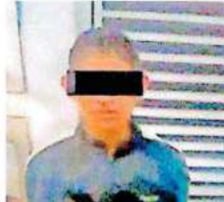
El imputado fue remitido ante las autoridades ministeriales de la Fiscalía capitalina

A la hora de su aprehensión se le aseguraron nueve latas de atún con un costo de 499 pesos, así como 500 pesos en efectivo. El imputado fue reconocido por el encargado de la tienda como quien lo sometió, robó y golpeó, por lo que el presunto ladrón fue remitido ante las autoridades ministeriales y en las próximas horas se determinará su situación jurídica.