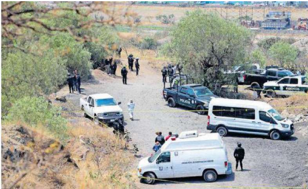
La policía resguardó con 50 elementos la zona del volcán Xaltepec

LA SSC encontró a la mujer y al menor de edad cuyas identificaciones aparecieron en el presunto crematorio