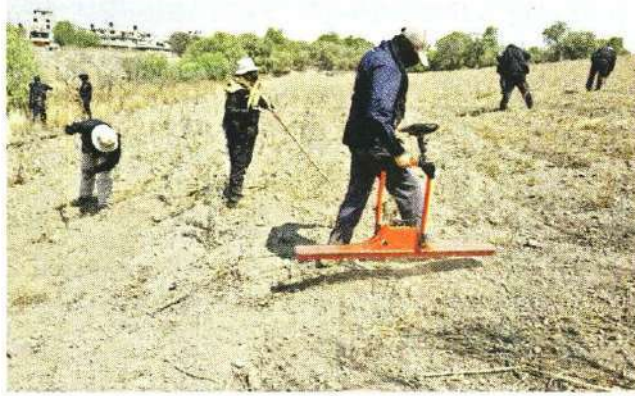
■ El área se encuentra en los límites de Iztapalapa y Tláhuac.