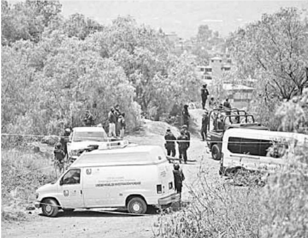
▲ Luego de un gran despliegue de efectivos, vehículos de apoyo, drones y perros de búsqueda, se determinó con análisis científicos que los restos hallados eran de perros.