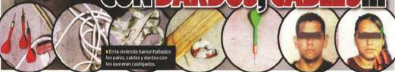
En la vivienda fueron hallados los palos, cables y dardos con los que eran castigados.