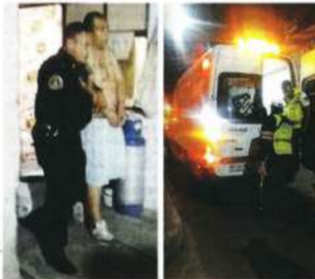
El padrastro y la madre ya fueron vinculados a proceso por delitos como el de violencia familiar equiparada.