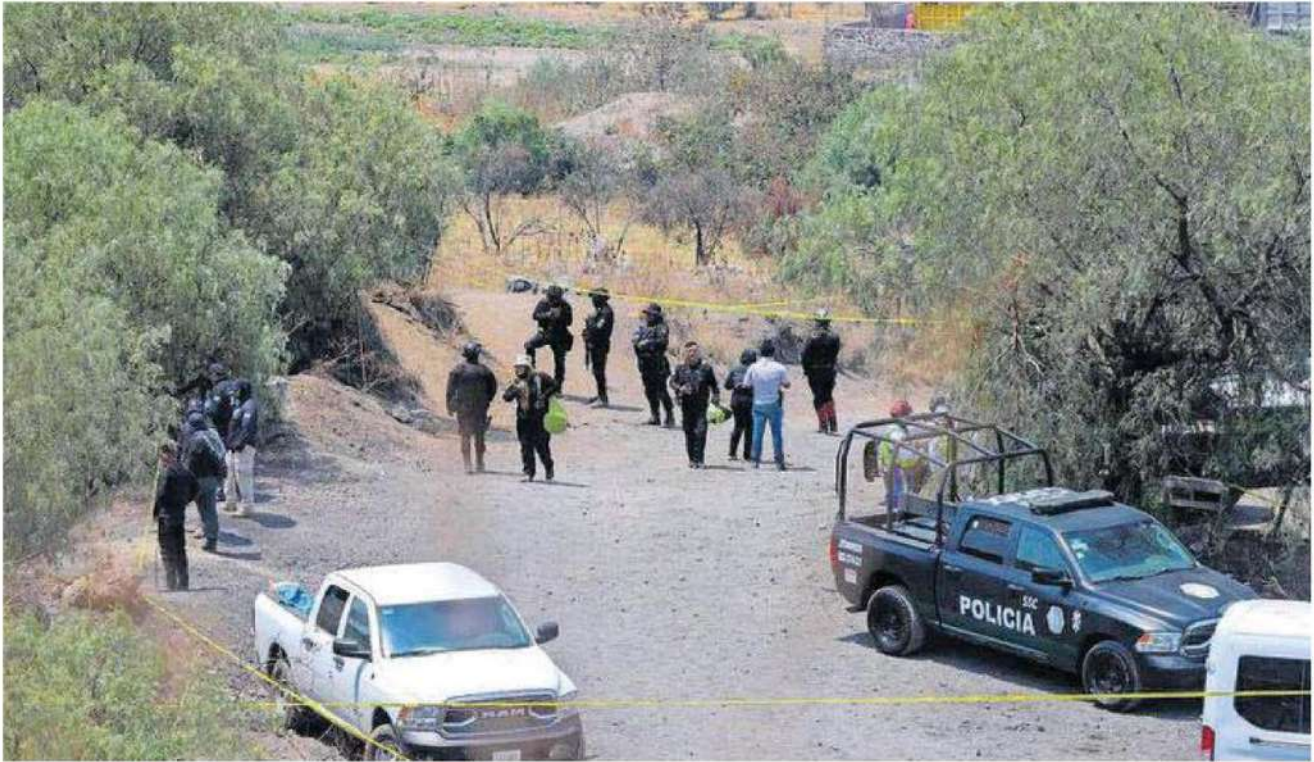
Elementos de seguridad acordonan el área para avanzar en la investigación.