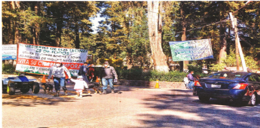
El Desierto de los Leones está a merced de los visitantes, y los comerciantes de la zona esperan que hoy acuda el mismo número de personas para aprovechar el puente vacacional. Este lugar estuvo cerrado durante seis meses.