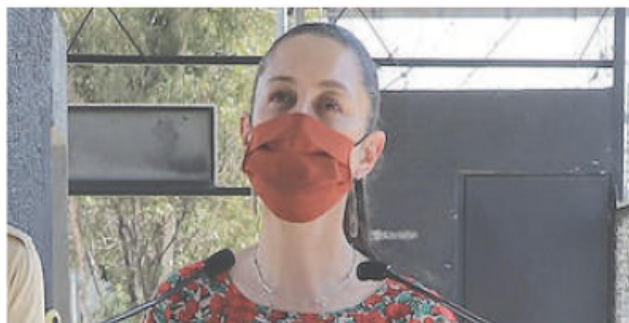
Claudia Sheinbaum, jefa de Gobierno, indicó que la cifra de hospitalizaciones disminuyó ligeramente este fin de semana.