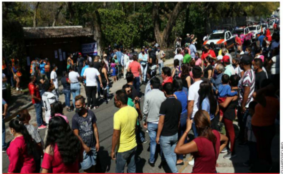
Protección Civil de Cuernavaca y policías locales cerraron ayer el jardín donde panistas votarían para elegir candidatos a alcalde de esa ciudad, así como diputado federal. Muchos de los asistentes no llevaban cubrebocas ni guardaban la sana distancia.