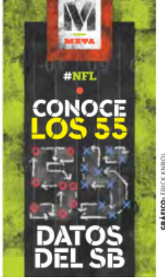
GRÁFICO: ERICK ANIBOL