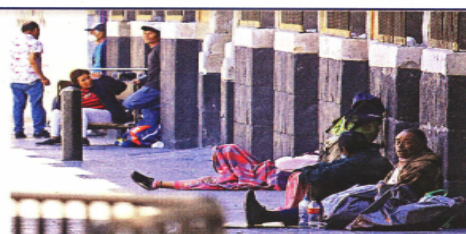
■ Cada vez son más quienes solicitan en comedores alimentos gratuitos o despensas en la Ciudad de México.

Otro de los cambios fue el crecimiento del sector de tecnología, que pasó de representar 9 por ciento del total de vacantes a duplicar su presencia, representando 18 por ciento de estas en diciembre.