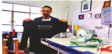
■ El creador vendió su primera careta a personal del IMSS.

Tras la ansiedad e incertidumbre, recuerda, se sentó a meditar e investigó sobre las pandemias, observó imágenes de las protecciones y pensó en lo extrañas e incómodas que eran las mascarillas. Fue entonces que tuvo