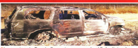
La camioneta Toyota Sequoia, asegurada el 5 de diciembre por el INM, apareció 48 días después en la escena del crimen.

565 vehículos, 14 aeronaves y 62 minidrones, además de los 770 militares que apoyan el transporte terrestre de combustible. Entre los ductos vigilados por las fuerzas militares están el Tula-Salamanca, el Salamanca-Guadalajara, el Tuxpan-Azapotzalco y el Cadereyta-Matamoros y el Cadereyta-Madero. La Secretaría de Marina resguarda también el poliducto Tuxpan-Azapotzalco. Entre junio de 2019 y septiembre pasado, la Sedena contabilizó 8 mil 529 servicios de escolta de seguridad a los autotanques. Fuentes de la dependencia afirman que esa vigilancia ya rebasa los 10 mil servicios por diversas carreteras del País.