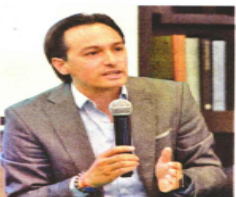
Andrés Atayde detalló que el PAN irá solo en los distritos 13 y 17.

Las dirigencias aceptaron ayer domingo que los 24 distritos electorales para igual número de diputaciones federales se dividieron así: 10 para el PRD, siete para el PRI y siete para el PAN.