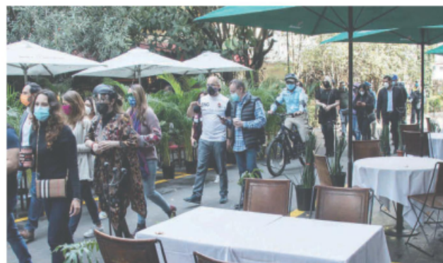
Establecimientos, además de los restaurantes, sólo tienen permitido dar servicio al aire libre y de la puerta hacia fuera con todas las medidas.

La semana pasada se incorporaron a las actividades económicas, giros como papelerías, esto para apoyar a los estudiantes que regresaron a las clases remotas, ópticas, tiendas de acabados para construcción y establecimientos dedicados a la venta de artículos de cocina debido a que son proveedores de restaurantes. Se estableció que estos giros mercantiles deberían tener un aforo de 20 por ciento, acceso de una persona por familia, uso obligatorio de cubrebocas y careta para los trabajadores que atienden al público, además de gel antibacterial y medidas de ventilación. ●