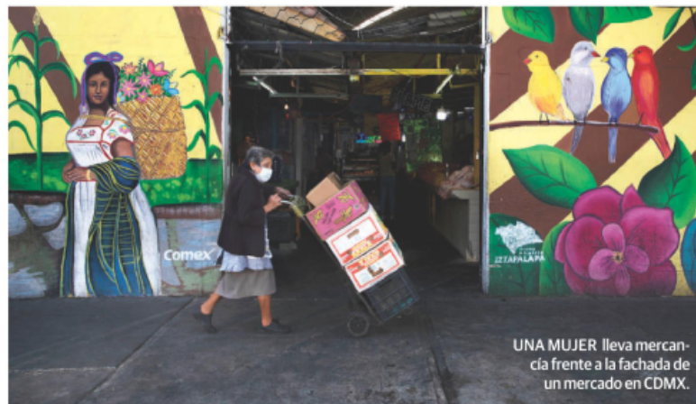
UNA MUJER lleva mercancía frente a la fachada de un mercado en CDMX.

Uno más del que no hubo avance fue el punto de acuerdo del que se pidió establecer una mesa de trabajo virtual entre el titular y/o servidores públicos de la Secretaría de Gobierno, de Administración y Finanzas, de Desarrollo Económico y de Trabajo y Fomento al Empleo con los diputados locales, con el fin de atender las peticiones de apoyo a favor del "comercio