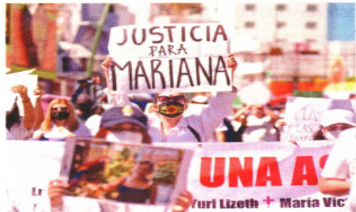
En Tuxtla Gutiérrez, la marcha congregó a cientos de personas vestidas de blanco, con flores y pancartas en memoria de Mariana.