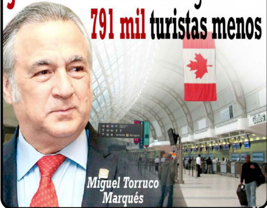
Miguel Torruco Marqués

Medidas implementadas por gobierno de Canadá significará 791 mil turistas menos