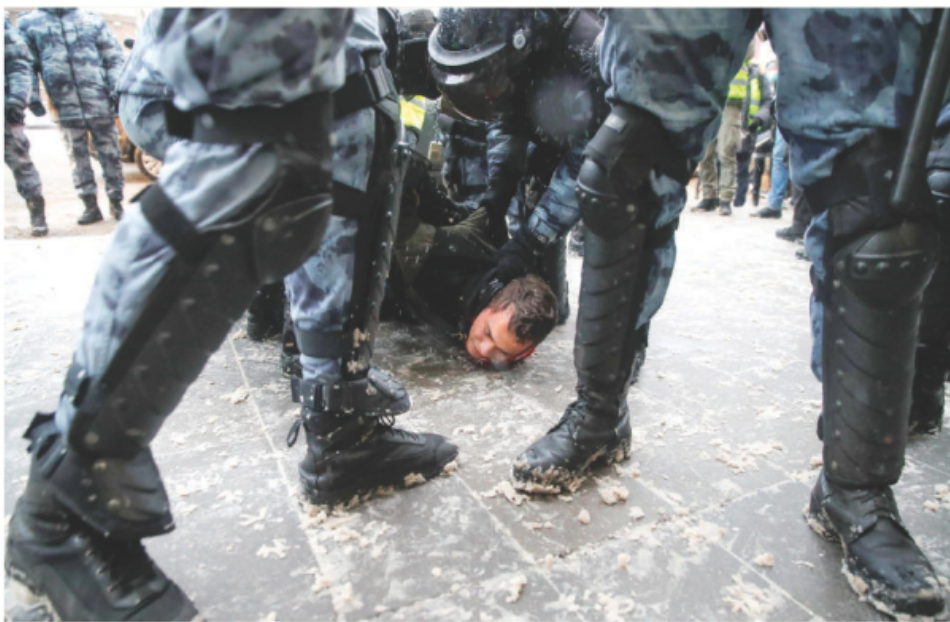
LA POLICÍA rusa detiene a un manifestante pro-Navalny, ayer, en Moscú.