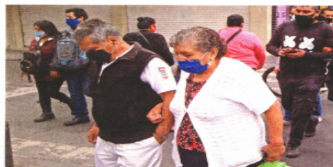
Según el plan del gobierno federal, se busca que para marzo estén vacunados la mayoría de los adultos mayores de 60 años.

“Falta poco, desde aquí le mandamos un saludo al Presidente de la República, [ya que