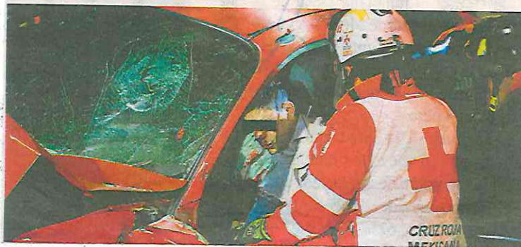
Socorristas de la Cruz Roja le dieron los primeros auxilios y lo llevaron al Hospital de Xoco

El joven de entre 30 y 35 años de edad quedó inconsciente dentro de la unidad, por lo que luego de ser rescatado por bomberos de la Ciudad de México, socorristas de la Cruz Roja le brindaron los primeros auxilios y tras estabilizarlo fue trasladado de emergencia al Hospital de Xoco.