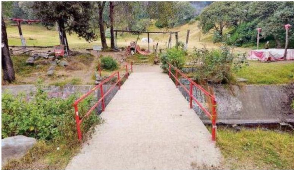
Alguien logró internarse, abandonar la maleta y salir sin ser visto; la víctima continua sin ser identificada