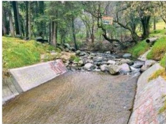
Los videos muestran la escapada de la combi por la calle que lleva a Los Dinamos