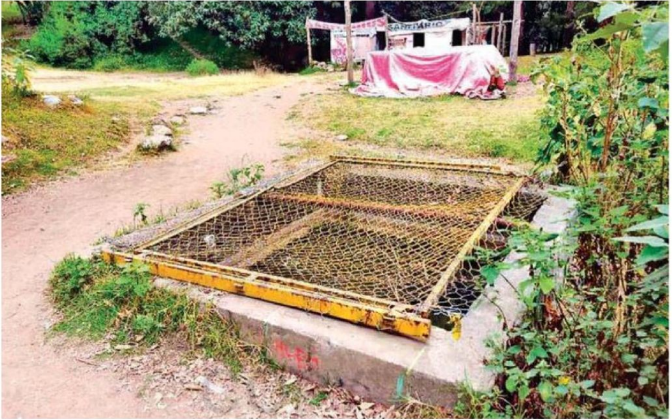
La maleta estaba en uno de los respiraderos del sistema hidráulico, ahí se encontraba el cadáver de una mujer