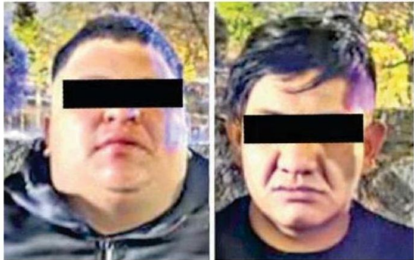
Uno de ellos intentó proporcionar una identidad falsa y se estableció que cuenta con antecedentes penales