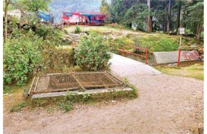
La maleta con el cuerpo sin vida de una mujer fue localizada en el cruce del camino a Los Dinamos de Contreras y el Callejón a La Cañada