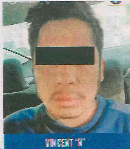
Fue detenido el presunto homicida de Lucía "N"

De inmediato, elementos de la Secretaría de Seguridad Ciudadana (SSC) de la Ciudad de México implementaron un dispositivo de búsqueda para localizar al responsable.