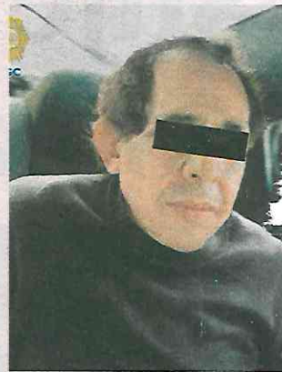
Tenía en su poder yerbita vaciladora lista para la venta

Ante la posible comisión de un delito, los uniformados se aproximaron a él y conforme a los protocolos de actuación policial le solicitaron una revisión preventiva, resultado de la cual se aseguraron 30 bolsitas pequeñas anudadas en un extremo que contenían una yerba verde y seca similar a la marihuana y un arma de fuego corta con tres cartuchos útiles. Por estos hechos, el hombre de 62 años de edad fue detenido, informado de sus derechos de ley y posteriormente presentado, junto con los objetos asegurados, ante el agente del Ministerio Público correspondiente, quien determinará su situación legal.