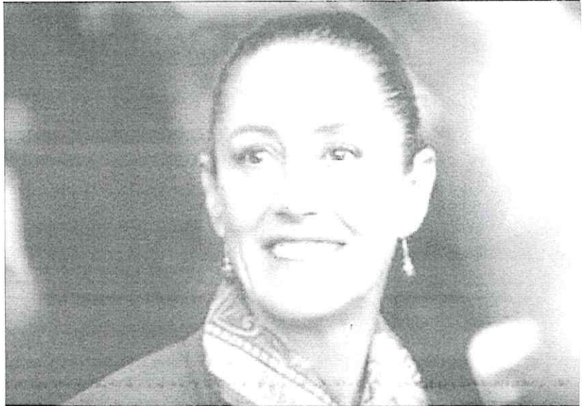
La jefa de gobierno de la Ciudad de México, Claudia Sheinbaum Pardo, fue nominada como mejor alcaldesa del mundo para la región de Norteamérica.