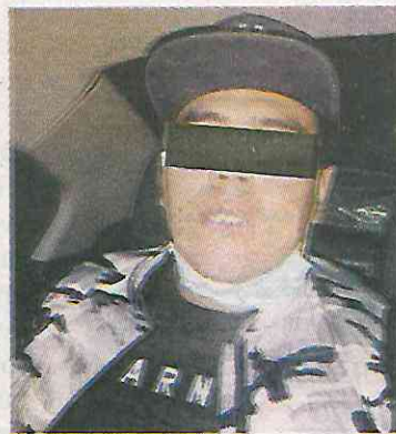
El presunto responsable