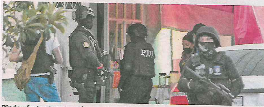
Rinden frutos los operativos antinarcóticos en la Ciudad

La imputada quedó a disposición del MP y en las próximas horas se determinará su situación jurídica.