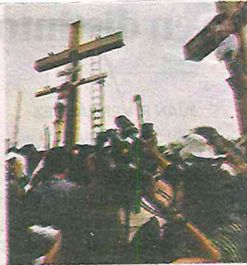
Representación "a puerta cerrada"

Asimismo, desde el jueves 1 de abril, hasta el sábado 3 del mismo, se reforzarán los patrullajes para inhibir el desperdicio de agua, el consumo de bebidas alcohólicas en la vía pública y