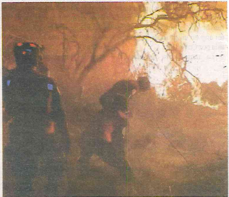
El fuego consumió un casa de lámina

La Secretaría de Gestión Integral de Riesgos y Protección Civil informó que elementos de bomberos de la Ciudad de México laboraron hasta entrada la noche en el incendio que se reac-