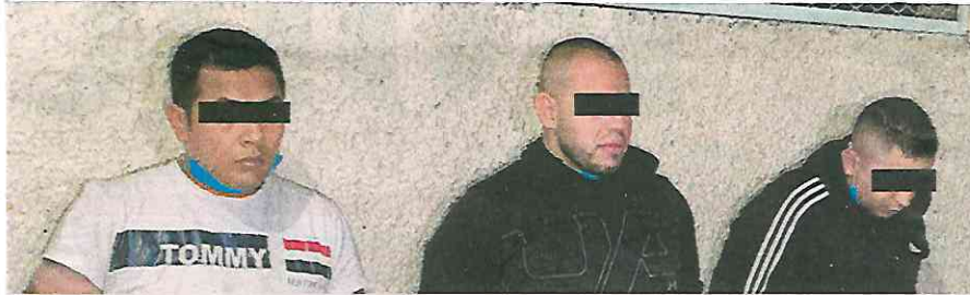
Pasaron varios días y el cuerpo abandonado ya apestaba