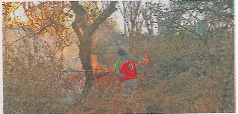
El viento propagó el fuego en predios de la zona boscosa aledaña

El grupo de vulcanos de varias estaciones aledañas trabajaron arduamente durante varias horas, para lograr sofocar el