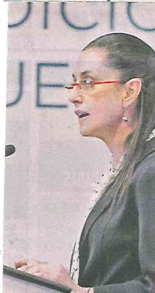
Sheinbaum destacó su labor contra la corrupción.

Sin dar detalles, y con la misma frase de los discursos de 2019 y 2020, aseguró que sus acciones no se podrían haber logrado sin el combate a la corrupción.