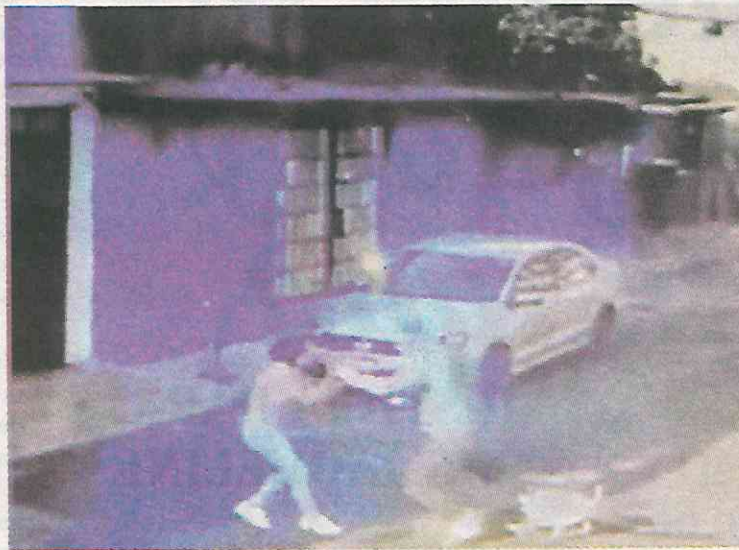
Así fue captado el momento del ataque