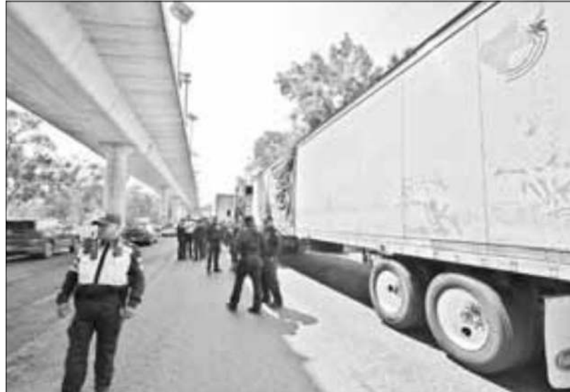
▲ Justo el día que mucha gente salió de vacaciones camioneros que piden más seguridad en carreteras cerraron por varias horas la salida a Cuernavaca.

El reforzamiento de la vigilancia abarca las centrales camioneras, Norte, Taxqueña, Oriente y Poniente, el aeropuerto, además de las entradas y salidas de carreteras que convergen con la Ciudad de México.