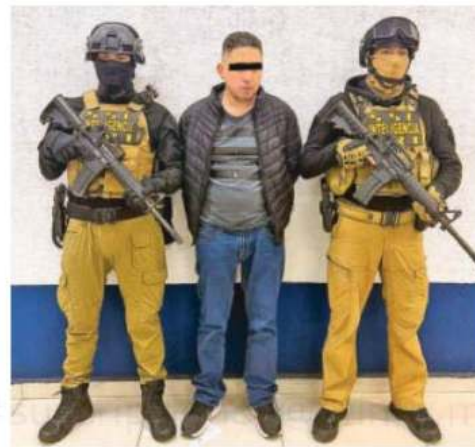
Los documentos apócrifos los comercializaba en la alcaldía Azcapotzalco

Se le aseguraron un engomado vehicular L52-BDT, tres licencias para conducir y cinco tarjetas de plástico tipo plantillas con logotipos y escudos oficiales