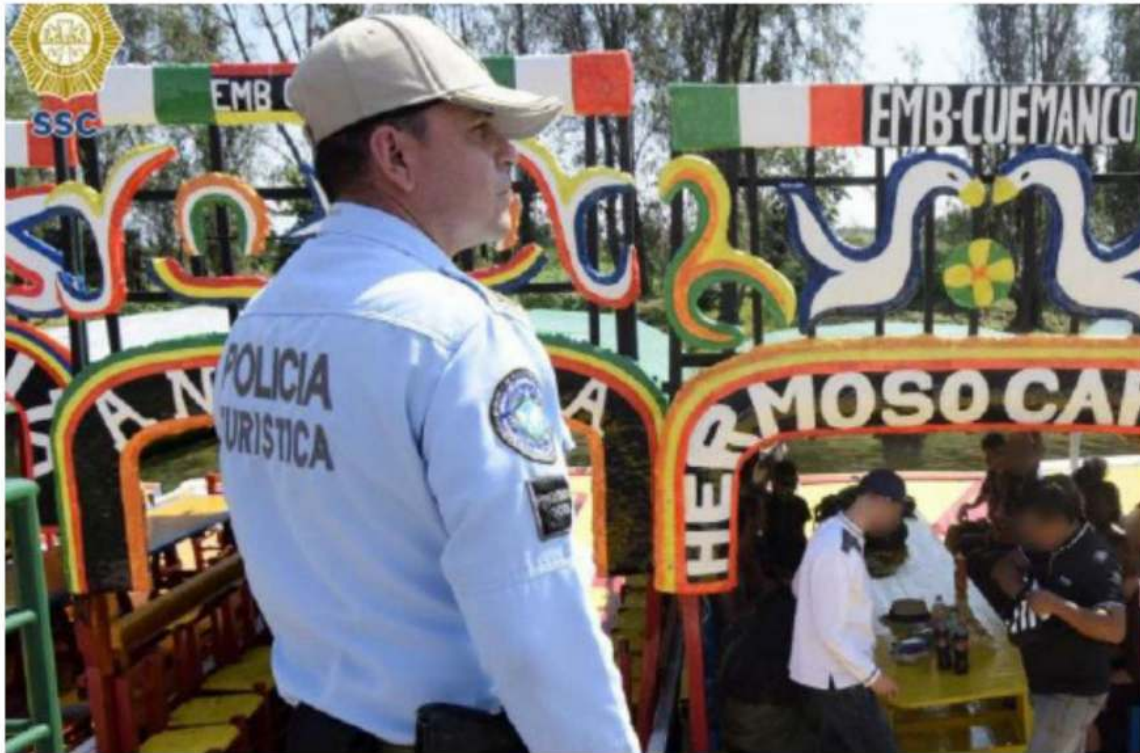
Hasta el domingo 9 de abril se intensificará el Programa Conduce Sin Alcohol.