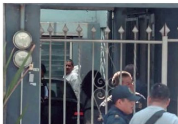
No se encontraron signos de robo forzado ni accesos violentados. Especial