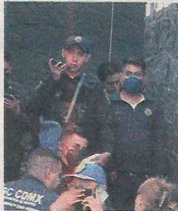
Penoso rescate del cadáver

El hoy occiso utilizó la estructura de las escalinatas de un puente peatonal para amarrar una sogá y colgarse, en Avenida