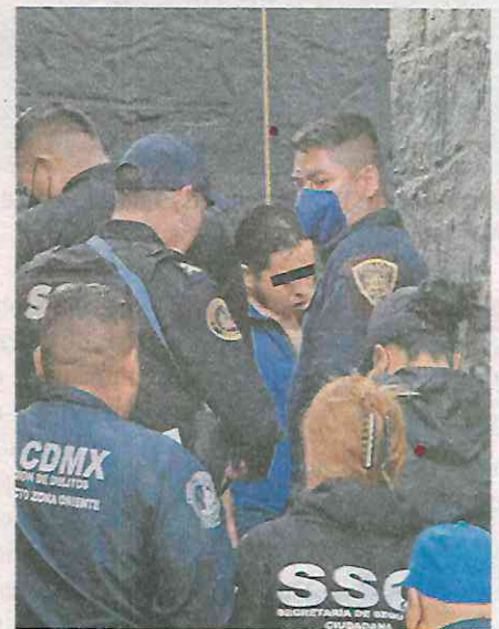
Atarían una cuerda de una roca del puente y brincarían para morir asfixiado

La zona fue resguardada por uniformados lo que causó caos vial durante algunos minutos mientras personal de Servicios Periciales realizaban las diligencias para retirar el cuerpo de la zona y trasladarlo al anfiteatro correspondiente donde se espera que familiares acudan a reconocerlo.