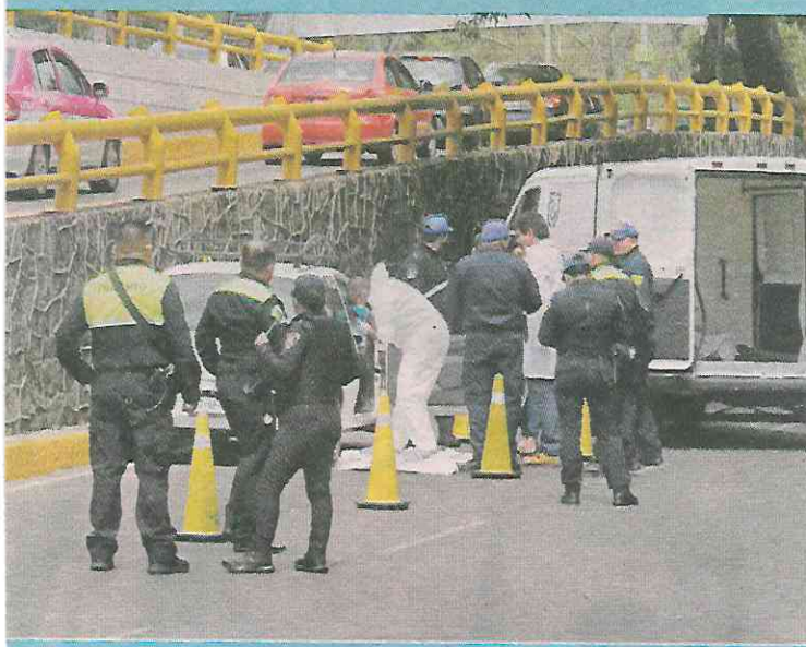
■ Policías auxiliares abanderaron el auto para evitar un choque.

Pese a que el automovilista permaneció en el sitio durante casi dos horas, nadie acudió para identificarlo.