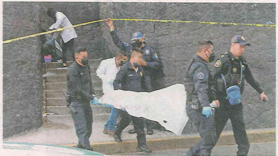
Se llevaría a la tumba la fatal razón de presuntamente atentar contra su vida

Hasta el punto llegaron elementos de la Secretaría de Seguridad Ciudadana (SSC) Sector Churubusco, y una ambulancia del Escuadrón de Rescate y Urgencias