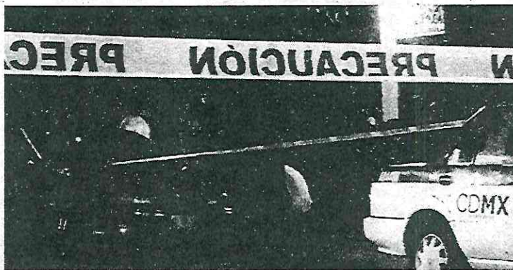
Se investiga el móvil del asesinato

La víctima, de aproximadamente 60 años de edad, fue baleado por dos desconocidos