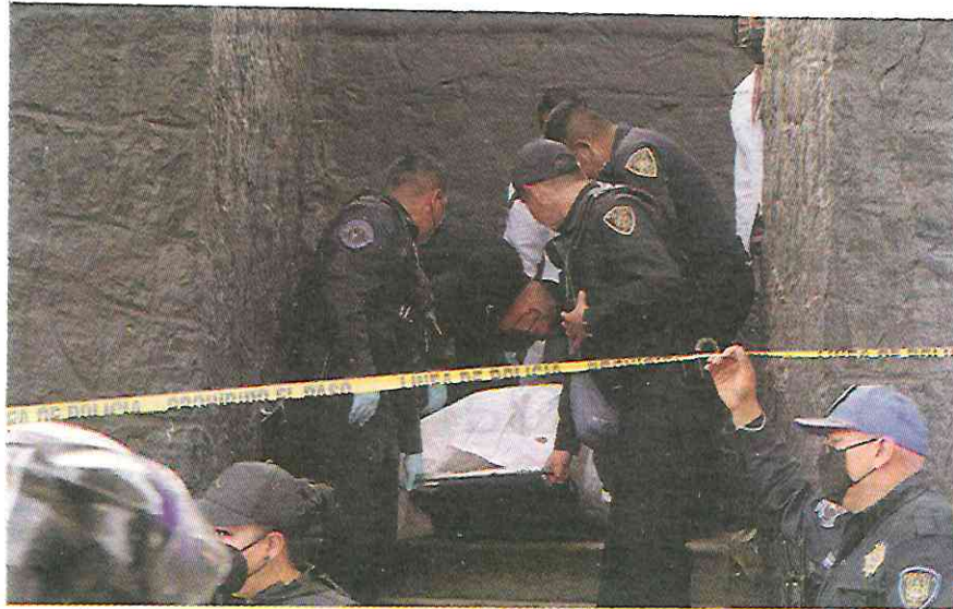
POLICÍAS retiran el cuerpo de un joven que se colgó de un puente peatonal en Río Churubusco y Albert, en la colonia el Retoño, en la Ciudad de México, ayer.

Pero México, además de la pandemia, sufre otros problemas, como los que mencionamos, que están haciendo que la gente pierda la vida más joven.