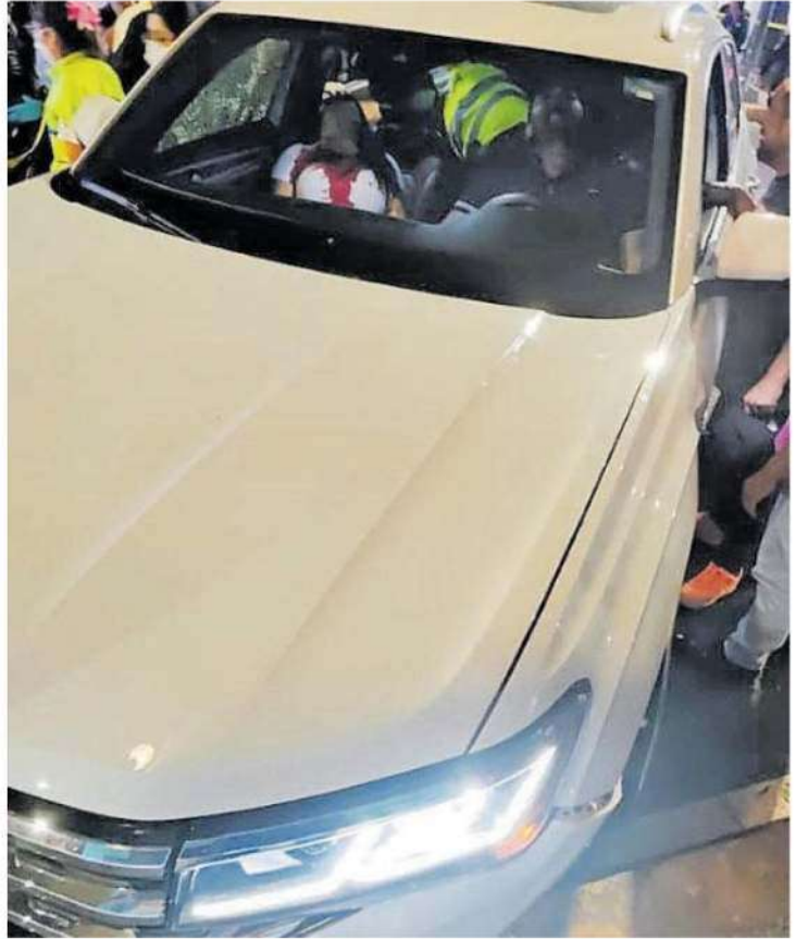
La pareja fue asistida por socorristas pero ya habían perdido la vida