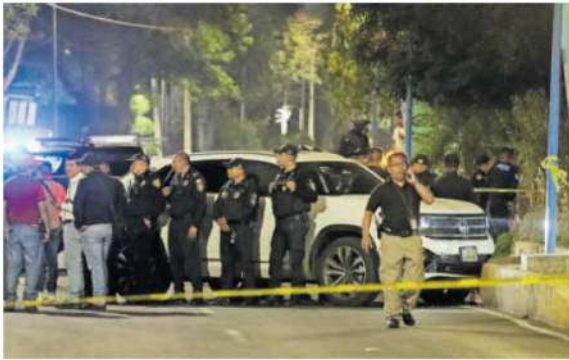
Policías capitalinos en la escena del doble asesinato