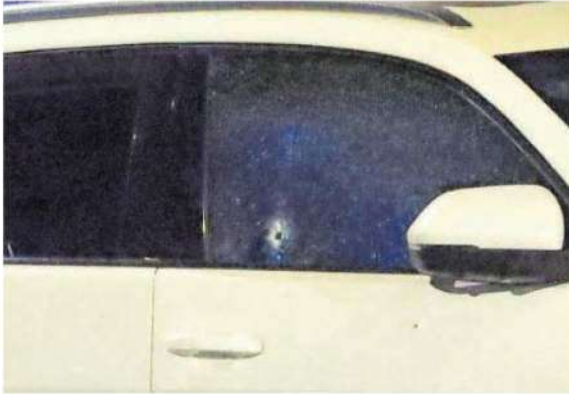
El vehículo en que viajaba la pareja presenta varios orificios de bala