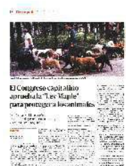
El Congreso capitalino aprobó la Ley Maple para proteger a los animales.

Sobre la eutanasia se podrá aplicar solamente a animales con lesiones que no puedan ser atendidas y provoquen un sufrimiento o enfermedades incurables