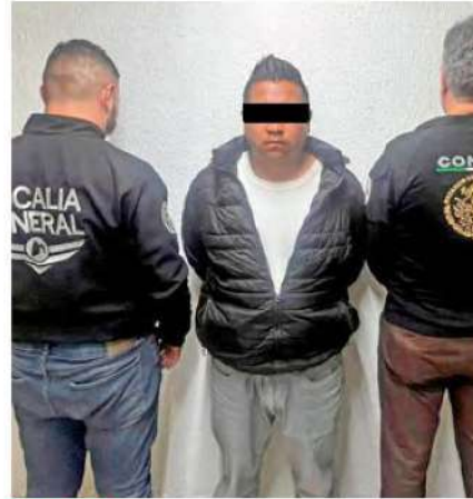
POLICÍA. La SSC capitalina confirmó que era parte de la dependencia.