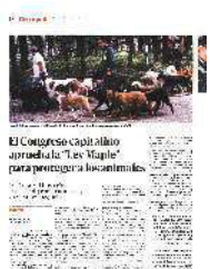
El Congreso capitalino aprobó la "Ley Maple" para proteger a los animales.