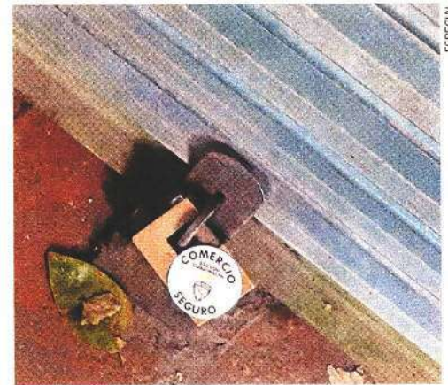
La Policía Auxiliar colocará “sellos de seguridad” en los candados de los negocios por la noche.

19:00 a 07:00 HORAS se realizarán los recorridos como parte del programa Comercio Seguro.