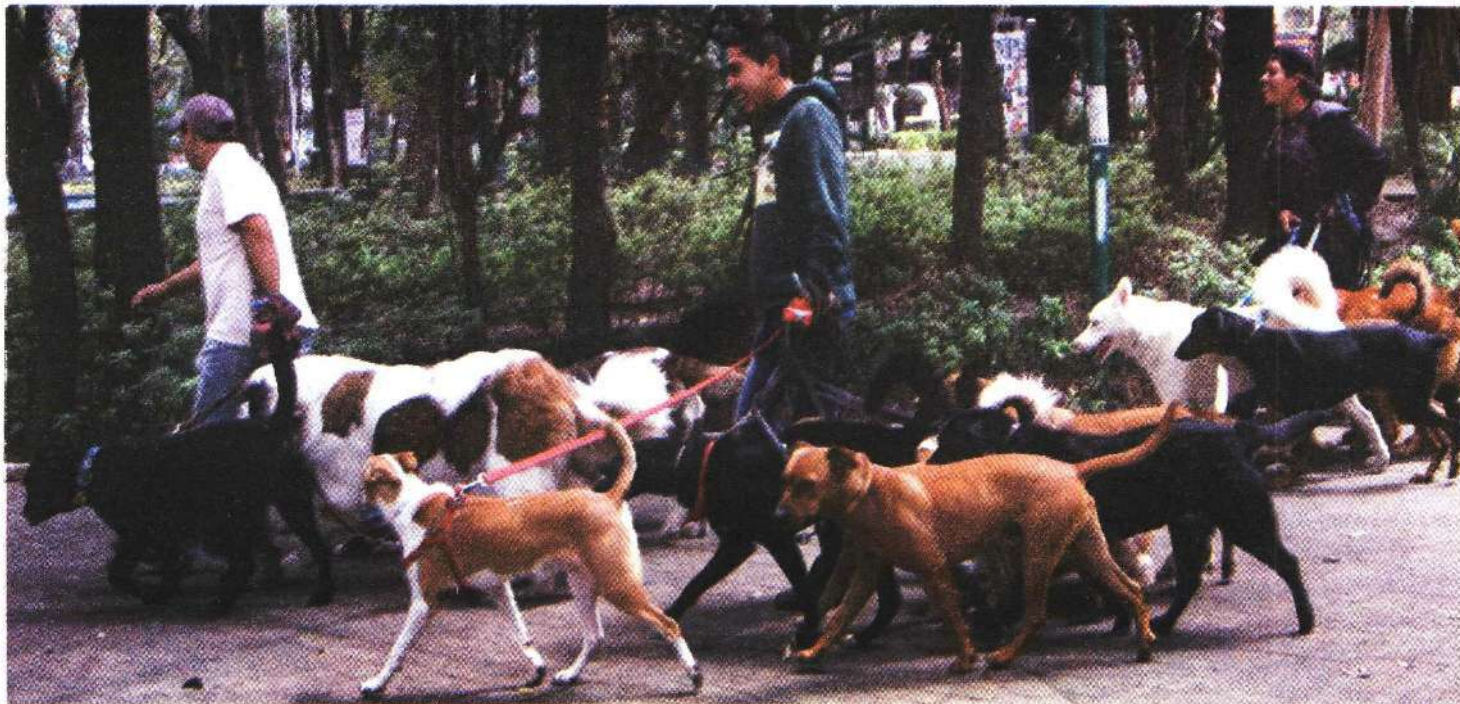
Será obligatorio que luego de la adquisición o adopción de un animal de compañía, el dueño registre a su mascota en la RUAC.