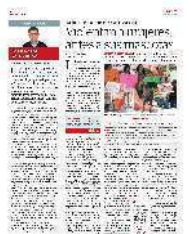
MANIFESTANTES protestan por el envenenamiento de perros en Xalapa, en abril.