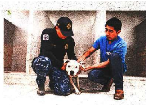
Iztapalapa, Benito Juárez y Cuauhtémoc tienen mayor intervención de la Brigada de Vigilancia Animal.

atendidos por la Brigada de Vigilancia Animal se relacionan con la falta de alimentación.