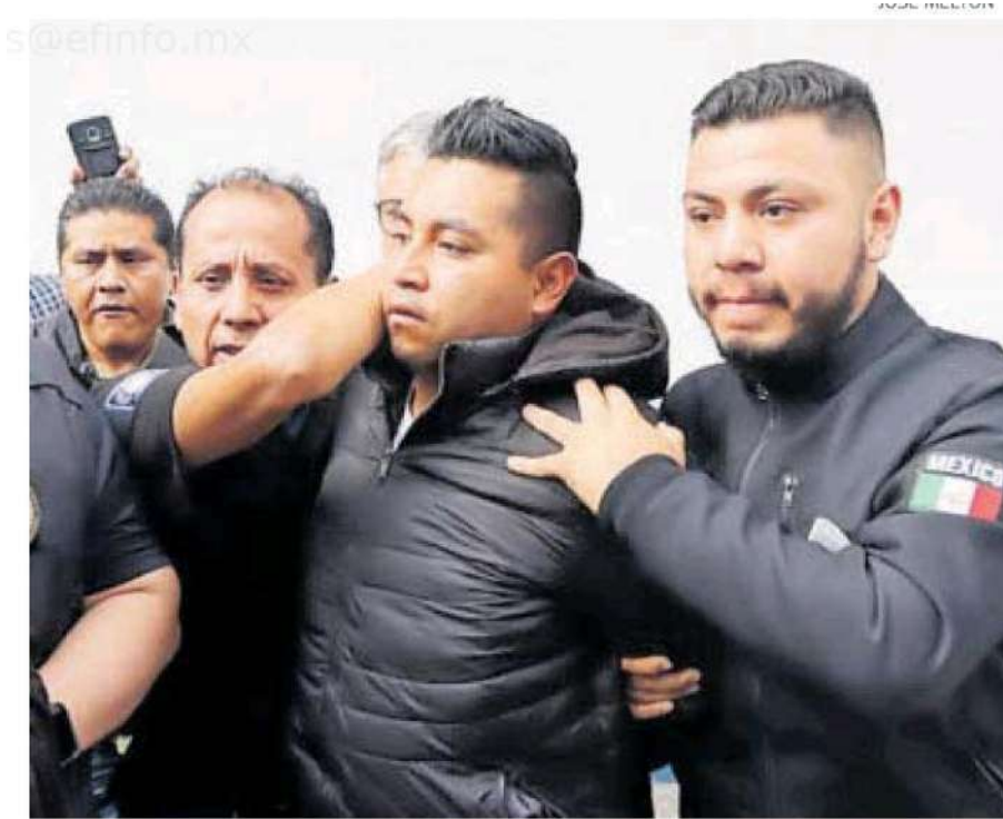
Trabajó en el sector Cuitláhuac.