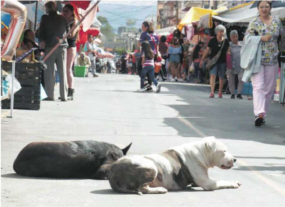
Los perros son la especie más atacada en el Estado de México y le siguen los gatos