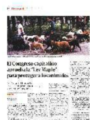
El Congreso capitulino aprobó la "Ley Maple" para proteger a los caninos.