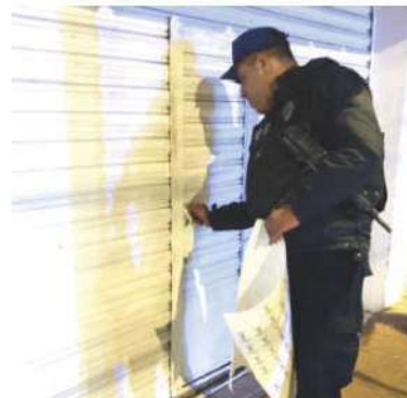
Elementos de la Policía Auxiliar colocarán "sellos de seguridad".

El objetivo principal de estas acciones es garantizar que mientras los empresarios descansan, sus patrimonios están protegidos. La alcaldía busca mantener la seguridad en Cuajimalpa, no solo salvaguardando la integridad de sus habitantes, sino también cerrando las puertas a la delincuencia. ●