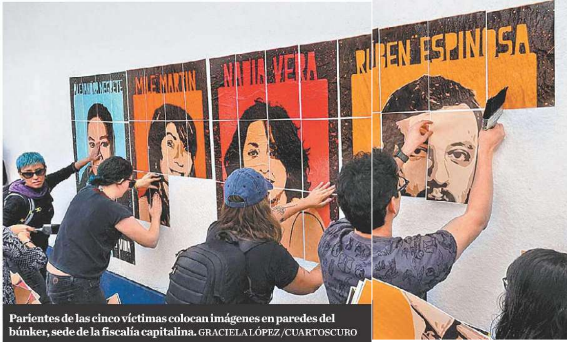
Parientes de las cinco víctimas colocan imágenes en paredes del búnker, sede de la fiscalía capitalina.