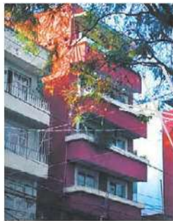
Fachada del edificio donde ocurrieron los hechos