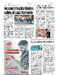
LUCHA. Para presionar a las autoridades, parientes expresaron su inconformidad ante los resultados obtenidos por las indagatorias.