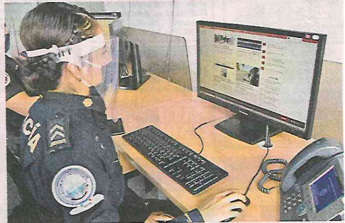
Los agentes piden activar controles parentales.

Silva enfatizó que los padres deben estar en comunicación con los maestros para conocer las clases a distancia y, de ser posible, acompañar a los menores.