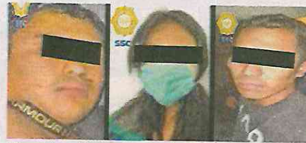
Uno de ellos es considerado presunto homicida de un hombre en la Central de Abasto

Por lo anterior, fueron detenidos dos hombres de 27 y 25 años de edad, y la joven también de 27 años, a quienes se les informaron sus derechos de ley y, junto con las dosis de droga decomisadas, quedaron a disposición del agente del Ministerio Público, quien definirá su situación legal y continuará con las investigaciones correspondientes.