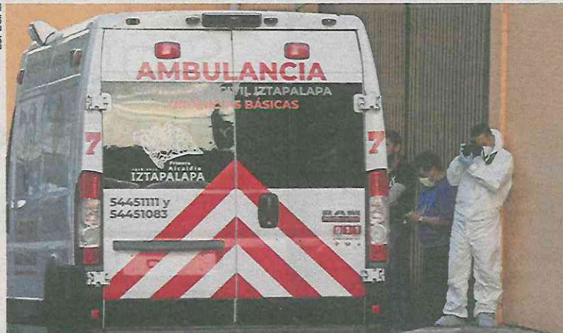
El hombre no aguantó y falleció en una unidad de Protección Civil.

ron estabilizarlo, pero no resistió y falleció a bordo de la unidad.