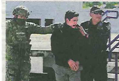
El Lunares, líder del Cártel Unión Tepito, detenido el 31 de enero.