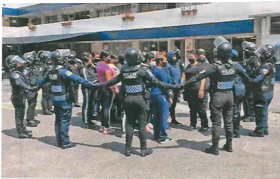
Entrenamiento constante para el encapsulamiento de grupos que destruyen el patrimonio ciudadano

manera pueden proseguir con la marcha que efectúan, y evitar los actos vandálicos que se han realizado en días pasados.