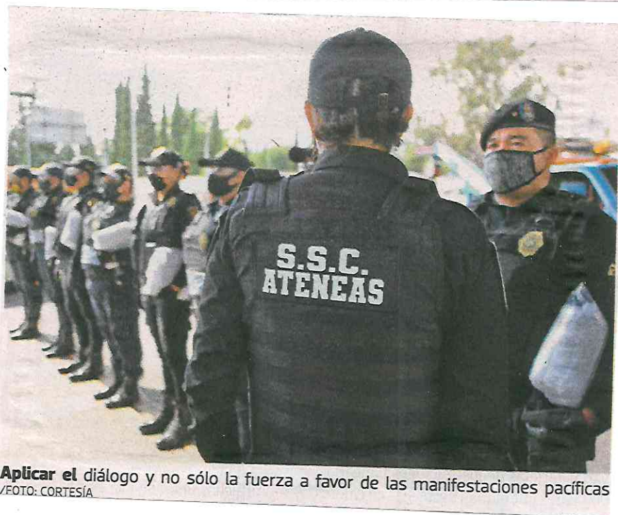
Aplicar el diálogo y no sólo la fuerza a favor de las manifestaciones pacíficas