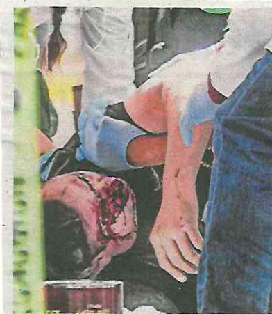
Las ejecuciones vinculadas a la Unión Tepito son constantes.