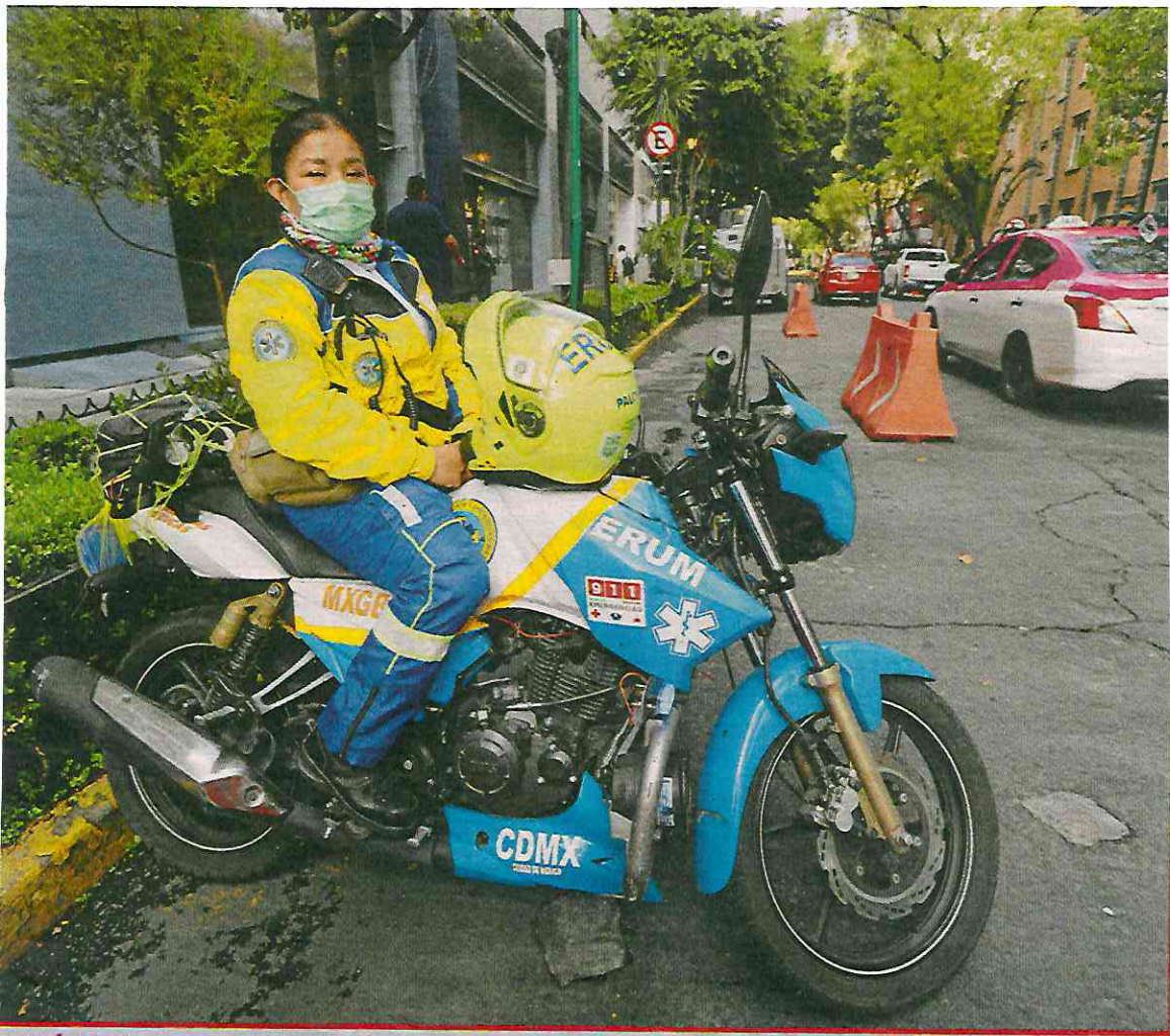
EMPÁTICA Ahora que está de vuelta en la acción, su experiencia le permite atender mejor a las personas.