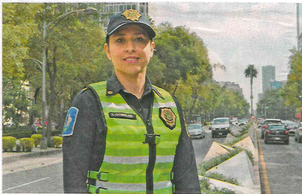
Mujer valiente que aún con actividad peligrosa se prepara constantemente