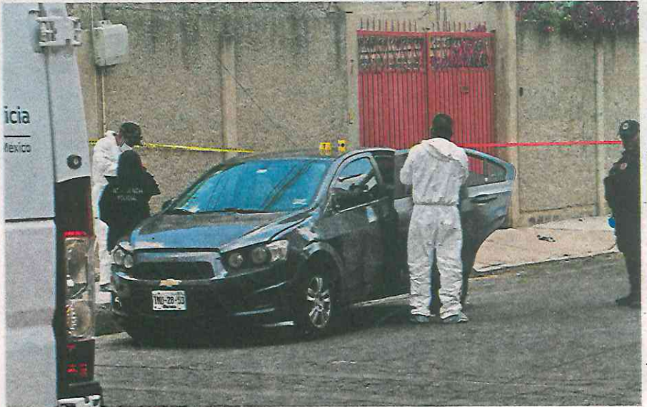
En calles de la Colonia Guerrero tuvo lugar el macabro hallazgo

Uniformados trataron de llamar en repetidas ocasiones al sujeto que se obser-