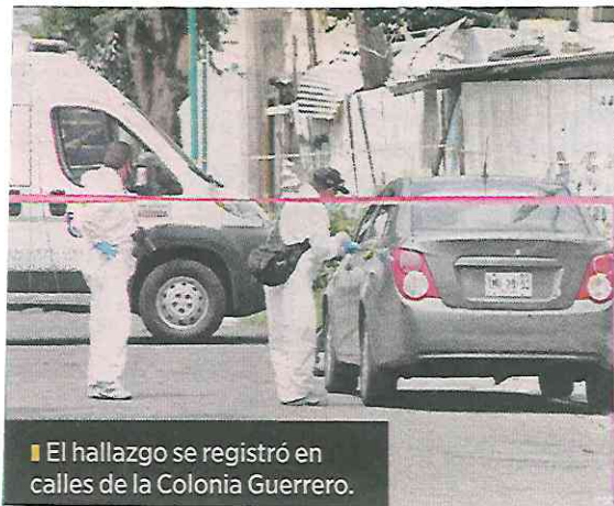
■ El hallazgo se registró en calles de la Colonia Guerrero.

Según primeras versiones, ya estaba en estado de putrefacción, pero no fue confirmado.