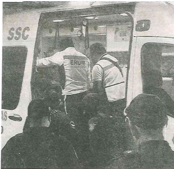
La mujer fue reportada como grave en el hospital

bargo, al ser interrogada señaló que habita en la vía pública y que, de pronto, sufrió una crisis nerviosa y se autolesionó varias veces en el tórax con un arma blanca.