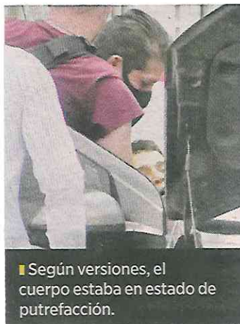
■ Según versiones, el cuerpo estaba en estado de putrefacción.