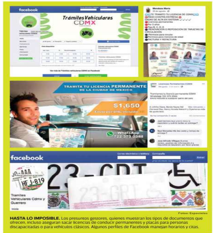
HASTA LO IMPOSIBLE. Los presuntos gestores, quienes muestran los tipos de documentos que ofrecen, incluso aseguran sacar licencias de conducir permanentes y placas para personas discapacitadas o para vehículos clásicos. Algunos perfiles de Facebook manejan horarios y citas.

La Semovi y la SSC advierten que quien adquiere este tipo de documentación por estas vías se convierte en