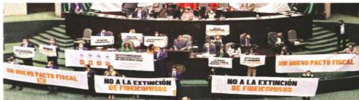
RECLAMO. Diputados opositores protestaron ayer en San Lázaro por el recorte al presupuesto y a fideicomisos durante la comparecencia del Secretario de Hacienda, Arturo Herrera.

Antes de desaparecerlo formalmente ya lo habían desmantelado y ya se había puesto en riesgo la atención de ni-