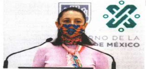
Claudia Sheinbaum expuso que el trabajo de las policías era evitar una confrontación en la manifestación del lunes pasado.

"¿Eso es feminismo?, ¿eso es lo que reivindicamos? Como feminista reivindicó la lucha de las mujeres y estoy en contra y haré todo lo que esté en mis manos como jefa de Gobierno para erradicar la violencia hacia las mu-