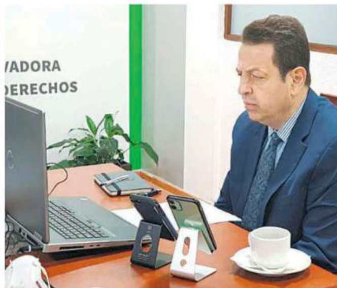
El titular de la Sedeco compareció a distancia ante comisiones unidas del Congreso capitalino

UNIDADES ECONÓMICAS con 4.2 millones de personas ocupadas en casi mil clases de actividades productivas integran la economía capitalina