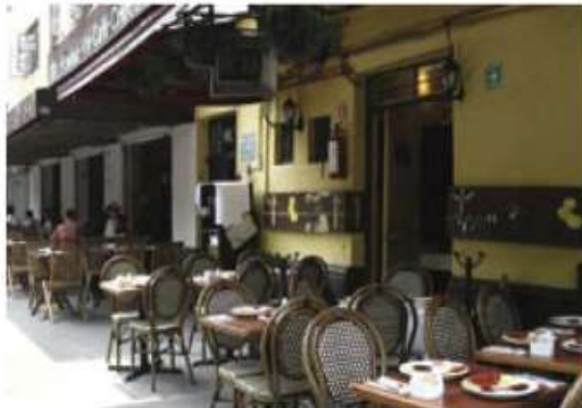
Actividad económica, afectada.

"Esperamos también que la derrama económica que ha sido siempre muy