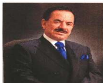
El Licenciado Juan Francisco Ealy Ortiz.