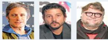
Gael García Bernal | Diego Luna | Guillermo del Toro