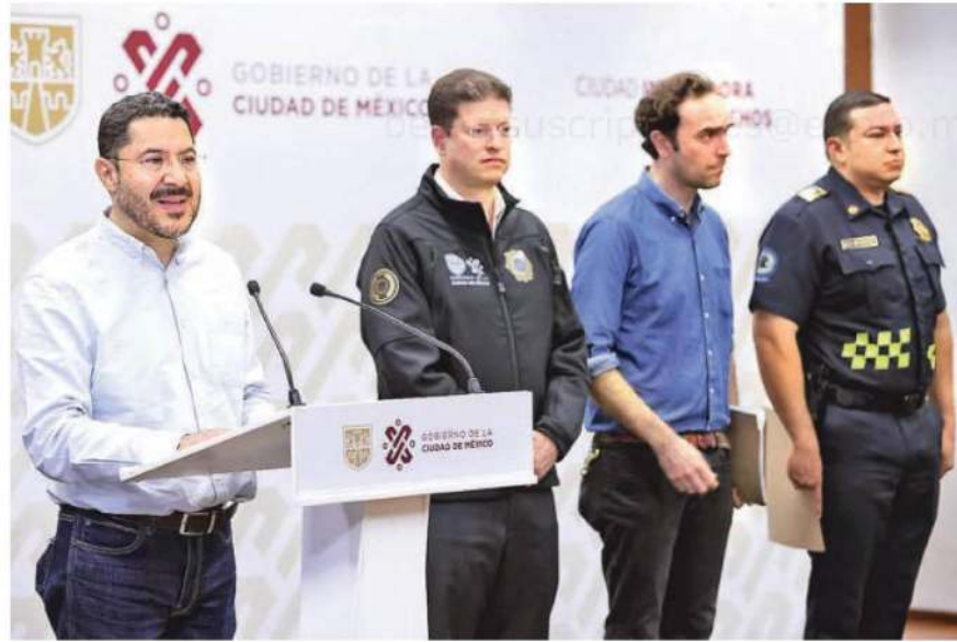
Las autoridades capitalinas exhortan a los motociclistas a cumplir con las medidas de seguridad