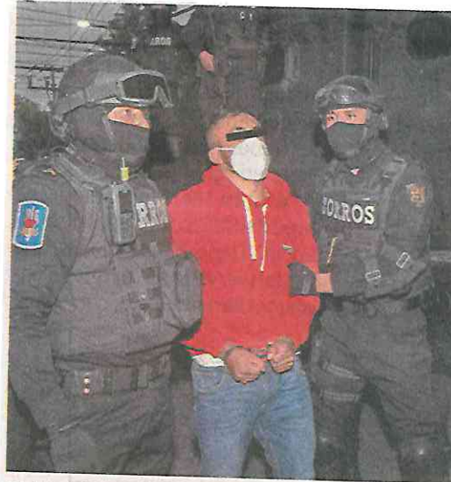
El Arex fue remitido al Reclusorio Oriente, en la Ciudad de México.

momento en que se concreta la cita presencial los vendedores son objeto de agresiones y en algunos casos son privados de la vida, como sucedió.