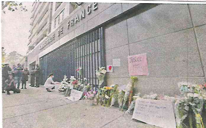
■ Frente a la Embajada de Francia también hubo ofrendas.

LUTO BLANCO. Sin gritar ni lanzar reclamos, el contingente avanzó sobre Avenida Masaryk hasta Polanquito para mostrar su dolor y exigir justicia por el doble homicidio.