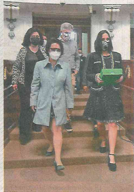
Ayer se entregó al Legislativo local el Paquete Económico 2021 de la CDMX.