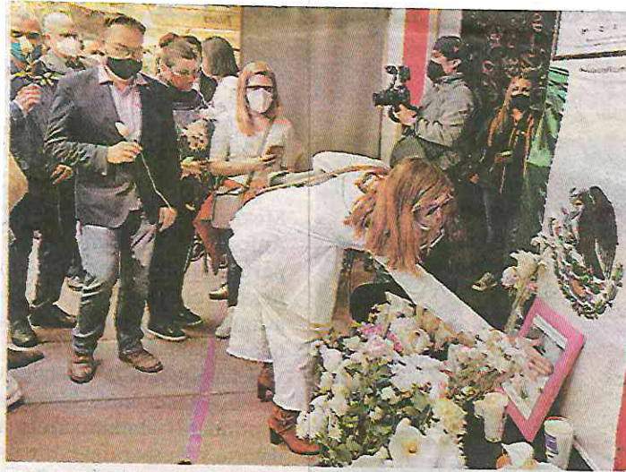
Una de las ofrendas en honor del empresario. JAVIER RÍOS