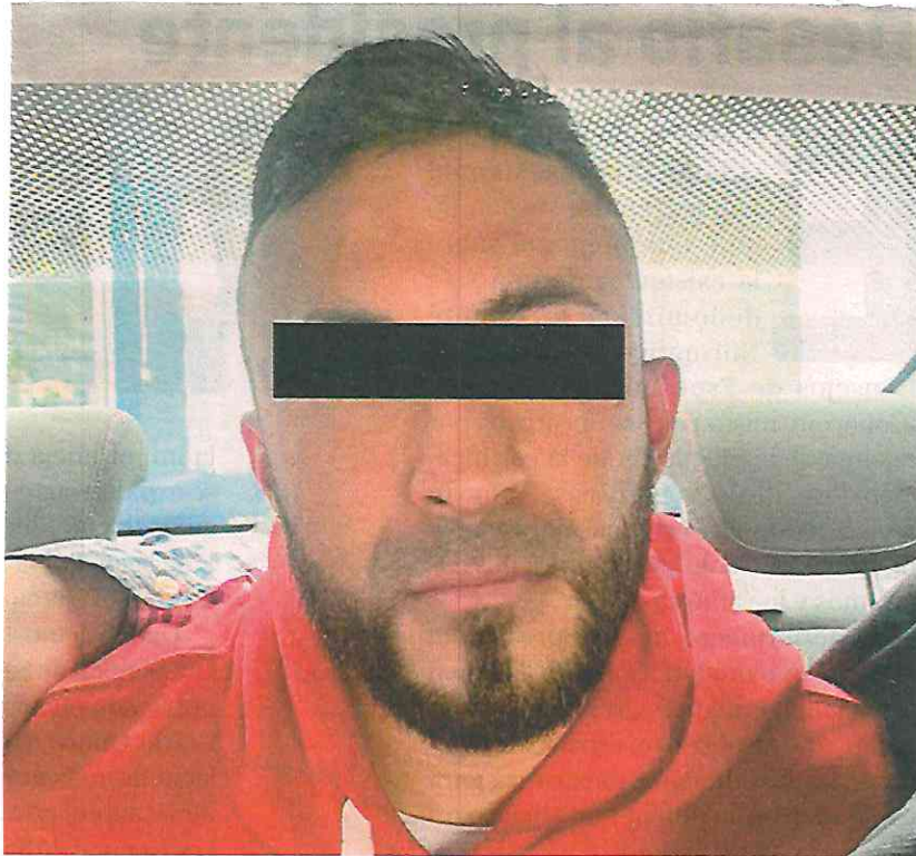
Elementos de la Secretaría de Seguridad Ciudadana llevaron a cabo la detención de un presunto responsable en la alcaldía Magdalena Contreras Especial