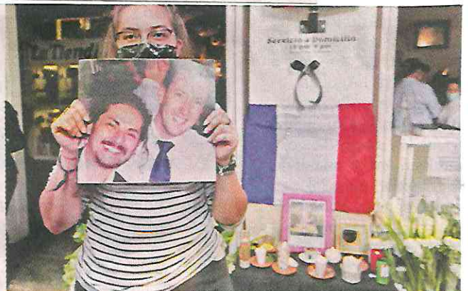
■ El restaurante fue el punto para dar el adiós al empresario.