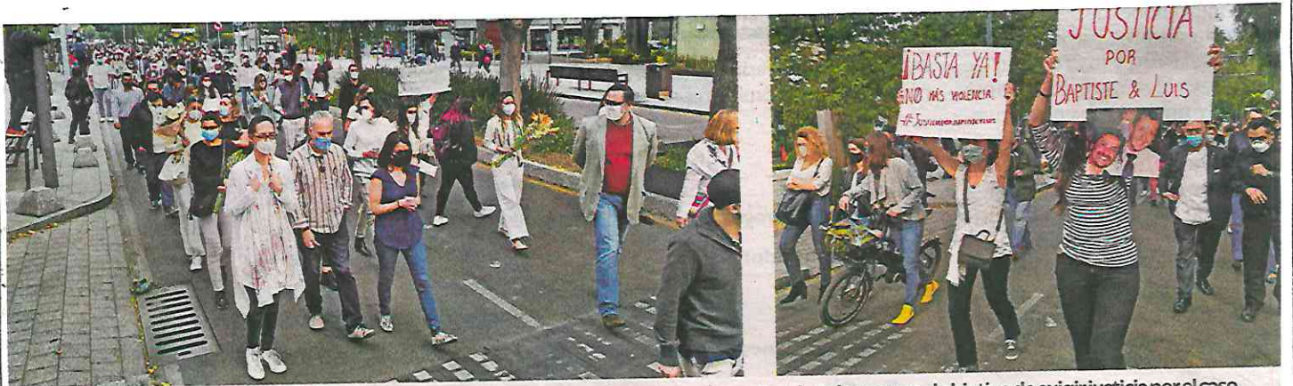
PROTESTA. Amigos y vecinos de los restauranteros asesinados se manifestaron ayer en calles de Polanco, con el objetivo de exigir justicia por el caso.