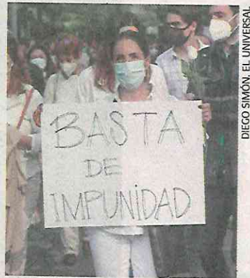
En Polanco, personas exigieron justicia por el crimen.

lación con la delincuencia organizada, el secuestro, la extorsión o el llamado cobro de piso, incluso reveló que el imputado pertenece a una banda dedicada al robo a través de internet.