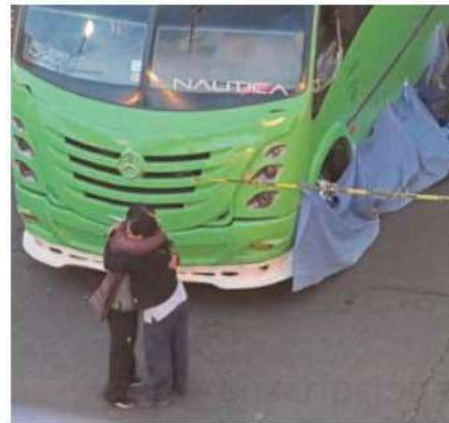
La mujer iba acompañada de su esposo