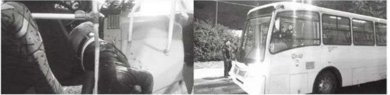
Quedó muerto frente al volante de su autobús: