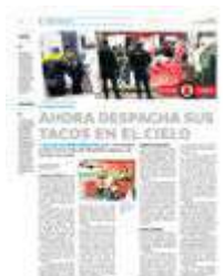
• Así luce ahora el pues- to de la víc- tima