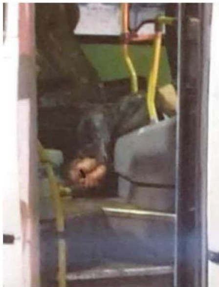
Así quedó el cuerpo en el interior del camión de pasajeros