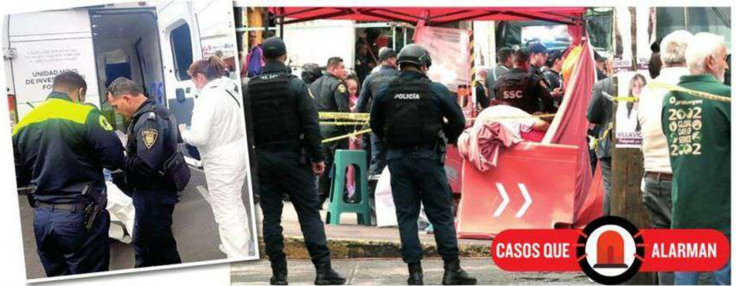
• Su muerte causó consternación