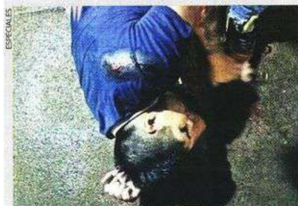
El trabajador sufrió el plomazo en el hombro izquierdo.

del Secretario Ejecutivo del Sistema Nacional de Seguridad Pública indican que se han cometido 17 casos con lesiones dolosas por arma de fuego de enero a octubre de este año en Iztacalco.