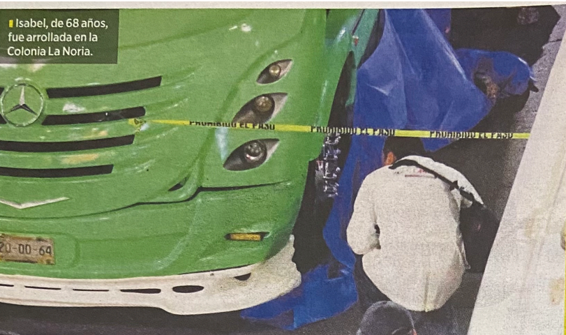
■ Isabel, de 68 años, fue arrollada en la Colonia La Noria.