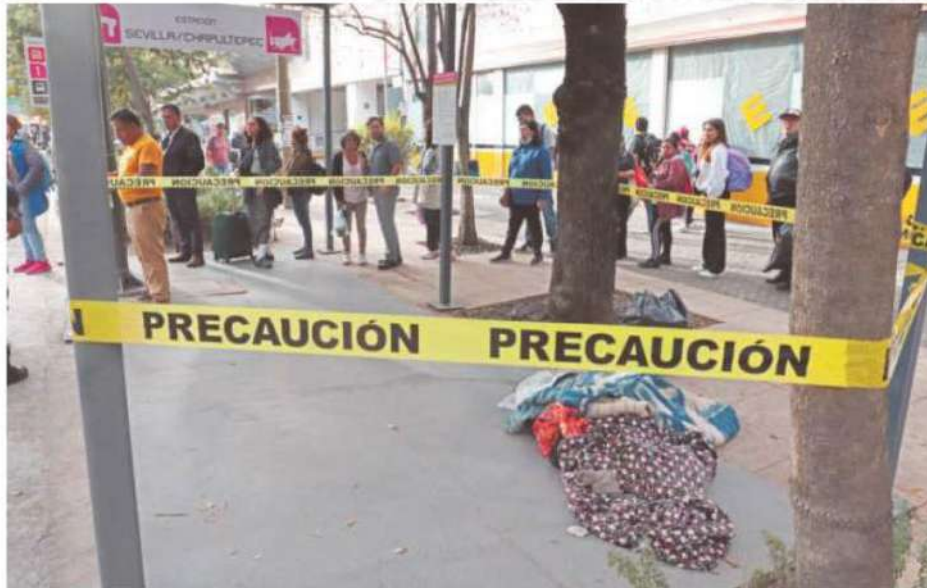
El cuerpo quedó envuelto en las cobijas que utilizaba para hacer frente a las bajas temperaturas