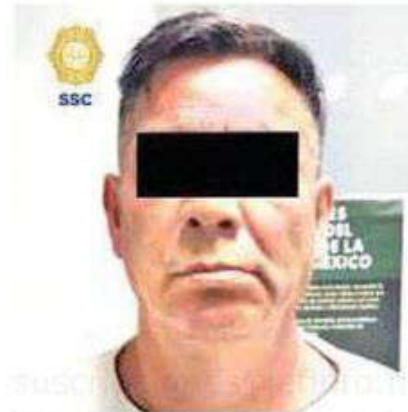
El hombre de 58 años fue puesto a disposición del MP junto con lo asegurado

Por lo anterior, el hombre de 58 años de edad fue detenido, se le comunicaron sus derechos de ley y fue puesto a disposición del agente del Ministerio Público correspondiente, quien determinará su situación jurídica.