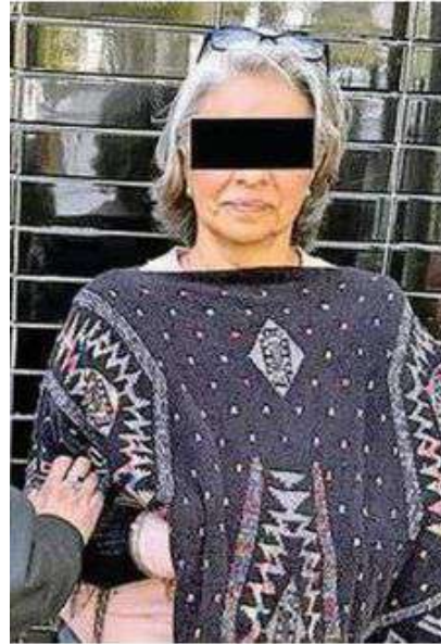
La mujer fue puesta a disposición junto con el vehículo y dinero asegurado, ante el agente del MP

Por lo anterior, la mujer fue informada del motivo de su detención, se le leyeron sus derechos de ley y fue puesta a disposición junto con el vehículo y dinero asegurado, ante el agente del Ministerio Público correspondiente, quien definirá su situación jurídica y realizará las investigaciones del caso.