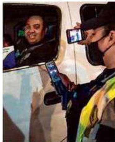
SANCIÓN. En un mes la Secretaría de Seguridad Ciudadana realizó pruebas aleatorias en la capital.

Cabe destacar que el artículo 50 señala que está prohibido conducir vehículos motorizados cuando se rebase los 0.40 grados de alcoholemia, así como bajo el influjo de narcóticos, estupefacientes o psicotrópicos. /ANGELORTIZ