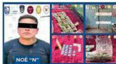
Detenido presunto narcomenudista en la colonia San Felipe de Jesús.

Después de asegurar indicios, fueron puestos a disposición, junto con una persona que fue encontrada dentro del lugar