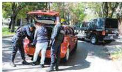
El gobierno de Huixquilucan realizó 7 mil operativos de seguridad.

Entre los operativos de seguridad y prevención que se llevan a cabo en el municipio, se encuentran Blindaje, Carrusel, Cuentahabiente Seguro, Escudo, Filtro, Huixquilucan Seguro, Metropolitano, Mochila Segura, Pasajero Seguro, Presencia y Tecolote, entre otros; además de acciones que se implementan en coordinación con instancias como la Guardia Nacional, Policía de la Ciudad de México (SSC), la Secretaría de Seguridad Pública del Estado de México (SSEM) y alcaldías y municipios vecinos.