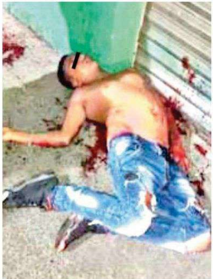
Los cuerpos bañados en sangre por las heridas de arma blanca quedaron tendidos en el piso uno cerca del otro