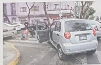
El automovilista en todo momento consolaba y ofrecía disculpas al adulto mayor