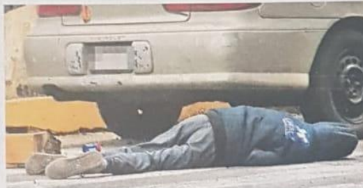
El asecador de calzado fue arrollado cuando intentaba cruzar una calle, en la colonia Buenavista

El accidente se dio durante las primeras horas de este lunes, cuando un señor