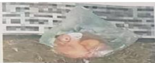
Junto con la cabeza de puerco, dejaron una manta con un mensaje intimidante