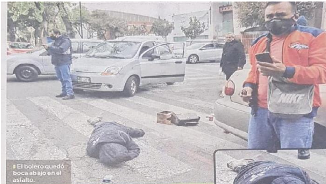
El bolero quedó boca abajo en el asfalto.