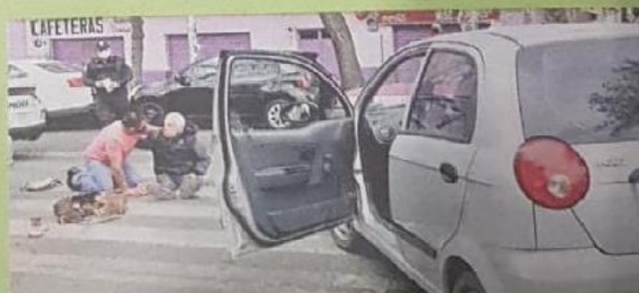
El conductor entró en crisis y el anciano lo calmó.