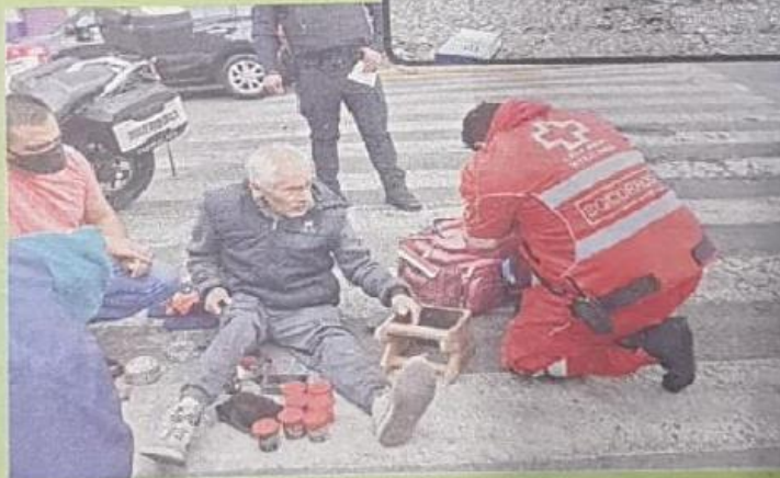
El anciano sufrió algunos golpes leves.

El anciano pidió a los policías que cancelaran la ambulancia, pero aún así lo revisaron.