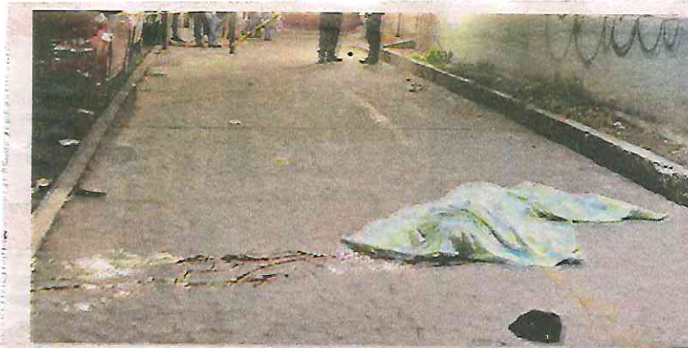
Este hombre se arrojó desde el sexto piso de un edificio en la Colonia Doctores