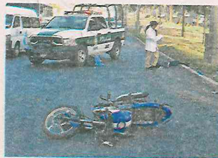
Sobre al asfalto quedó el cuerpo del motociclista

Uniformados observaron a un sujeto tirado sobre la vía vehicular que no se movía, ni respondía a los llama-