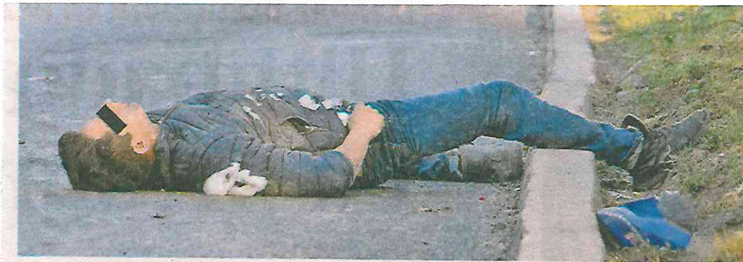
Nada pudieron hacer los paramédicos