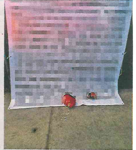
Las cabezas humanas fueron desolladas y colocadas por manos criminales junto al mensaje amenazante en el Reclusorio Oriente de la CDMX

Autoridades de la Fiscalía General de Justicia de la CDMX y funcionarios del Sistema Penitenciario capitalino se coordinan en la investigación para localizar y detener a quienes dejaron el mensaje amenazante