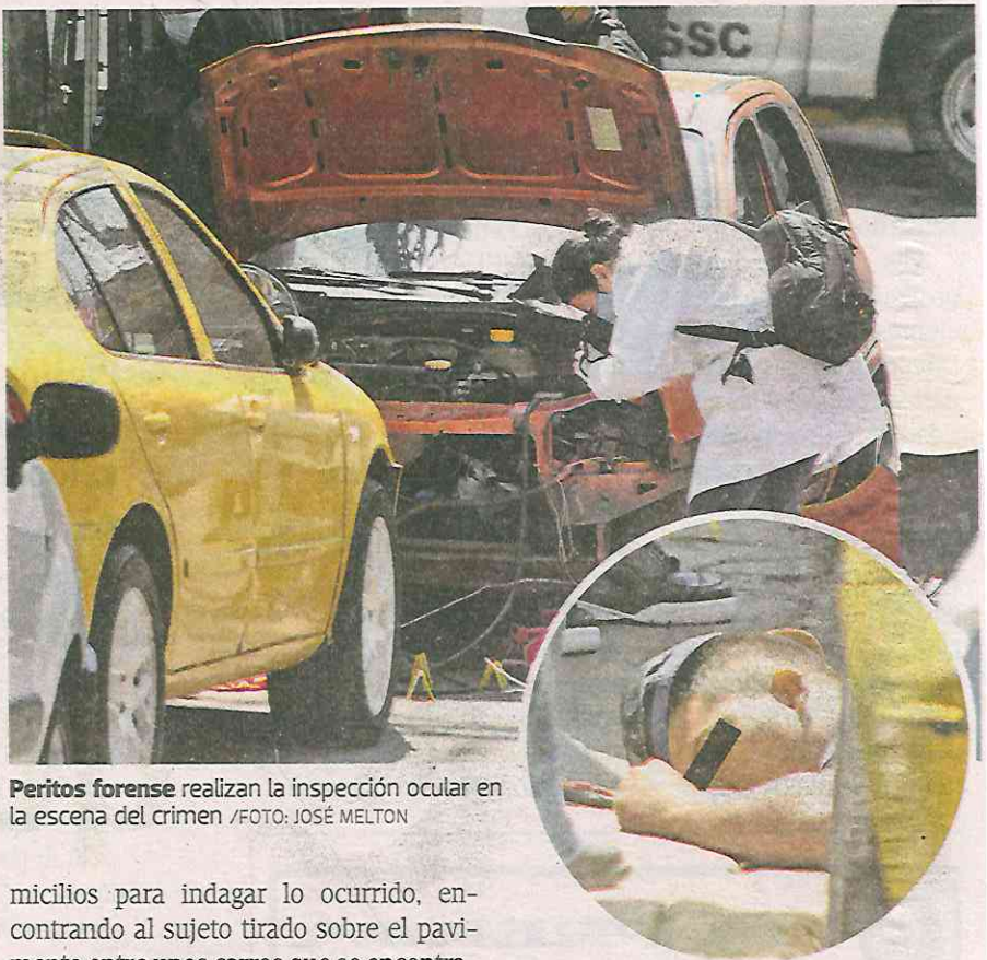
Peritos forense realizan la inspección ocular en la escena del crimen

micilios para indagar lo ocurrido, encontrando al sujeto tirado sobre el pavimento entre unos carros que se encontraban estacionados en el lugar y sobren un charco de sangre por lo que de inmediato dieron aviso a las autoridades.