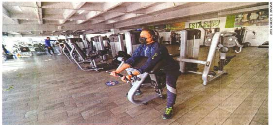
En el Estado de México, los gimnasios que abrieron sus puertas operaron a 25% de su capacidad y en espacios ventilados y con medidas más estrictas para evitar contagios; sin embargo, no se registró mucha asistencia.

Aunque los gimnasios en este espacio están abiertos, apenas se permite 30% del total de asistentes: los baños, el vapor y ciertas áreas comunes están clausuradas y, se asegura, se abrirán hasta que las autoridades capitalinas anuncien que estamos en semáforo verde.