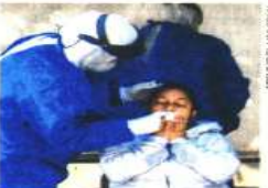
Farmacias y plazas comerciales ahora aplican pruebas gratuitas.

Asimismo, para detectar más contagios, el Gobierno local y el sector privado pusieron en marcha la realización de 2 mil pruebas adicionales diarias en 42 farmacias privadas y 10 plazas comerciales, que se suman a los 230 puntos de toma de muestras gratuitas de Salud capitalina.