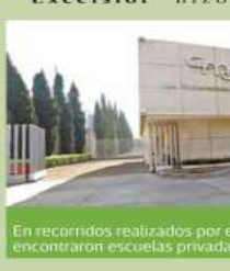
En recorridos realizados por este diario y la autoridad no se encontraron escuelas privadas con clases presenciales.

Excélsior hizo recorridos por diversos colegios del sur de la ciudad y no se detectaron actividades.