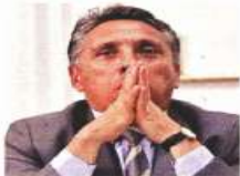
■ Negrete dejará Coyoacán y probará suerte en Guerrero.

Apenas el 27 de enero, Negrete difundió una carta vía redes sociales en la que agradecía a Morena la invitación para contender por una curul, pero aseguraba que prefería mantenerse en