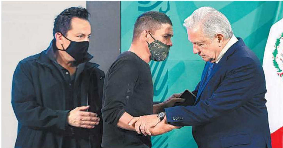
Un espontáneo se coló en Palacio Nacional hasta llegar al Presidente y habló con él durante un minuto.