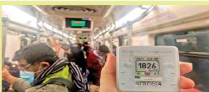
Fotos: Cortesía #COVIDCO2 DENTRO DE UN CONVOY. Han registrado hasta mil 826 partes por millón de dióxido de carbono, cinco veces más del límite recomendado por los expertos en transmisión de covid-19.

Por ello llamó a que las autoridades y usuarios tomen conciencia y procuren mantener una