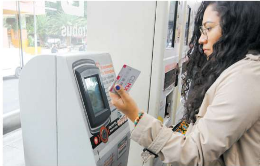
Se renovarán las máquinas, torniquetes y sistema de recargo de las tres primeras líneas para dar paso a esta nueva modalidad de cobro

No va a ser con el calendario de las alcaldías, sino un calendario especial para todo el Sistema Penitenciario”