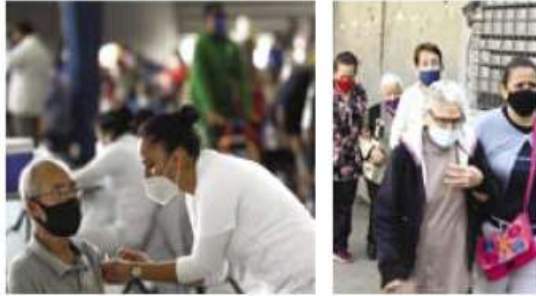
Continúa la vacunación de adultos mayores en CDMX.

En el quinto día de inoculación para Covid-19 en las alcaldías Iztacalco, Tláhuac y Xochimilco, el gobierno de la Ciudad de México decidió modificar la presentación de la información, ya que en los días anteriores no se alcanzaba el 100 por