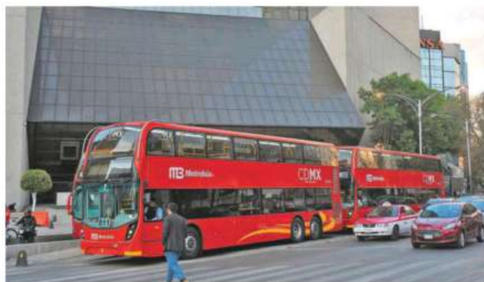
La Tarjeta de Movilidad Integrada seguirá operando para todo el transporte público de la Ciudad de México

El funcionario comentó que mudar las máquinas y torniquetes para tener ese nue-