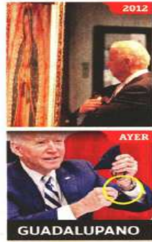
El Presidente Joe Biden recordó su visita a la Basílica de Guadalupe en marzo del 2012 cuando era Vicepresidente de EU.

Según el diario, Biden espera que el Presidente mexi-