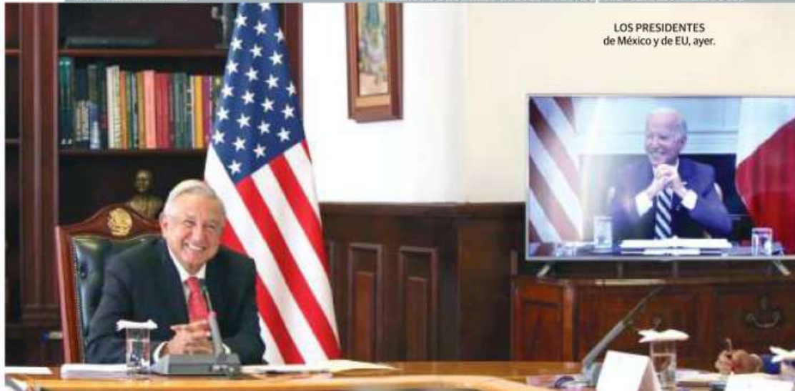
LOS PRESIDENTES de México y de EU, ayer.

"BENDITO MÉXICO, tan cerca de Dios y no tan lejos de Estados Unidos" ANDRÉS MANUEL LÓPEZ OBRADOR Presidente de México