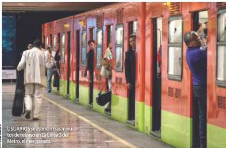
USUARIOS se asoman tras minutos de retraso en La Línea 3 del Metro, el mes pasado.