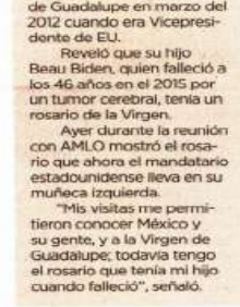
Reveló que su hijo Beau Biden, quien falleció a los 46 años en el 2015 por un tumor cerebral, tenía un rosario de la Virgen. Ayer durante la reunión con AMLO mostró el rosario que ahora el mandatario estadounidense lleva en su muñeca izquierda. "Mis visitas me permitieron conocer México y su gente, y a la Virgen de Guadalupe; todavía tengo el rosario que tenía mi hijo cuando falleció", señaló.

cano se convierta en un aliado para prevenir otro ciclo de migración descontrolada desde Centroamérica.