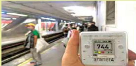
En los pasillos y andenes, que son espacios menos cerrados, las concentraciones de CO2 detectadas son menores.