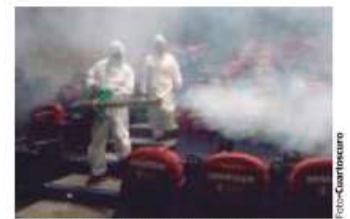
SANITIZACIÓN de la Cineteca, ayer.

En CDMX y Edomex reanudan 980 salas; en algunas, afluencia de 10 espectadores; de los museos sólo 4 reanudan actividades, en otros faltan condiciones. págs. 20 y 21