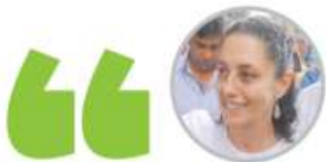
CLAUDIA SHEINBAUM JEFA DE GOBIERNO

“Decírselas a las personas que están en los centros penitenciarios que van a recibir sus vacunas, igual que lo estamos haciendo ahora, les vamos a informar a familiares cuándo”, añadió.