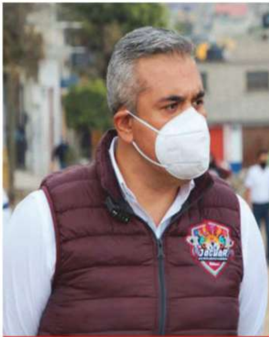
Fernando Vilchis Contreras, presidente municipal de Ecatepec.

❖ Fernando Vilchis Contreras señala que ha sido perseguido luego de solicitar la depuración de mandos de dicha corporación por incapacidad para investigar y combatir los delitos de alto impacto en la demarcación