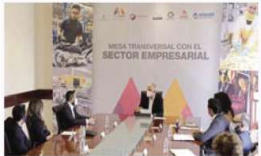
TOLUCA, Méx.- Alfredo del Mazo.