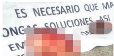
En el lugar fue dejada una cabeza humana desollada y una manta.

Una de las líneas de investigación que tienen las autoridades judiciales es que pueda tratarse de una venganza de integrantes de La Unión Tepitot contra personal penitenciario que presuntamente colabora con un interno conocido como El 24, identificado con el Cárnel de Sinaloa.