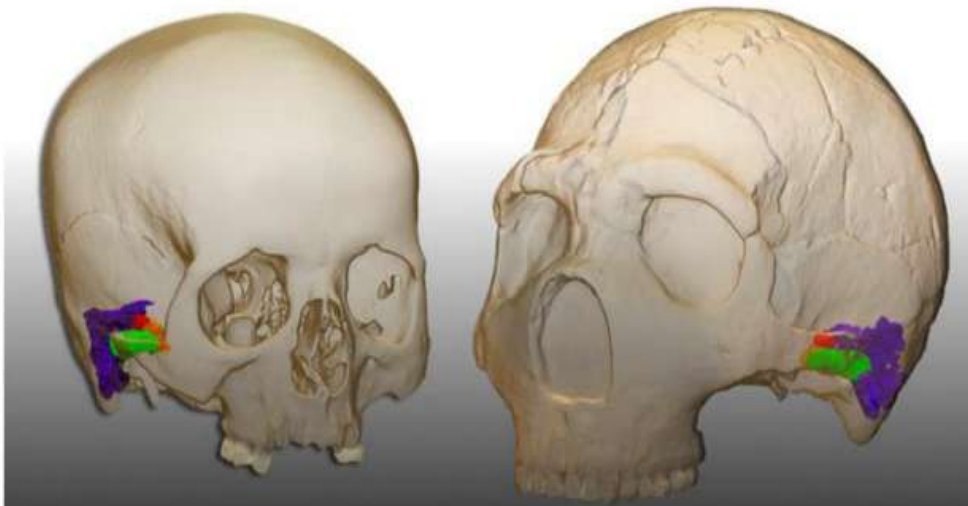
Un equipo internacional de la Cátedra de Otoacústica de la Universidad de Alcalá, España, realizó la reconstrucción virtual del oído en un humano moderno (izquierda) y en un neandertal (derecha), llegando a la conclusión de que los neandertales tenían la misma capacidad auditiva y las herramientas físicas y mentales para el lenguaje como nosotros. 17

LOS NEANDERTALES HABLABAN Y ESCUCHABAN COMO LOS SAPIENS