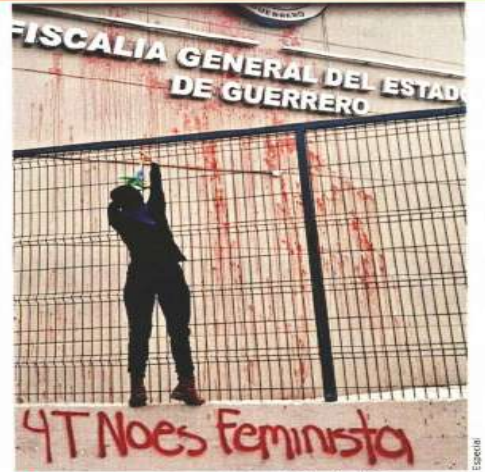
Un grupo de mujeres protestó en la Fiscalía de Guerrero por la lentitud para resolver la denuncia contra Salgado.

López Obrador pareció abierto a la colaboración, señaló el diario.