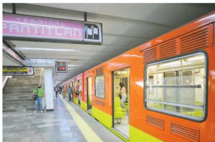
Pronto iniciarán los trabajos de modernización en la Línea 1 del Metro en la CD-MX

"Se hizo una licitación muy amplia internacional para la modernización de la línea 1. Estamos trabajando con quien ganó la licitación que dio el seguimiento, la Unidad de Proyectos de Naciones Unidas para que sea incluida otra parte que tiene que ver con el siniestro que vivió el Metro, particularmente para que sean integradas las otras líneas que estaban contempladas en el Puesto de Control Central", comentó.