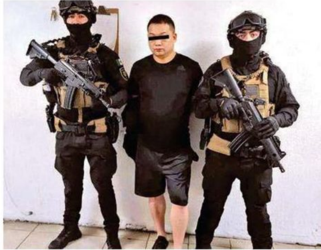
Un hombre de origen chino fue detenido en el operativo

De acuerdo a las investigaciones esta organización delictiva internacional robaba vehículos de alta gama en Estados Unidos, los traía a México, donde los remarcaban y revenden a través de redes sociales.