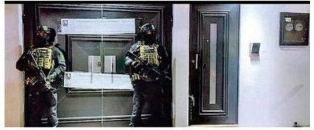
La Fiscalía capitalina dio fuerte golpe a la delincuencia organizada dedicada al robo de vehículos de alta gama que tiene nexos con cómplices en EU, México y China