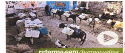
Los repartidores, quienes suben hasta el cerro, se surten de tomas del Sistema de Aguas de la Ciudad.

Los repartidores de agua recorren alrededor de cuatro kilómetros desde las tomas de agua hacia la zona de cerros para entregar sus garrafones de 20 litros a cerca de 200 familias.