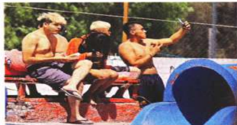
Decenas de familias visitaron el balneario para despejarse, luego de que algunas no salieran desde hace un año.

“Queremos que todo salga bien para que a todos nos ayude estar abiertos y no haya enfermedad, en el agua no se contagia y afuera vemos que sigan las medidas”, decía uno de los administradores y vigilantes.