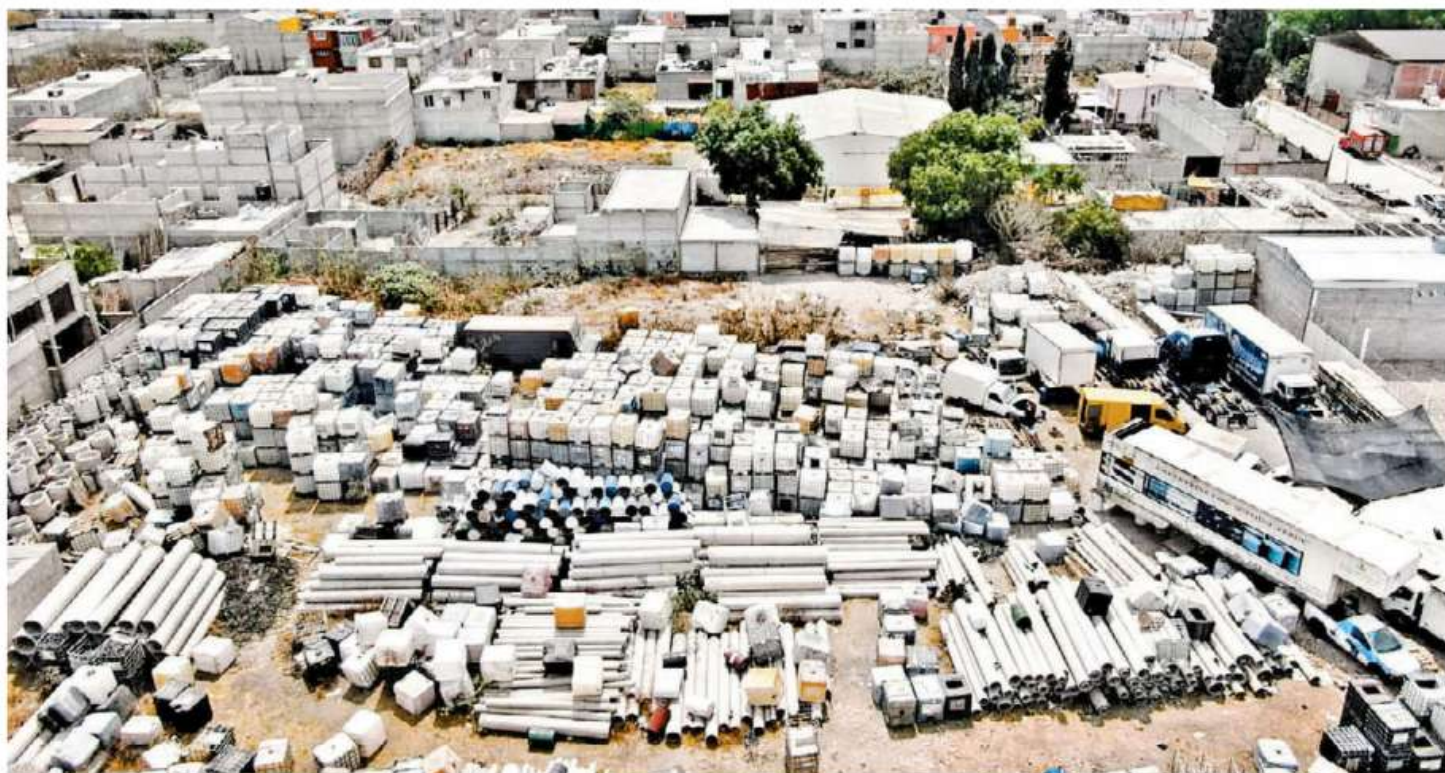
La delincuencia pinchaba el ducto Tuxpan-Azapotzalco entre los kilómetros 290 y 295; hay 250 mil contenedores en dos predios de más de 7 mil m 2 .