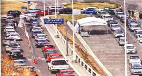
En plena Semana Santa, la pandemia ofrece contrastes, quienes buscan distraerse del confinamiento y los que ponen en la vacuna la esperanza.