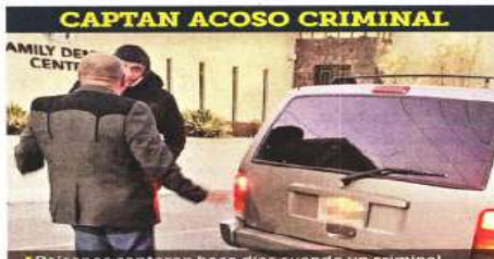
CAPTAN ACOSO CRIMINAL

Algunos afectados señalaron que la "cuota" puede superar los 20 dólares por cada vehículo de la caravana, integrada por decenas de unidades. "El oficial" me dijo: "Si usted nos quiere dar una propina, es de su corazón y de su