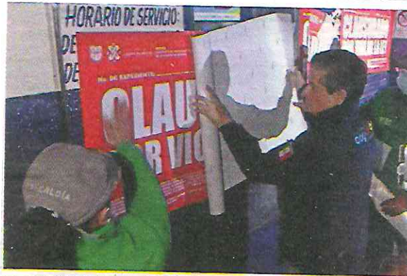
EL ALCALDE Giovanni Gutiérrez encabezó la clausura de negocios irregulares durante el pasado fin de semana,

Estos negocios irregulares, dijo, estaban ubicados en estacionamientos de unidades habitacionales, cerca de parques, deportivos, escuelas, en locales comerciales disfrazados de estéticas, en tianguis o mercados soberruedas o, incluso, en autos particulares, cuyas cajuelas eran usadas como bodegas.