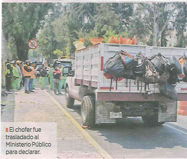
■ El chofer fue trasladado al Ministerio Público para declarar.