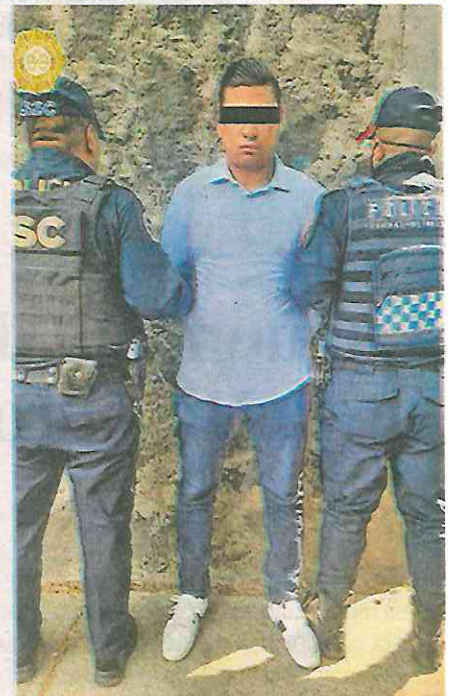
A la hora de su captura le aseguraron 19 tarjetas de diferentes instituciones bancarias y dos identificaciones

Por tal motivo, al detenido, de 30 años de edad, se le leyeron sus derechos de ley y fue puesto a disposición ante el agente del Ministerio Público correspondiente, quien definirá su situación jurídica.