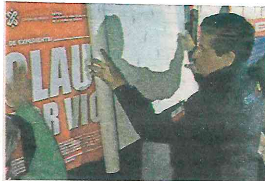
El fin, garantizar la seguridad, dice el alcalde

chelerías se han cerrado en diferentes colonias de la demarcación