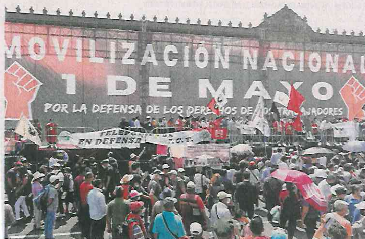
La concentración por el Día del Trabajo en el Zócalo terminó con bebidas alcohólicas, música de banda en vivo y baile.