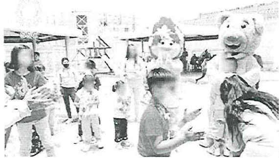
SSC. Las niñas y niños que viven en el Penal de Santa Martha recibieron con alegría los obsequios.