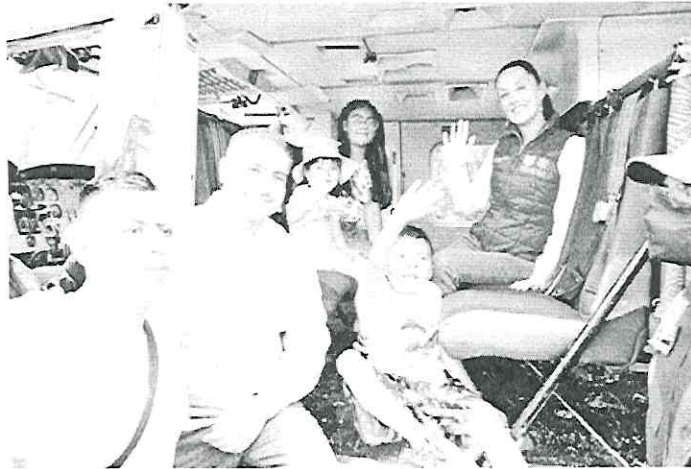
DISFRUTE. La jefa de Gobierno encabezó la celebración en las instalaciones de la Policía Montada de la CDMX.