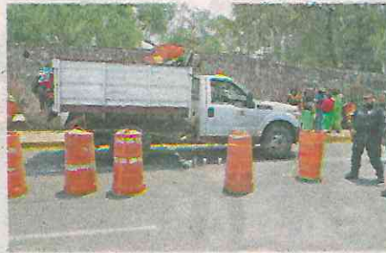
El accidente ocurrió en la colonia San Juan y Guadalupe Ticomán

Ahí, oficiales de la Secretaría de Seguridad Ciudadana, con tambos color naran-