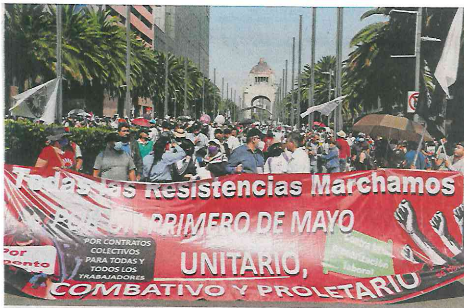
Alrededor de 75 organizaciones sindicales, agrupadas en la Conferencia Nacional de la Resistencia, marcharon al Zócalo de la Ciudad de México este Día del Trabajo.

La concentración terminó con bebidas alcohólicas y música de banda en vivo, que hizo bailar a varias parejas que le sacaron brillo a la plancha del Zócalo, con vaso o lata de cerveza en mano para refrescarse en una tarde de domingo en la que el sol cayó a plomo en la Ciudad de México. ●