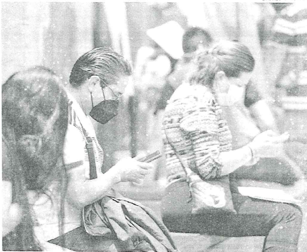
Las víctimas recurrieron a la policía cibernética en busca de apoyo