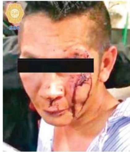
Transeúntes que se percataron de la violencia de género lo retuvieron y agredieron

De manera inmediata, los oficiales acudieron al lugar de los hechos y tras resguardar la integridad física del probable implicado, la denunciante lo identificó como el responsable de agredirla y solicitó proceder legalmente en su contra.