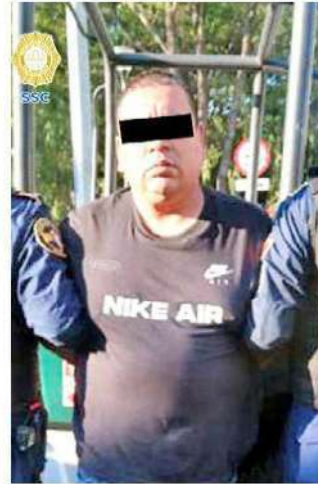
DETENIDO. Policías de la SSC capturaron al presunto agresor quien huyó en un taxi.

Los elementos de seguridad localizaron al agresor en un domicilio particular donde fue detenido y se le aseguró el arma de fuego. También, persiguieron a tres personas, dos hombres y una mujer, que viajaban en la camioneta y luego de varios minutos lograron cerrarles el paso y hacer la captura. /ÁNCELORTIZ