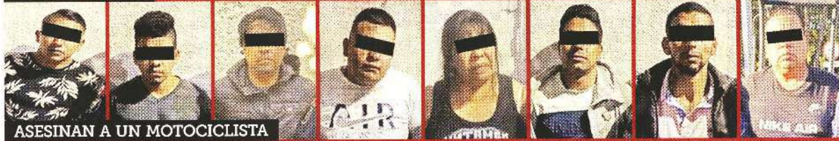
■ Dosis de mariguana y cocaína fueron decomisadas.

Los seis detenidos fueron trasladados a las instalaciones de la Fiscalía capitalina.