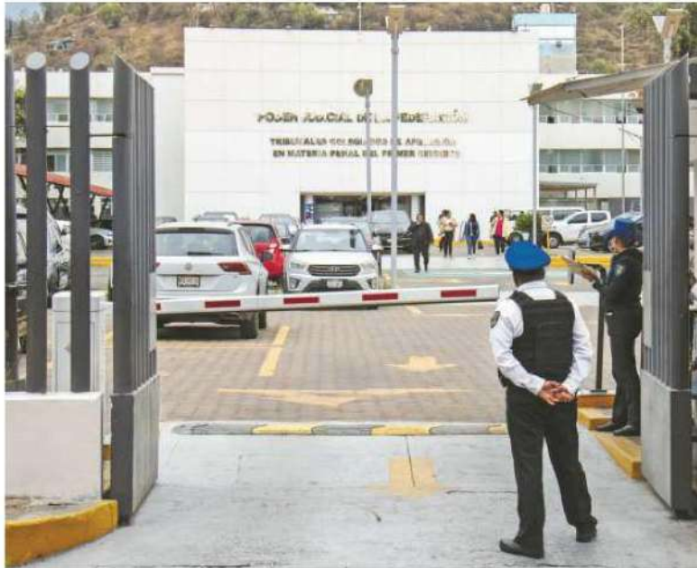
El dinero también se utilizará en mejorar la policía penitenciaria