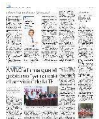
Manifestación. Trabajadores de diferentes sindicatos, ayer, en CDMX.