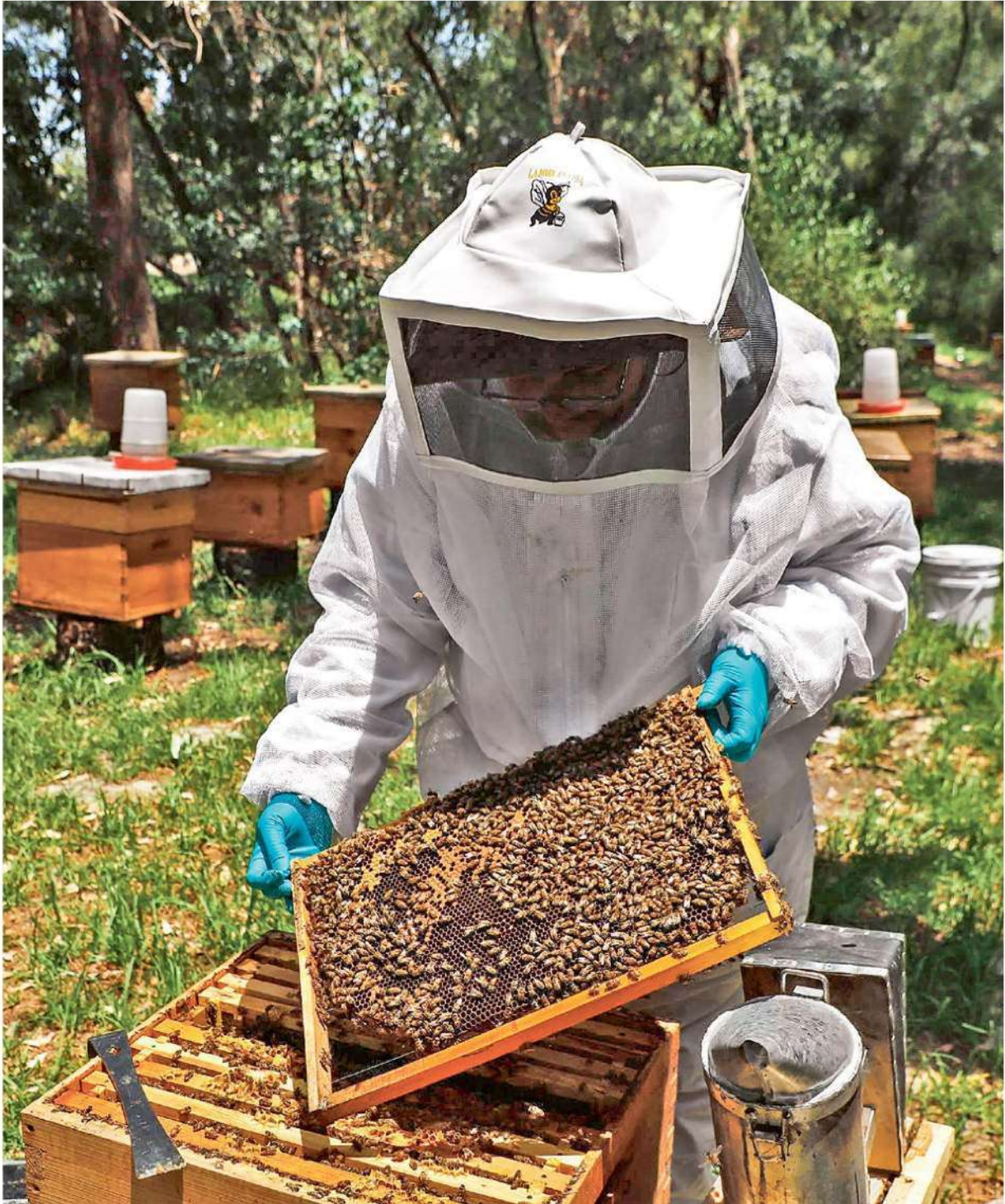
SALVAMENTOS. Los enjambres retirados por bomberos en la CDMX son trasladados a un apiario donde rescatan a las abejas para que continúen la producción de miel y polinización CDMX P. 7