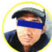
Policías lograron atraparlo.

Los uniformados capitalinos pidieron el apoyo de los paramédicos, quienes al checar a la víctima informaron que éste ya había perdido la vida a consecuencia de las puñaladas que recibió.