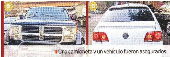
■ Una camioneta y un vehículo fueron asegurados.