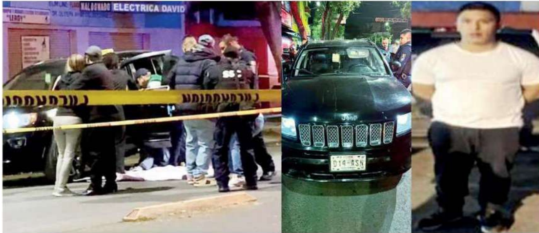
Se trató de una vendetta entre exreos