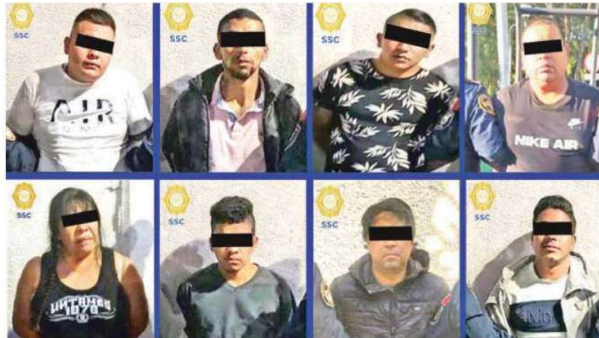
Al parecer los sujetos son integrantes de una célula delictiva dedicada al narco-menudeo en la Alcaldía Álvaro Obregón

Las investigaciones continúan a fin de establecer a que grupo criminal pertenecen los detenidos.