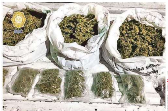
A los detenidos se les aseguró el arma larga con la que presuntamente se cometió el crimen, así como importante cantidad de marihuana en greña y varias dosis de esta