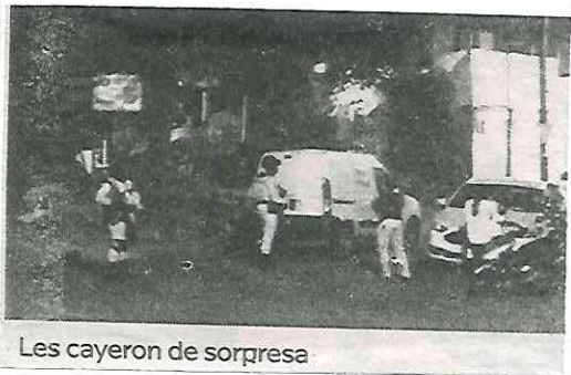
Les cayeron de sorpresa

En el lugar, dos hombres fueron detenidos por las autoridades, quienes al notar la presencia de la policía trataron de huir por las azoteas, pero no lo consiguieron y tras una breve persecución fueron atrapados por las fuerzas del orden y remitidos a la Fiscalía contra Narcomenudeo.