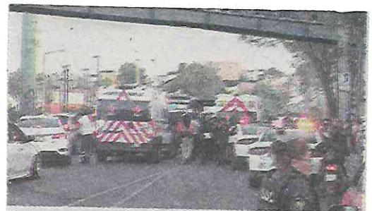
Gran movilización de la policía

Los hechos se registraron pocas horas después de que ocurriera una balacera en las inmediaciones de la colonia Consejo Agrarista Mexicano, en la alcaldía Iztapalapa, donde una persona murió, dos resultaron heridas y tres presuntos responsables fueron detenidos por la policía capitalina.