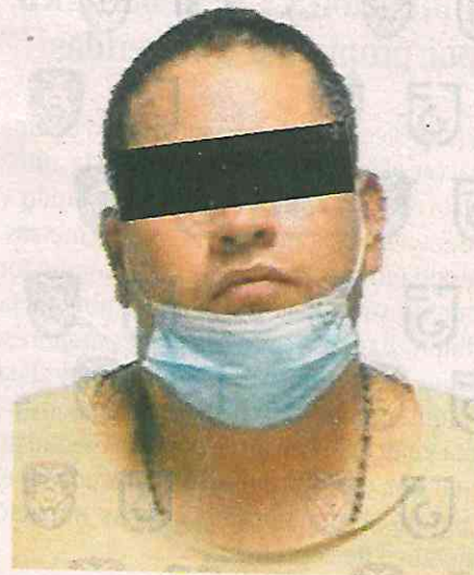
Abel "N" encomendaría a "El Choche" un trabajo sangriento en el Centro Histórico

Fue el "Choche", quien se encuentra bajo proceso por el delito de homicidio, tras ser detenido el 10 de noviembre de 2020, por elementos preventivos cuando transportaba cajas de plástico con los cuerpos de las víctimas en un diablito en la calle República de Chile, colonia Centro, Alcaldía Cuauhtémoc, el que identificó a Abel "N".