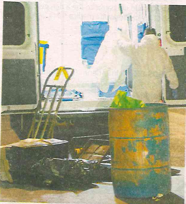
Ese entonces policías pescaron a quien llevaba los cuerpos a tirar en la calle