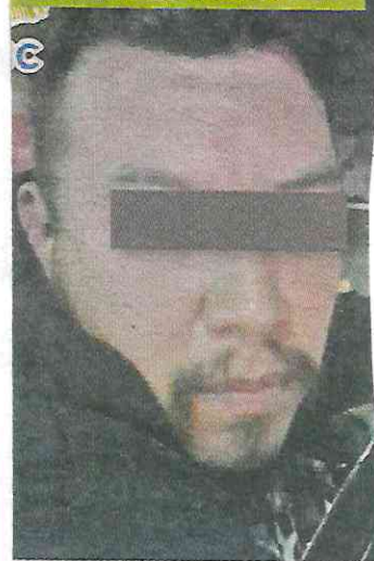
ROSTRO CUBIERTO POR LA AUTORIDAD