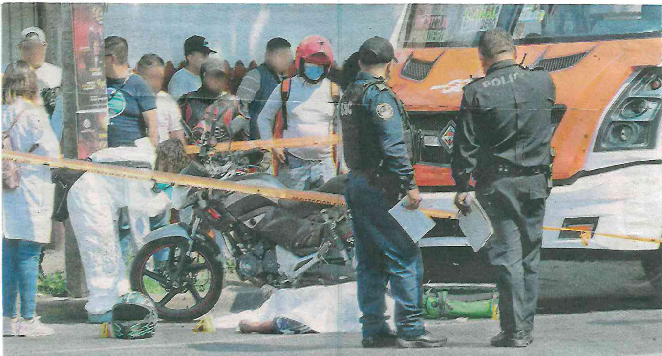
Los cuerpos de emergencia nada pudieron hacer por el repartidor que llevó su último encargo