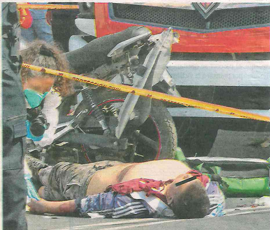
Sólo chirridos metálicos y brincos dio la unidad de pasajeros tras arrastrar al motoneto

motociclistas, llegaron al sitio luego de enterarse de lo ocurrido, buscando contactar a familiares del masculino para notificarles sobre el hecho, mientras que el chofer involucrado fue detenido.