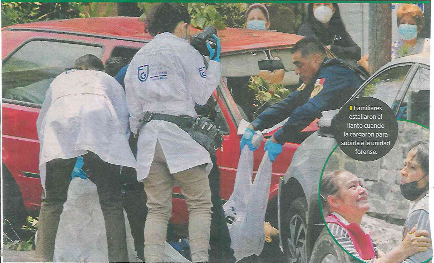
■ Familiares estallaron el llanto cuando la cargaron para subirla a la unidad forense.