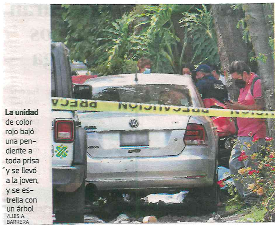
La unidad de color rojo bajó una pendiente a toda prisa y se llevó a la joven, y se estrella con un árbol