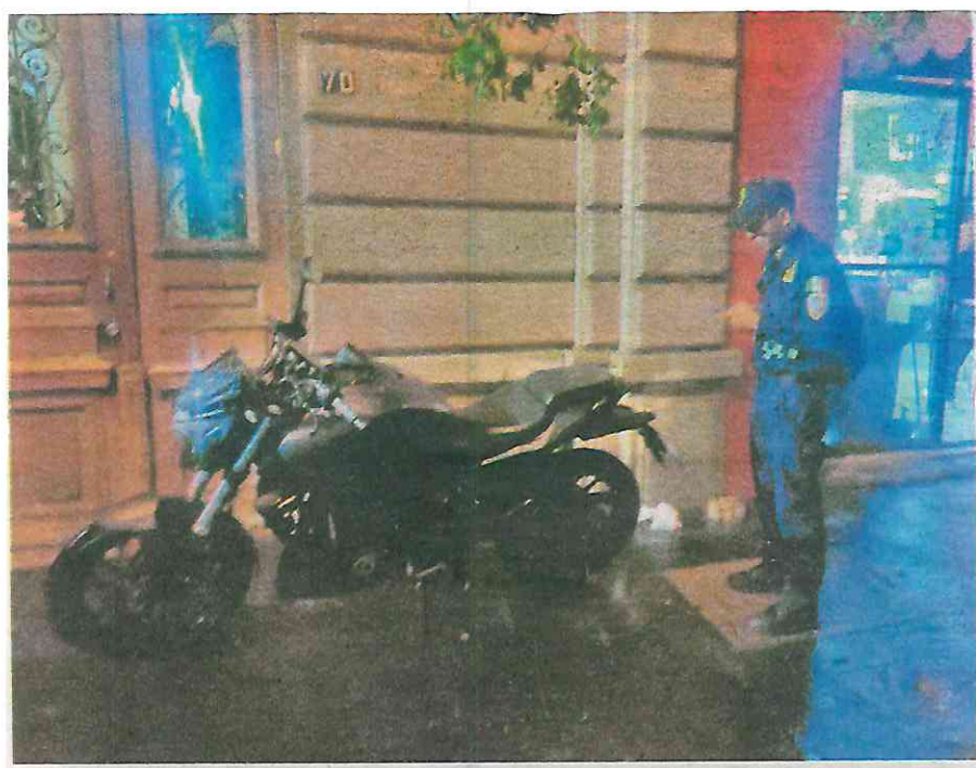
Harán valer el Reglamento de Tránsito, que en su artículo 30 indica que no se pueden estacionar vehículos motorizados sobre las vías peatonales