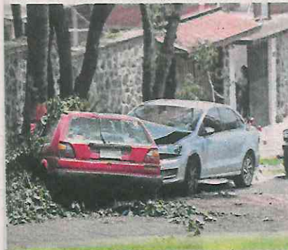
El cuerpo de la víctima quedó en medio de los dos vehículos.

Una hora más tarde del percance, personal de la Fiscalía capitalina acudió al lugar y tras tomar registro de lo ocurrido, ordenó el levantamiento del cadáver, el cual fue llevado al anfiteatro donde permanecería hasta ser reclamado por familiares.