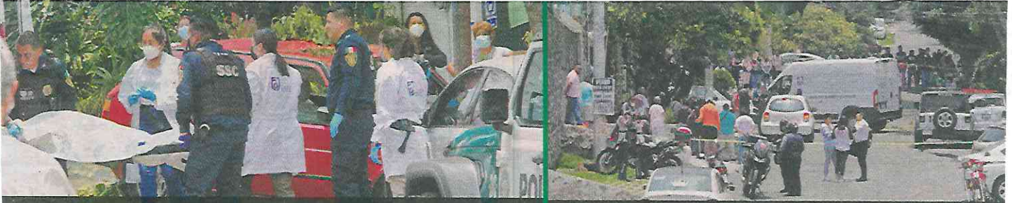
■ A las 13:00 horas, llegaron los peritos para levantar el cadáver.