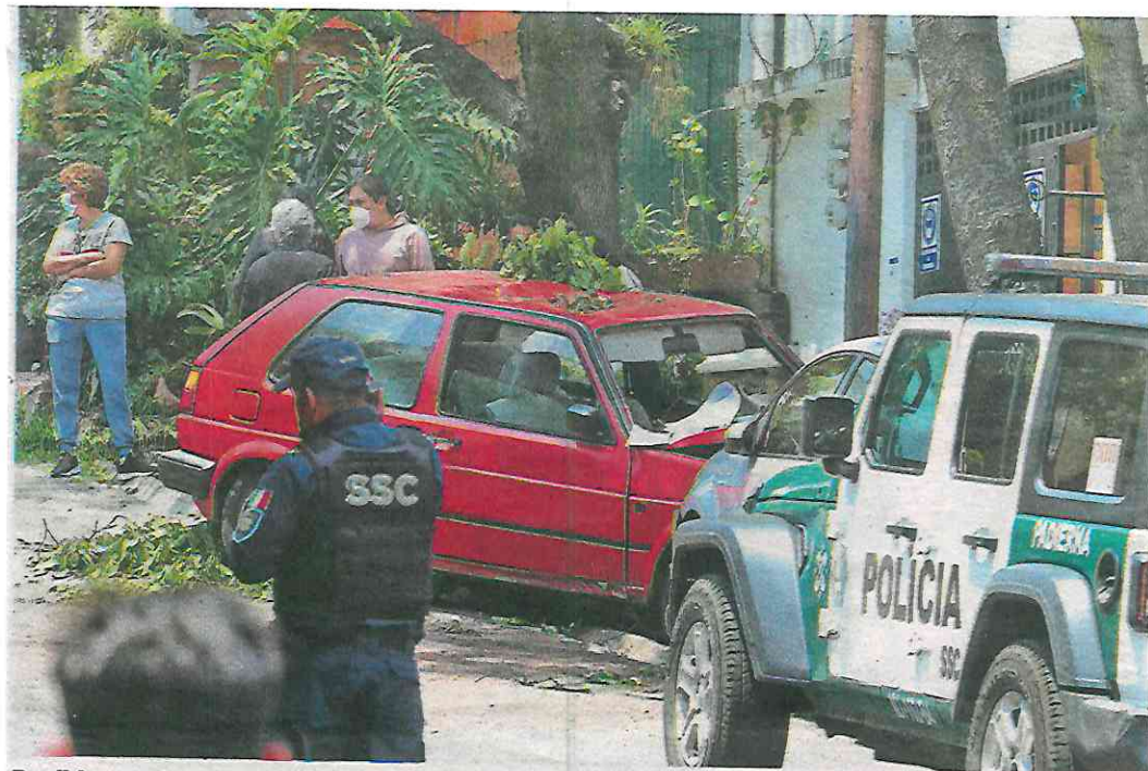
Posible avería en el carro compacto acabó con la vida de una recién casada, dijeron