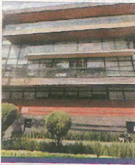
Edificio ubicado en el 1909 de avenida Coyoacán y que resultó afectado por una explosión. Tenía dictamen de habitabilidad.

A Aridjis Vázquez también se le responsabiliza de haber autorizado la habitabilidad de uno de los inmuebles afectados durante el sismo de 2017, particularmente el ubicado en la avenida Emiliano Zapata tras considerar que cumplía con todas las disposiciones legales. El edificio colapsó nueve meses después de haber sido inaugurado y por este hecho fue suspendido en 2020.