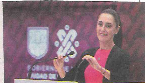
En la mira la alcaldía Benito Juárez

“Es un caso donde todavía hay más personas, funcionarios públicos involucrados en su momento, es un modus operandi, yo lo diría así, donde estas personas que eran parte de la administración pública de Benito Juárez, autorizaba manifestaciones de construcción o inclusive permitían que hubiera un piso de más,