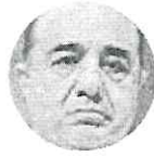
JESÚS MURILLO KARAM