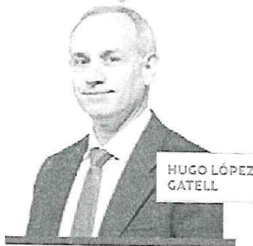
HUGO LÓPEZ GATELL

Es un hecho que el gobierno federal no tiene ni la más mínima intención de cerrar los consultorios ad-juntos a farmacias. El tema es que, de nuevo, el subsecretario de Salud, Hugo López-Gatell , se fue por la libre y arremetió contra esas unidades. Lo cierto es que desde Palacio Nacional le hicieron saber que por ahí no va el asunto, y ya cortaron de tajo lo que se perfilaba como una campaña contra esos consultorios que, dicho sea de paso, le quitan buena carga al sector salud.