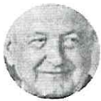
ANDRÉS M. LÓPEZ OBRADOR

Hubo dos invitados especiales al mensaje del presidente López Obrador , ayer en Palacio Nacional. Se trató del ministro presidente de la Suprema Corte, Arturo Zaldívar , y del fiscal General de la República, Alejandro Gertz . Ambos fueron ubicados en primera fila, junto a la esposa del mandatario, Beatriz Gutiérrez , y las corcholatas presidenciales.