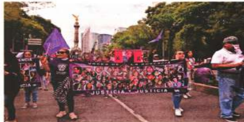
De acuerdo con la Secretaría de las Mujeres, de 2016 a 2019 se contabilizan 190 feminicidios, pese a campañas de concientización.

"Según datos de la Fiscalía General de Justicia, las carpetas de investigación por delitos sexuales se incrementaron 20% comparando los periodos del 5 de diciembre de 2017 al 30 de diciembre de 2018, y el correspondiente al 5 de diciembre de 2018 al 31 de diciembre de 2019".