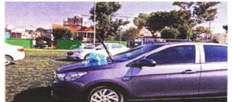
También se realizó una rifa de ocho automóviles.