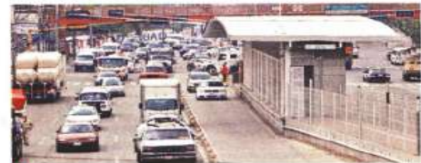
La obra, en el Estado de México, pudo terminarse en año y medio, pero ya acumula casi 5 años de retraso.