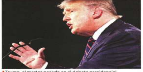
Trump, el martes pasado en el debate presidencial.

Para aprobar la consulta, que será la primera en México, los tres ministros nombrados por López Obrador, así como tres designados en el sexenio de Calderón, argumentaron apoyar la participación de los ciudadanos. Este grupo rechazó el proyecto del Ministro Luis María Aguilar, que declaraba inconstitucional la consulta por violaciones a principios constitucionales, como la autonomía de las autoridades de justicia, la presunción de inocencia, el trato igualitario, y la imposibilidad de someter a voto popular las restricciones a los derechos humanos.