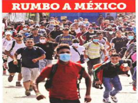
Unos 3 mil hondureños cruzaron ayer a Guatemala y se dirigen a territorio mexicano en su ruta hacia EU.

WASHINGTON.- El Presidente de Estados Unidos, Donald Trump, informó anoche que él y su esposa Melania dieron positivo a Covid-19, luego que una de sus asesoras más cercanas se contagiara. "Comenzaremos nuestro proceso de cuarentena y recuperación de inmediato. ¡Lo superaremos JUNTOS!", escribió el Mandatario en su cuenta de Twitter. El Presidente tiene 74 años, lo que lo pone en el sector de riesgo de sufrir complicaciones por el virus que hasta ahora ha matado a más de 207 mil personas en EU. Antes de dar a conocer su estado de salud, Trump informó que su consejera Hope Hicks dio positivo al virus. Con ella viajó varias veces esta semana en el helicóptero y el avión presidencial. El Presidente estuvo ayer en Nueva Jersey para un evento de recaudación de fondos, pese a que desde el miércoles por la noche Hicks comenzó a sentir síntomas leves. El segundo debate presidencial entre Trump y Joe Biden está previsto para el 15 de octubre en Miami.