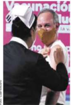
Hugo López-Gatell cerró los ojitos y que lo vacunan. Campaña contra la influenza.