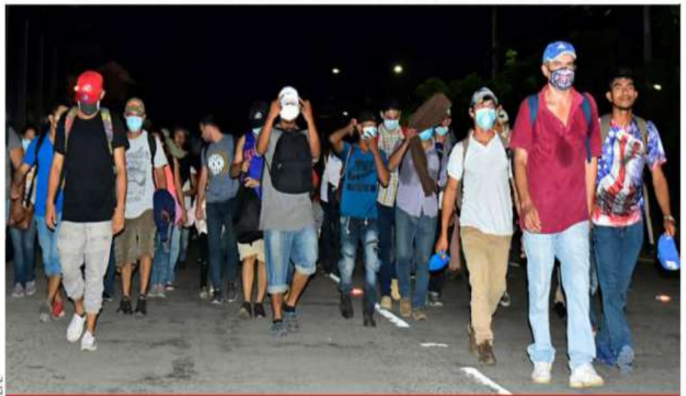
Desafiando a la pandemia, al menos tres mil hondureños cruzaron este jueves la frontera de Guatemala rumbo a México, como parte de una nueva caravana de migrantes que intenta llegar a Estados Unidos en busca de mejores condiciones de vida. 18