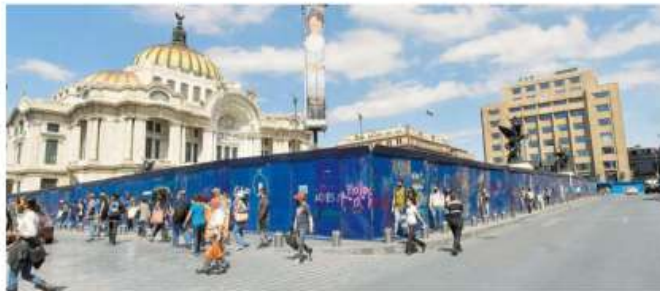
En marcha acciones preventivas, como el resguardo de edificios, desde el Eje Central hasta el Zócalo capitalino

La mandataria informó que los organizadores le pidieron que no hubiera presencia de elementos de la Secretaría de Seguridad Ciudadana, sin embargo, ella dijo que ya analizan cómo ver que haya uniformados en caso de que se presente alguna situación que amerita resguardo o atención de la policía.