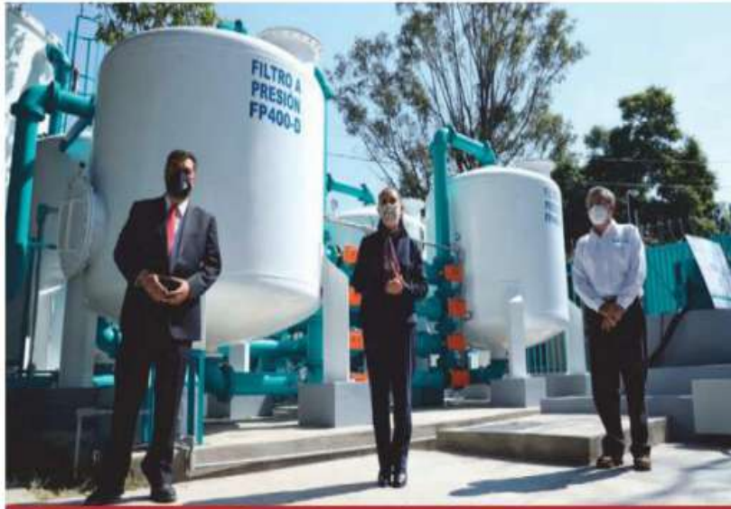
Claudia Sheinbaum, durante la inauguración de dos plantas potabilizadoras en la alcaldía Azcapotzalco.

"El pozo inaugurado cuenta con una capacidad de entre 50 y 60 li-