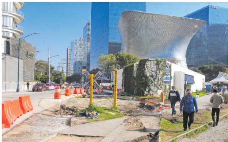
Aún siguen en diálogo con los vecinos para evaluar el impacto / FOTOS ADRIÁN VÁZQUEZ

“Nosotros lo que habíamos solicitado desde noviembre es que no hubiera un carril adicional. Estamos apelando a su sentido común para que no induzcan más tráfico. Pasó el tiempo, se detuvo por la pandemia y reactivan ahora y reactivan peor: con dos carriles en contraflujo y tres de flujo normal. Hoy volvemos a nuestra propuesta de noviembre, no queremos tráfico inducido”, dice el vecino de la colonia Granada.