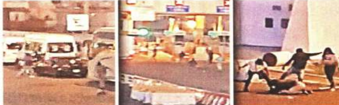
En medio de detonaciones de arma de fuego, los grupos se disputaron el control de la caseta.