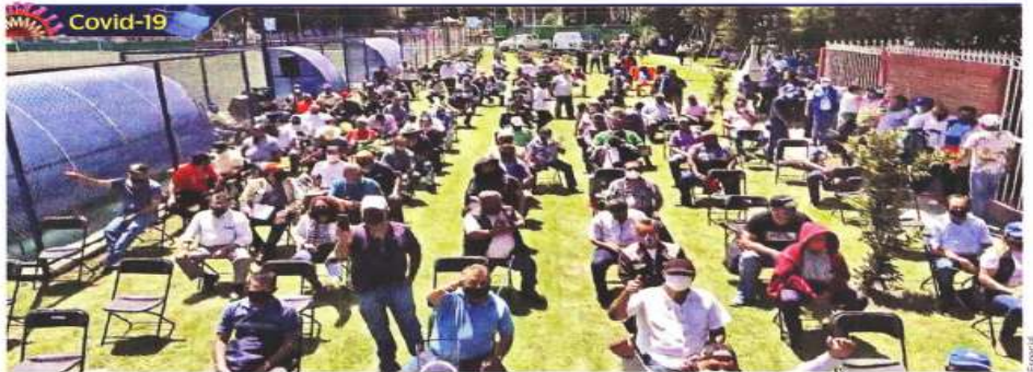
Pese a estar prohibidas las reuniones de más de 25 personas, el Sindicato hizo una celebración con 200 asistentes.

Agregó que actualmente ofrecen dos rutas provisionales y que la empresa concesionaria da capacitaciones periódicas a los conductores.