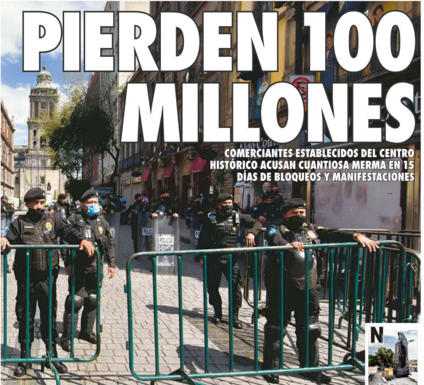
Desde el 13 de septiembre empezaron los retenes policiacos en el Centro.

COMERCIANTES ESTABLECIDOS DEL CENTRO HISTÓRICO ACUSAN CUANTIOSA MERMA EN 15 DÍAS DE BLOQUEOS Y MANIFESTACIONES