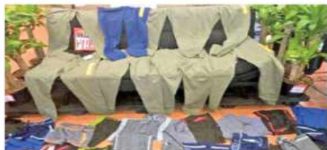
Parte de la ropa que llevaba escondida la mujer de 22 años debajo de tres fajas. Todo lo ocultaba utilizando ropa holgada.

Los hechos ocurrieron en el Walmart ubicado en José