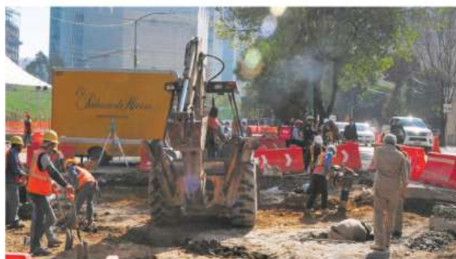
Gráfico Luis Calderón

Las máquinas ya trabajan sobre el parque lineal