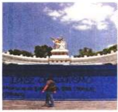
Se instalaron cercas para resguardar monumentos.

El presidente del PAN local, Andrés Aya de Rubiolo, hizo un llamado a Sheinbaum Pardo para garantizar la paz, la seguridad y el orden durante los actos conmemorativos del 2 de octubre, sobre todo por las movilizaciones convocadas por organizaciones distintas al Comité del 68. ●