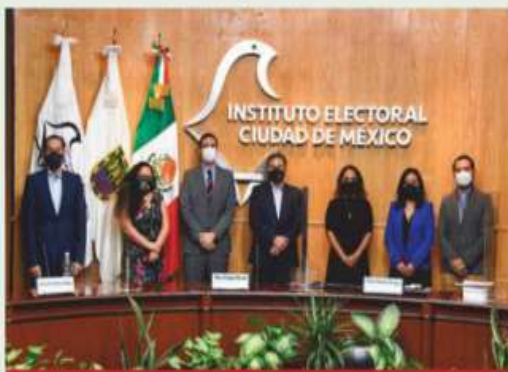
Los nuevos consejeros ocuparán el cargo por siete años.