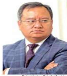
Eduardo Santillán señaló como discriminatorio el requisito de ser mexicano de nacimiento.

También propuso que el puesto dure 4 años y no 7 como está establecido en la Ley Orgánica del Congreso ya que en la Ley Orgánica de la Fiscalía se establece una duración de 4 años.