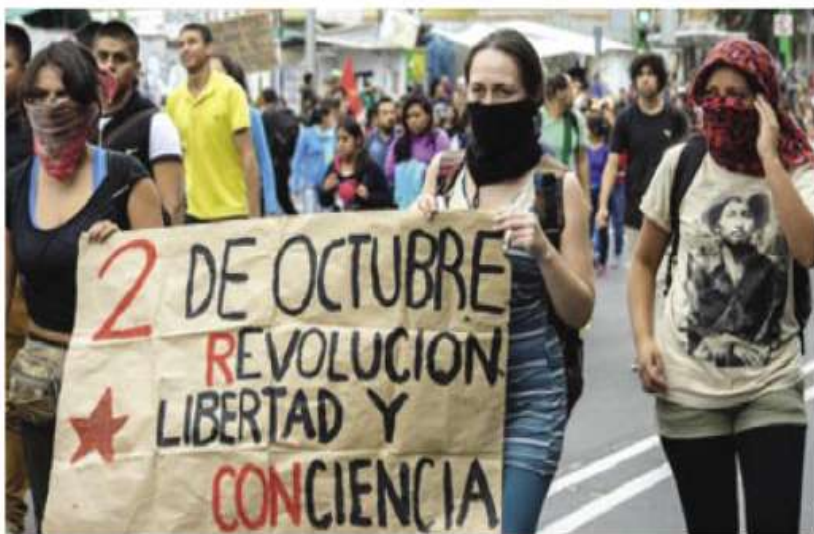
Ya son 52 años de aquel 2 de octubre.