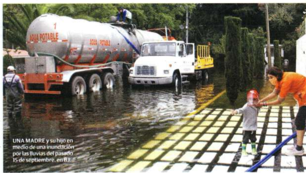
UNA MADRE y su hijo en medio de una inundación por las lluvias del pasado 15 de septiembre, en B.J.

CIUDADANOS CARECEN de un puente que los enlace con las autoridades; debido a irregularidades impugnaron comicios de marzo y, ahora, la contingencia los tiene en vilo