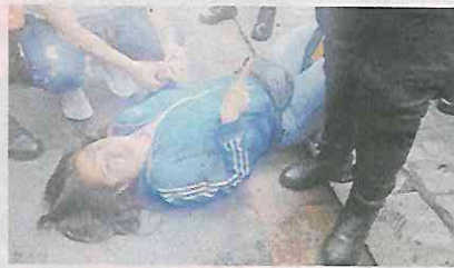
La joven fue reportada estable.

Al ver lo ocurrido, los comerciantes de la zona enfurecieron y rodearon la unidad de Metrobús, evitando que continuara con su camino rumbo a San Lázaro, mientras que otros más intentaban abrir la puerta del vehículo y así bajar al conductor para golpearlo.