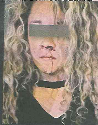
ROSTRO CUBIERTO POR LA AUTORIDAD

La detenida fue trasladada al Ministerio Público, donde se definirá su situación jurídica.