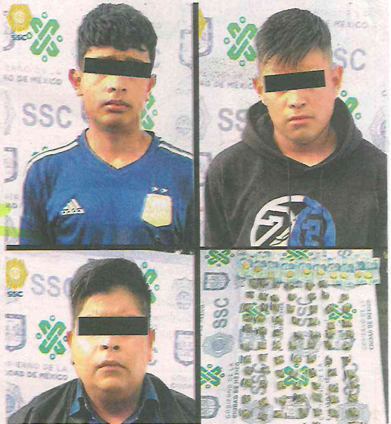
Tras una revisión preventiva, les aseguraron 161 bolsitas de plástico que contenían un vegetal verde y seco similar a la marihuana

Ante la posible comisión de un delito, los oficiales, conforme al protocolo de actuación policial, se acercaron y les solicitaron una revisión preventiva, tras la cual aseguraron 161 bolsitas de plástico que contenían un vegetal verde y seco similar a la