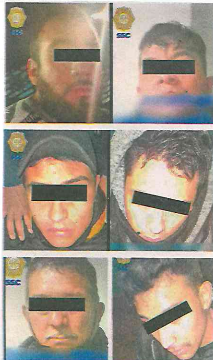
Hubo cerco virtual para localizar a los supuestos responsables de robar un cajero automático

Cabe mencionar que durante la acción se aseguró una subametralladora y una réplica de arma de fuego.