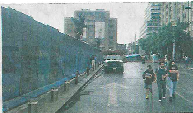
El Palacio de Bellas Artes y otros edificios del Centro Histórico fueron tapiados en previsión de la marcha de hoy.

Esa "táctica de lucha", en el caso de las marchas por el 2 de octubre, encuentra blanco en sucursales bancarias, hoteles, restaurantes, pero también en oficinas públicas o monumentos