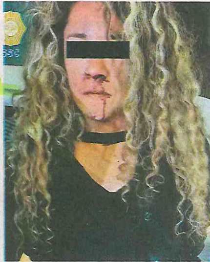
Mujer detenida en la alcaldía de Miguel Hidalgo

La detenida fue informada de sus derechos de ley, y puesta a disposición ante el agente del Ministerio Público correspondiente, quien determinará su situación legal.