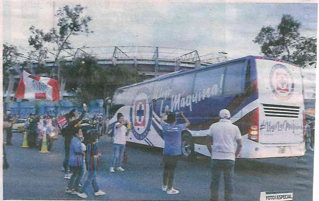
PREPARADOS. La afición del Cruz Azul se hizo presente para recibir a sus jugadores previo al juego ante las Chivas.

Los otros aficionados se mantuvieron alejados, obser-