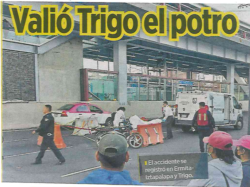
El accidente se registró en Ermita-Iztapalapa y Trigo.