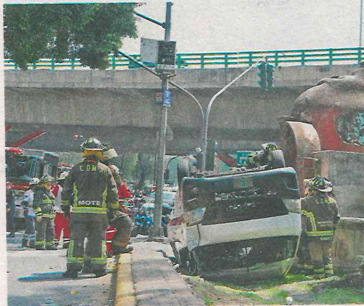
Bomberos y rescatistas ayudaron a los heridos

Integrantes del cuerpo de Protección Civil y del Heroico Cuerpo de Bomberos de la capital, así como paramédicos de la Cruz Roja y del Escuadrón de Rescate y Urgencias Médicas (ERUM) llegaron a la brevedad para auxiliar a los accidentados.