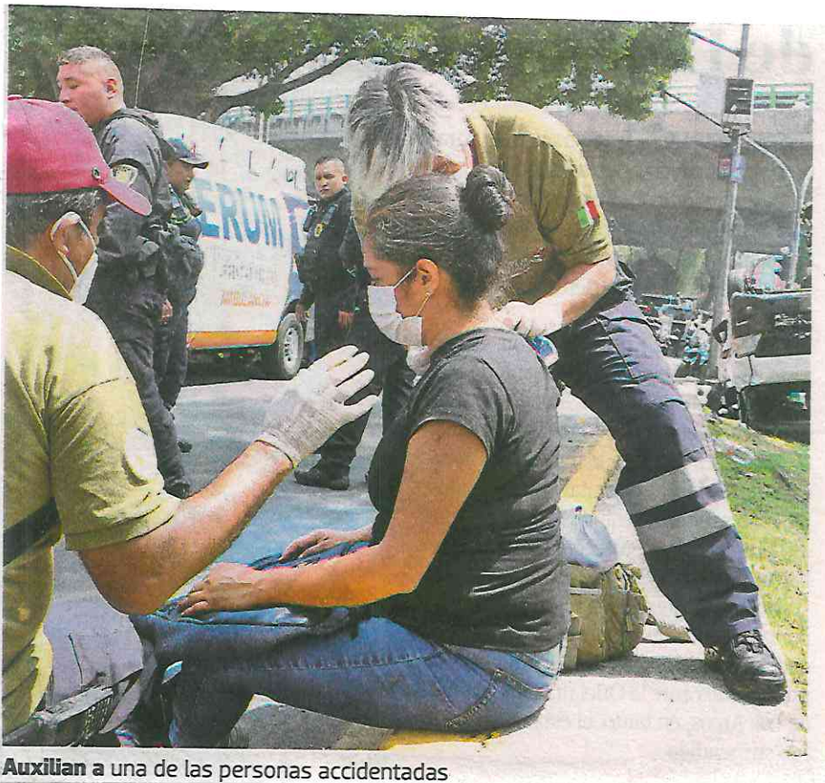
Auxilian a una de las personas accidentadas

Entre vidrios rotos y asientos fuera de su lugar, se encontraban mujeres y hombres, algunos de ellos de la tercera edad, con heridas sangrantes en el rostro y fuertes golpes; varios no podían ni moverse