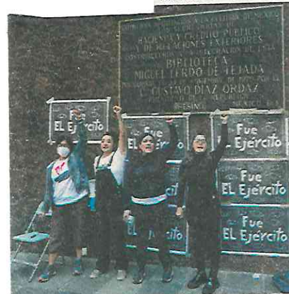
Sin policías, pidieron organizadores