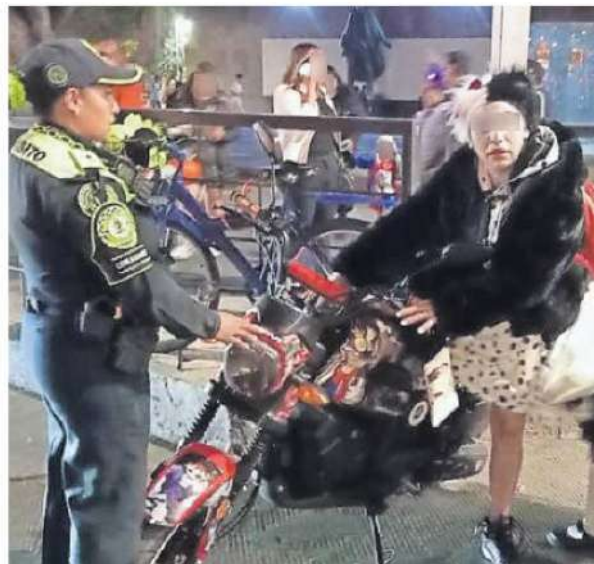
La SSC realizó operativos para evitar accidentes en las rodadas del terror y supervisó que se cumpliera el Reglamento de Tránsito.

Con ello se busca generar conciencia vial, evitar accidentes y salvar vidas, además de dar respuesta a denuncias ciudadanas que reportan a conductores de motocicletas, sin el equipo de protección adecuado, más pasajeros de lo permitido o sin la documentación que acredite la propiedad. ●