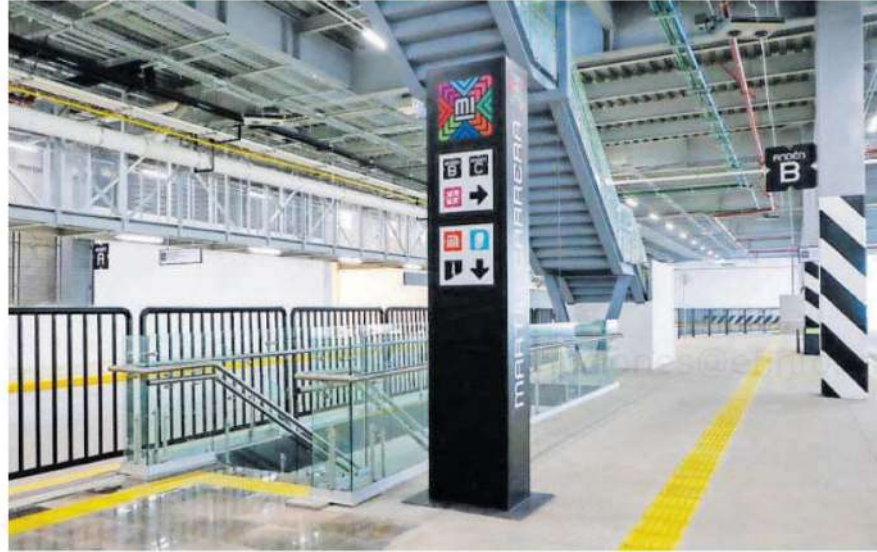
Tras muchos años de espera inauguran el Cetram de Martín Carrera /GCDMX

Habrá una segunda etapa para 2024, en donde se habilitarán espacios comerciales y un edificio de vivienda en la parte de arriba del Cetram