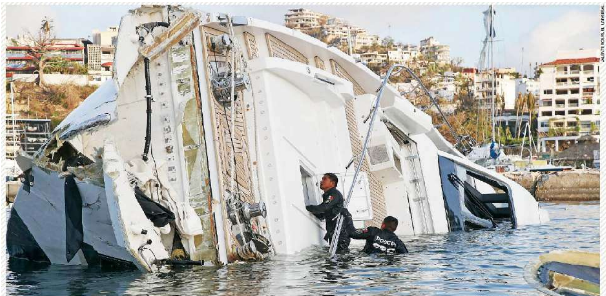
Elementos del grupo Zorros, de la Policía de la Ciudad de México, trabajaban ayer en la búsqueda de personas desaparecidas en la costa