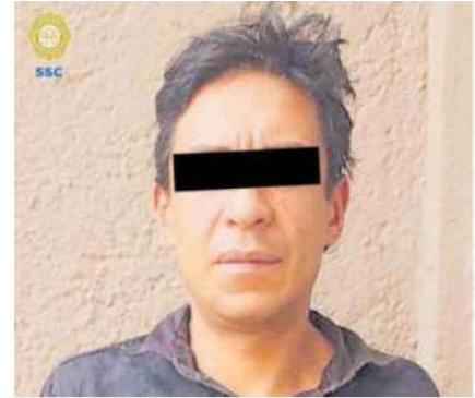
Fueron detenidos por policías de la SSC de la Cdmx en calles de la alcaldía Miguel Hidalgo