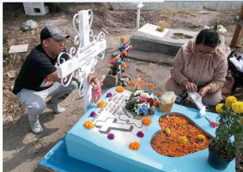
UN MATRIMONIO limpia y adorna la tumba de su pequeña en este camposanto.