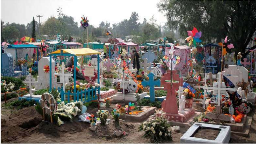
EN EL PANTEÓN de San Lorenzo Tezonco fueron dejados rehilletes, globos y algunos juguetes, ayer.