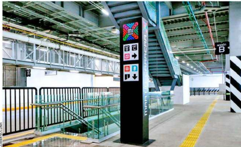
HUELE A NUEVO. Remodelación de taquillas, mejoramiento de torniquetes, colocación de señalética, instalación de sanitarios y un vestíbulo de conexión, son algunas de las mejoras.

Vicepresidenta de Infraestructura y Finanzas de Grupo INDI