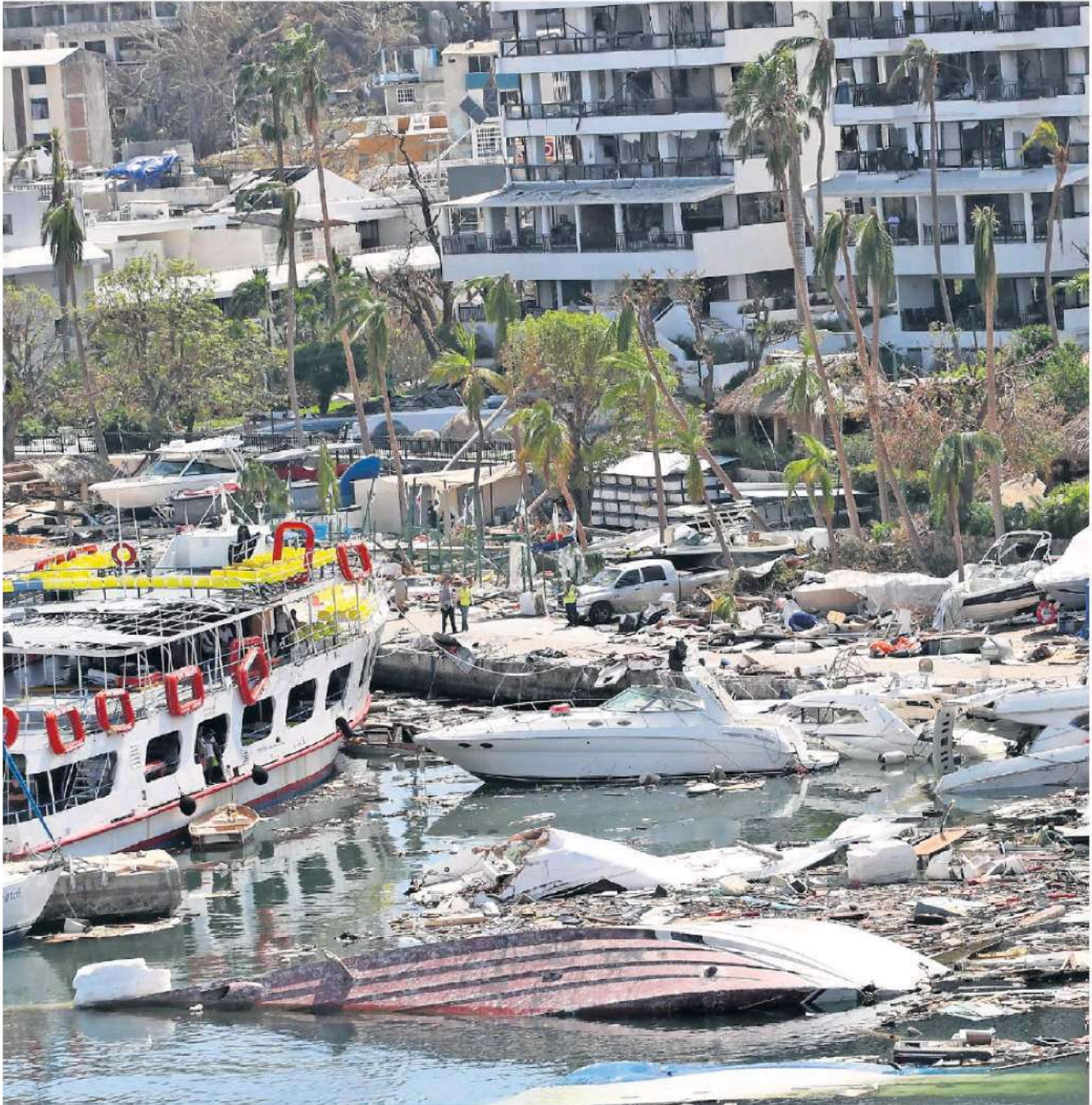
Desde su llegada, un día después del impacto del huracán, los Zorros localizaron víctimas a bordo de yates y en las orillas de la costa.