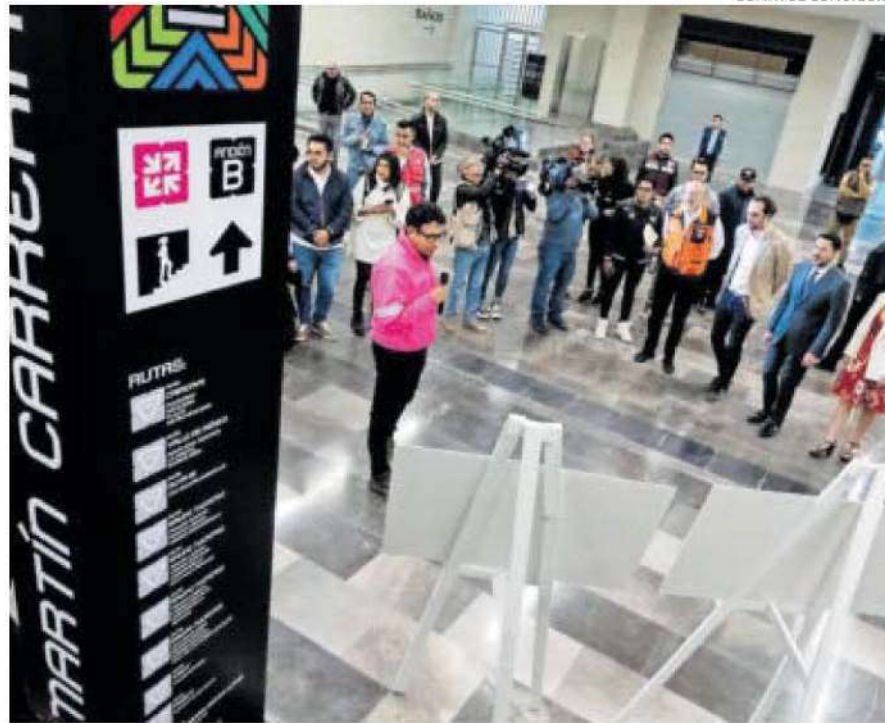
Tiene mil 350 metros de guía táctil y 9 mapas para personas con discapacidad.