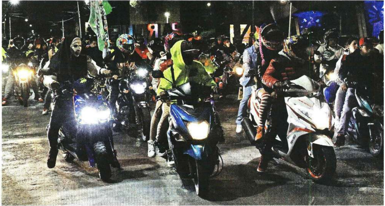
La Colonia Morelos fue uno de los puntos de encuentro para la Rodada del Terror, cuyas jornadas arrancaron desde el domingo.