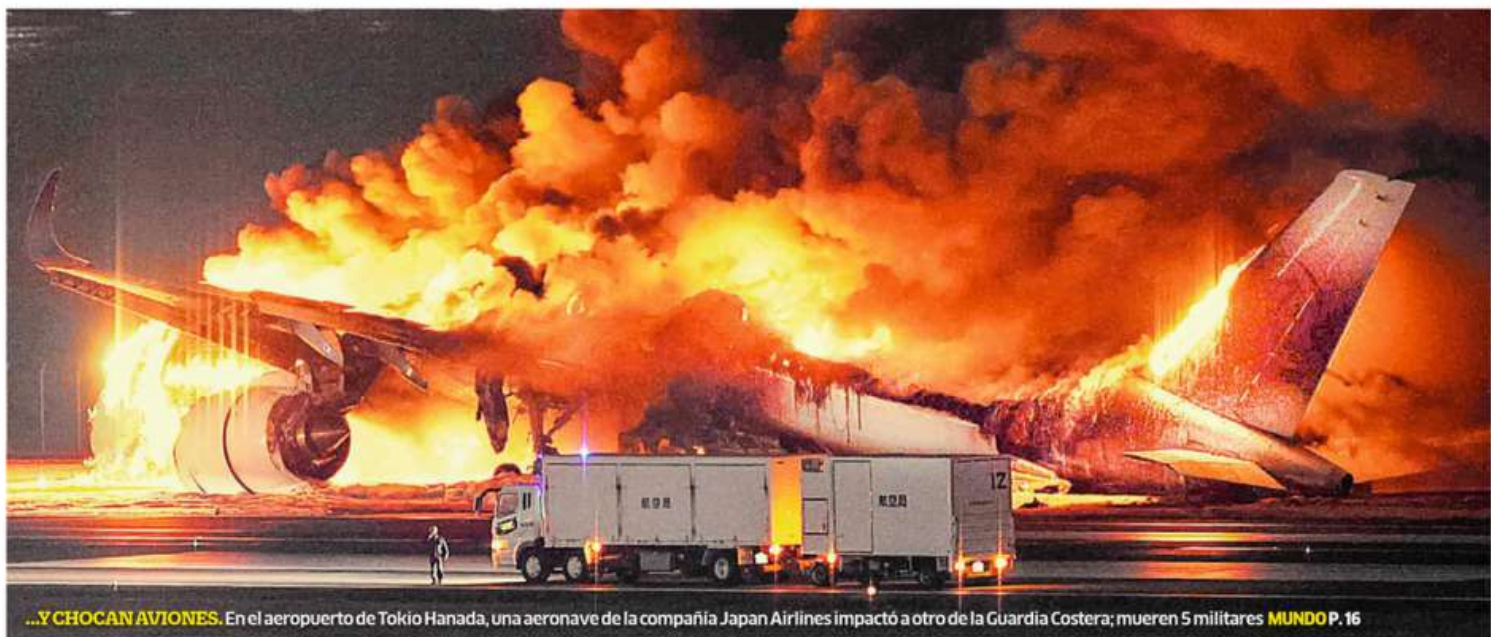
...Y CHOCAN AVIONES. En el aeropuerto de Tokio Hanada, una aeronave de la compañía Japan Airlines impactó a otro de la Guardia Costera; mueren 5 militares MUNDO P. 16