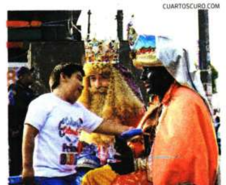
Desde las 14:00 horas capitalinos podrán tomarse fotos con los Reyes Magos.