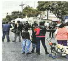
Una menor resultó lesionada y debió ser trasladada al hospital.

"Fue de lo más horrible. Sólo me eché a correr para allá atrás pero tuve que regresar por mi puesto. Ese, el que quedó entre los puestos (Jalomo), les dio con todo (a