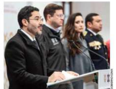
ATENCIÓN. El mandatario local anunció que el Metrobús, Trolebús, RTP y Tren Ligero ampliarán su horario de servicio.

Por su parte, el titular de la Secretaría de Seguridad Ciudadana (SSC), Pablo Vázquez, anunció que con motivo del Día de Reyes, la SSC implementará un operativo de vigilancia y vialidad, por ello se desplegarán 6 mil 761 uniformados, quienes estarán apoyados en 409 vehículos oficiales, 17 motos y 16 ambulancias.