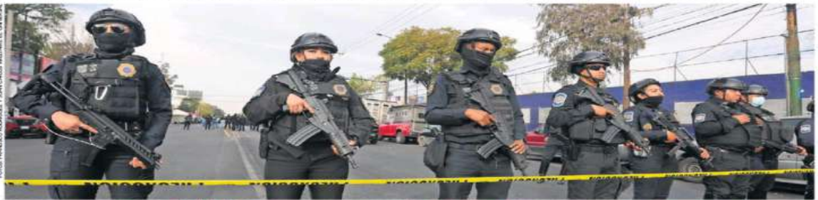
IMAGEN DEL DÍA MUEREN DOS EN BALACERA EN IZTACALCO

"Como no podemos cancelar la vida política que tienen los propios partidos y en general el interés ciudadano, si acaso yo quería pensar que estarían en la posibilidad de tener reuniones con su propio partido político y seguir organizándose rumbo a la campaña, pero hay que dejar claro que ellos no pueden hacer actos proselitistas en este momento, es una etapa que es para otras cuestiones y tendrán que esperar hasta el 1 de marzo". Durante la intercampaña, el Go-