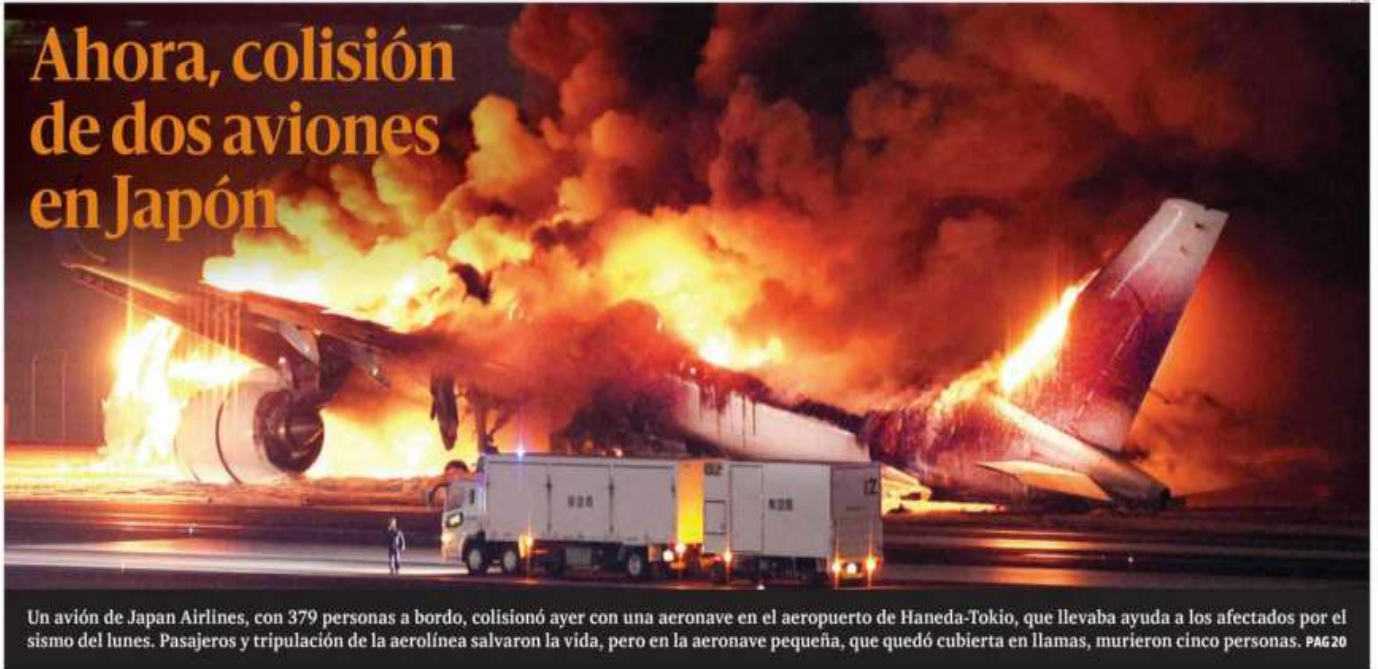
Un avión de Japan Airlines, con 379 personas a bordo, colisionó ayer con una aeronave en el aeropuerto de Haneda-Tokio, que llevaba ayuda a los afectados por el sismo del lunes. Pasajeros y tripulación de la aerolínea salvaron la vida, pero en la aeronave pequeña, que quedó cubierta en llamas, murieron cinco personas. PAG 20