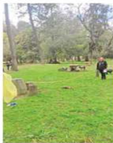
La zona fue acordonada por elementos de la SSC-CDMX.

Al lugar llegaron policías de la Brigada de Vigilancia Animal, quienes acordaron la zona y dieron parte a la Fiscalía General de Justicia de la Ciudad de México, cuyos elementos recolectaron evidencias y trasladaron los restos del animal al Centro de Control Cántino y Felino Dr. Alfonso Angelino, ubicado en la colonia Culhuacán, alcaldía