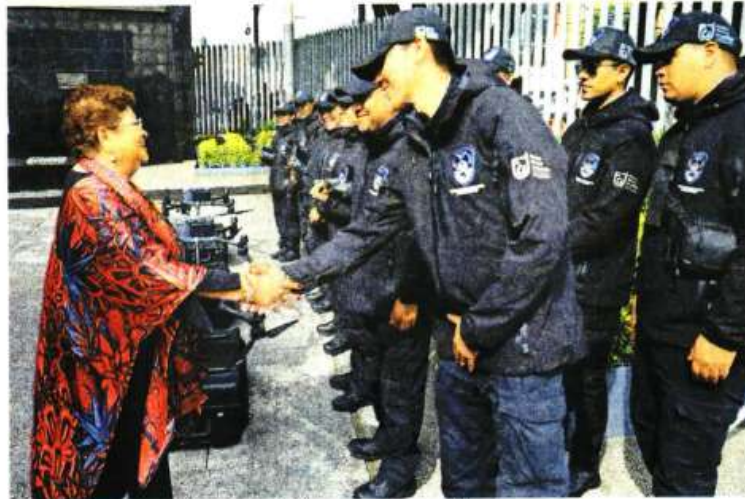
La aún fiscal Ernestina Godoy, está a la espera de ser ratificada.

"Con fundamento en los artículos 38, 48 y 51 fracción I de la Ley Orgánica del Congreso de la Ciudad de México, me permito convocarles a la Cuarta Sesión Extraordinaria del Tercer Año de Ejercicio de la Junta de Coordinación Política, que se llevará a cabo de forma remota a través de la plataforma Zoom, el día miércoles 03 de enero del año en curso a las 13:00 horas. El orden del día y las documentales de los asuntos que se analizarán en la sesión, serán emitidos con oportunidad a su correo institucional. Sin otro particular les envío