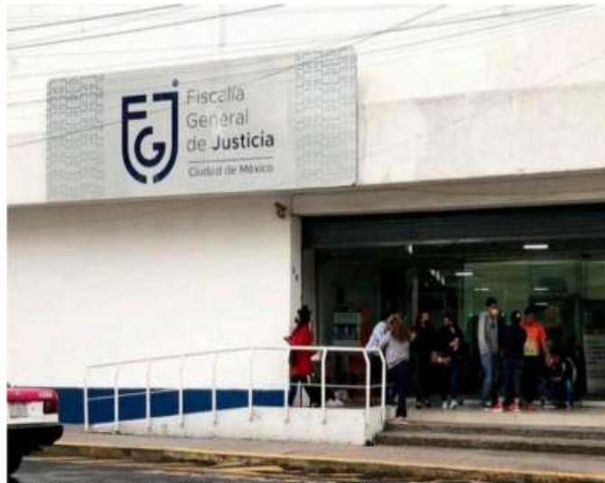
La víctima es asesora jurídica de víctimas en la FGJCDMX.

“Inicié una carpeta de investigación en contra de Neri el veinticuatro de septiembre y acudí a hacerme la impresión diagnóstica al Centro de Terapia de Apoyo a Víctimas de Delitos Sexuales para comprobar que sí fui agredida, el resultado salió que sí tengo afectación por delito sexual; la exp-