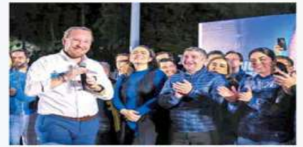
Santiago Taboada, precandidato a la jefatura de Gobierno de la coalición Va por la Ciudad de México.

Insistió en que, de ser así, se mantendrán los apoyos a adultos mayores, se incentivarán las mejoras en materia edu-