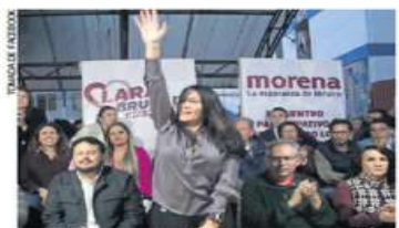
Solamente Dunia Ludlow ha renunciado en el gobierno local para sumarse a la campaña de Clara Brugada.