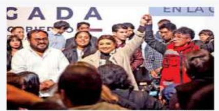
Clara Brugada, precandidata a la jefatura de Gobierno por la coalición Sigamos Haciendo Historia en la Ciudad.

"El mejor ejemplo de la capacidad y voluntad que tienen las, los y les jóvenes,