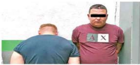
Los diez detenidos serían del grupo delictivo Los Conchos, entre los que se encuentra un policía de la ciudad (izq.).