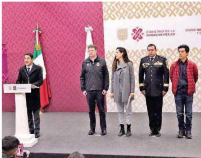
El mandatario agradeció la participación de la SSC en diciembre, dijo que han sido días complejos pero con su participación han mantenido saldo blanco

"Con lo anterior, se dará seguridad a los capitalinos mediante la aplicación de los programas de Transporte Seguro, módulos