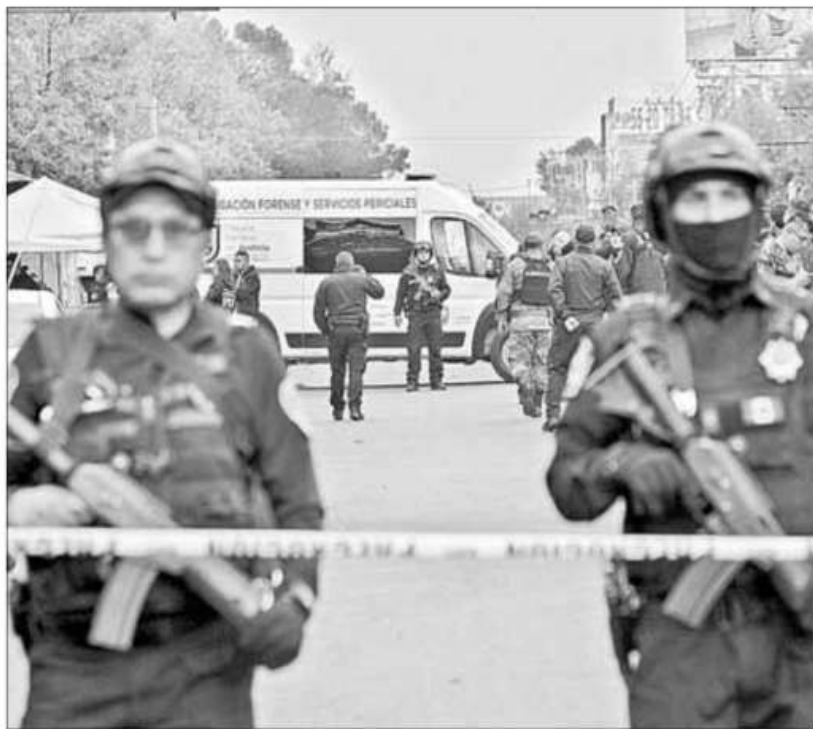
◀ Tras el enfrentamiento a balazos entre policías de la SSC y un grupo de presuntos extorsionadores en un tianguis ubicado en la colonia Agrícola Oriental, alcaldía Iztacalco, se montó un cerco de seguridad para resguardar la zona.

Personal de Servicios Periciales realizó el levantamiento de los cadáveres y la Fiscalía General de Justicia inició la carpeta de investigación por diversos delitos.