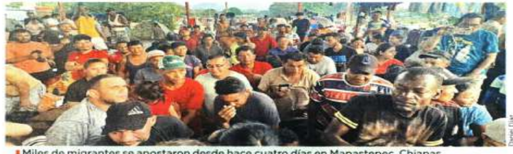
Miles de migrantes se apostaron desde hace cuatro días en Mapastepec, Chiapas, a la espera de permisos para transitar por el País.

Tampoco se han dado datos de los cinco viajeros que no se llevaron los criminales. Después de no abordar el tema durante su mañana en Tabasco, tanto el Presidente Andrés Manuel López Obrador como la titular de Gobernación, Luisa María Alcalde, indicaron ayer que sólo había un operativo y la investigación