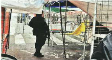
Las detonaciones provocaron pánico entre los visitantes y comerciantes de la romería en la Colonia Agrícola Oriental.

Ahí comenzó el intercambio de balazos. Los clientes y comerciantes comenzaron a correr.