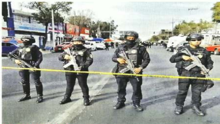
DETONAN BALACERA. El enfrentamiento ocurrió luego de que presuntos extorsionadores detectaron que eran seguidos por policías vestidos de civil.

Es falso que debas esperar 72 horas para reportar a una persona como ausente ante las autoridades.