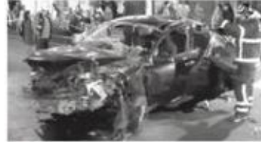
Quedó convertido en chatarra

INDAGAN Autoridades investigan si el conductor manejaba bajo los influjos del alcohol o de algún estu-