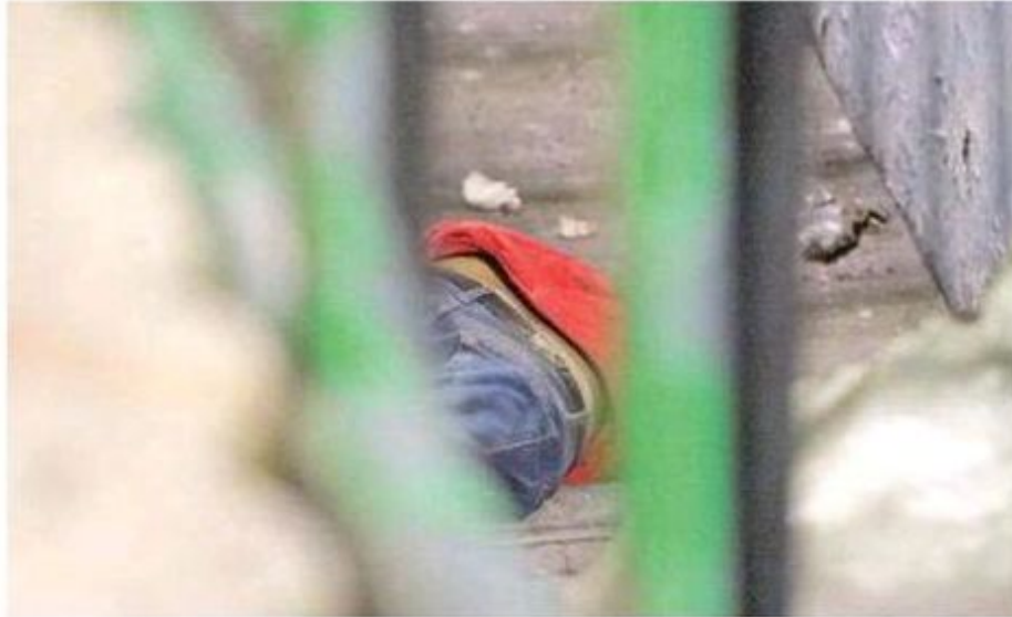
Quedó el cadáver del hombre en el paso subterráneo de Tlalpan, tuvo que ser rescatado por los bomberos