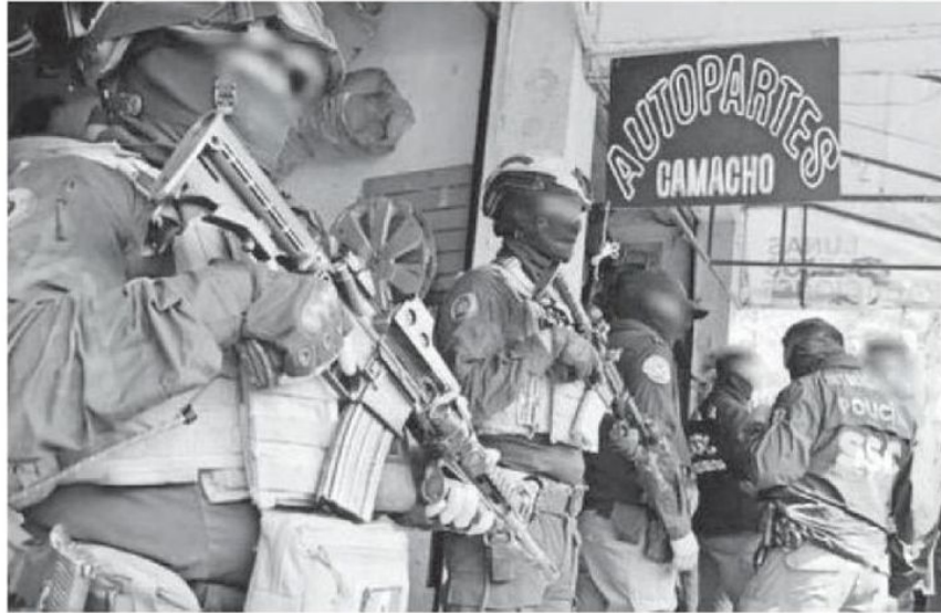
Operativo de la SSC y de la Fiscalía de la CDMx para asegurar autopartes