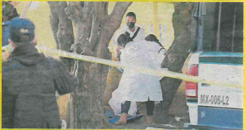
Peritos levantaron a la mujer, de quien no se proporcionó el nombre.

Era un bulto, envuelto en bolsas de plástico y en el que yacía el cadáver de una mujer de unos 25 años. Ella tenía la cabeza cubierta con una bolsa y los brazos atados.