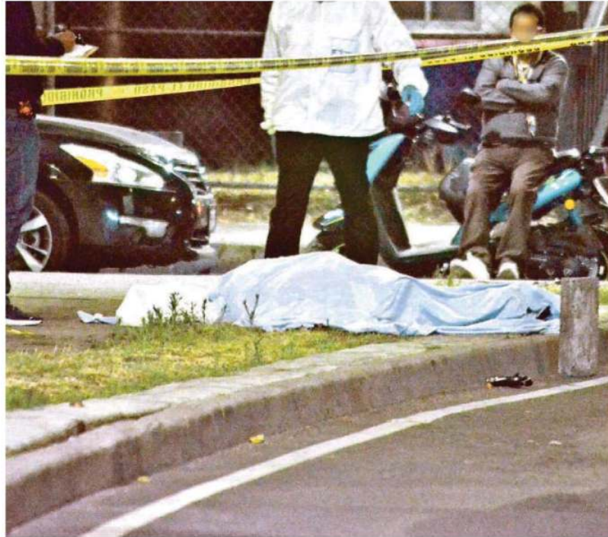
Un motociclista murió tras ser golpeado por un auto / JOSÉ MELTON