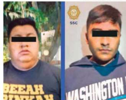
Estos dos sujetos fueron detenidos en posesión de dosis de aparente droga