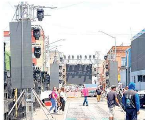
Sonideros insalubres toman las calles