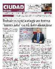
EL ALCALDE de Cuajimalpa, Adrián Rubalcava, durante la entre- vista concedida a este medio.