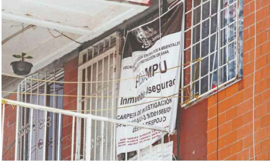
En 2022 arrebató a los delincuentes 66 departamentos en Fuerte de Loreto