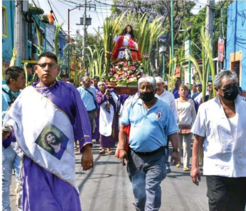
ADULTOS, jóvenes y niños participaron en el recorrido que marcó el inicio de la conmemoración de la Semana Santa en Iztapalapa, ayer.