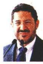
Martí Batres Guadarrama

:::: El sábado, nos comentan, el secretario de Gobierno, Martí Batres , presentó su libro Morena y su Identidad Política en la alcaldía Magdalena Contreras. Nos detallan que estuvo acompañado de algunas de las corcholatas