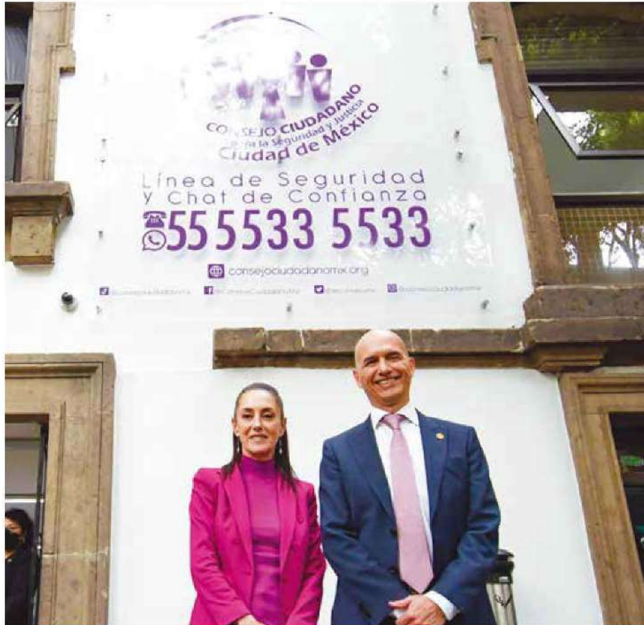
POR CARLOS NAVARRO