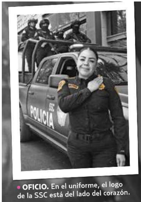
● OFICIO. En el uniforme, el logo de la SSC está del lado del corazón.

(Las mujeres) tenemos el impulso y el apoyo de nuestros mandos de hoy en día".