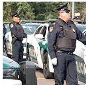
Lista la vigilancia

Agregó que desde el viernes 31 de marzo y hasta el domingo 9 de abril, se intensificará el Programa Conduce Sin Alcohol.