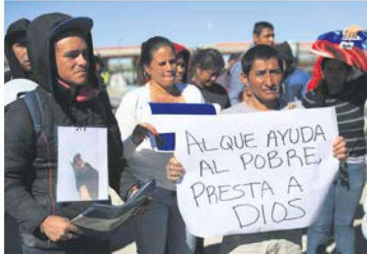
Reclamo. Como protesta, migrantes escenificaron un viacrucis, ayer, en Ciudad Juárez.