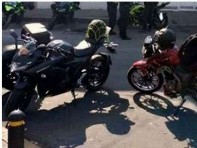
Se busca concientizar a motociclistas que circulan en la zona.

La SSC continuará con estos programas de revisión de manera aleatoria con el propósito de evitar conductas de riesgo y seguir fortaleciendo la seguridad vial de todas las personas usuarias de la vía, en especial de motociclistas ● (Redacción)