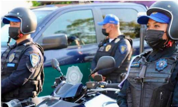
Estarán disponibles 6 ambulancias, una unidad con equipo especial de rescate y 3 motocicletas.