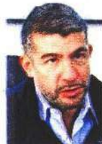
Mauricio Tabe Echartea

:::: Nos cuentan que para estas vacaciones de Semana Santa en la alcaldía Miguel Hidalgo están preparando un plan de seguridad junto con los vecinos que deciden quedarse en la Ciudad de México. Nos adelantamos que el alcalde Mauricio Tabe (PAN) lanzará la campaña "Si ves algo, di algo", que busca que, si un vecino ve algo o a alguien sospechoso en su calle, cerca de una casa o de un auto, llame de inmediato a la estrategia