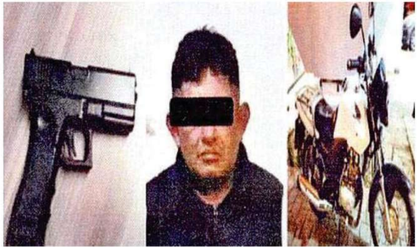
Un sujeto quedó bajo arresto, luego de ser sorprendido forcejeando con una persona, quien aseguró que momentos previos el sujeto intentó despojarlo de una motocicleta

Ante su posible participación en el delito de robo de vehículo con violencia, el detenido fue trasladado junto a la parte acusadora a la Coordinación Territorial Miguel Hidalgo 5, donde quedó bajo arresto tras la apertura de la carpeta de investigación CI-FIMH/MH-5/UI-2 C/D/00228/03-2024.