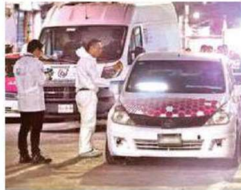
Autoridades investigan si se trata de un ajuste de cuentas o quisieron asaltar al hombre

La mamá de "Pato" llegó al lugar y sólo lamentaba la pérdida de su hijo diciendo "mi hijo no, mi niño no" mientras que su hermano con groserías lamentaba la muerte.