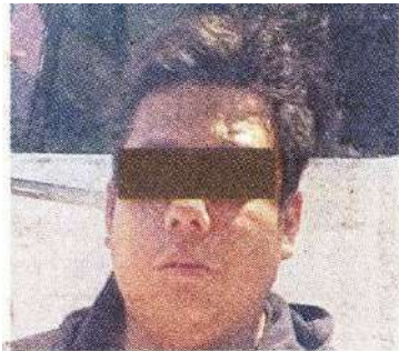
El chofer fue detenido en la Colonia Santa Ana Poniente.

Los elementos realizaron un dispositivo de búsqueda y localización de la unidad y lo consiguieron en la Avenida Tláhuac y calle Santa Cruz, de la Colonia Santa Ana Poniente.