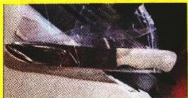
Los indicios que portaba el agresor fueron llevados al Ministerio Público.