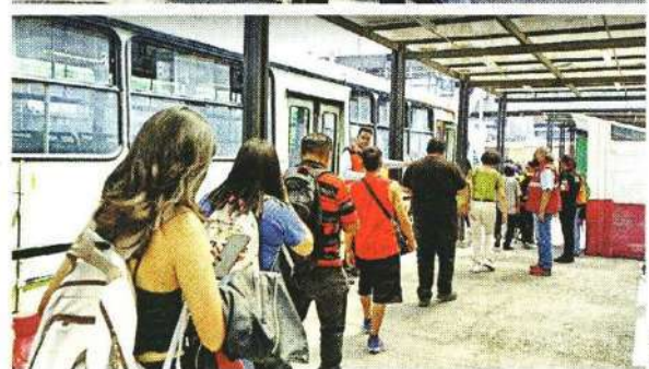
■ Ante la urgencia de llegar, los usuarios del Metro aceptaron abordar patrullas o tratar de subir unidades de la RTP.