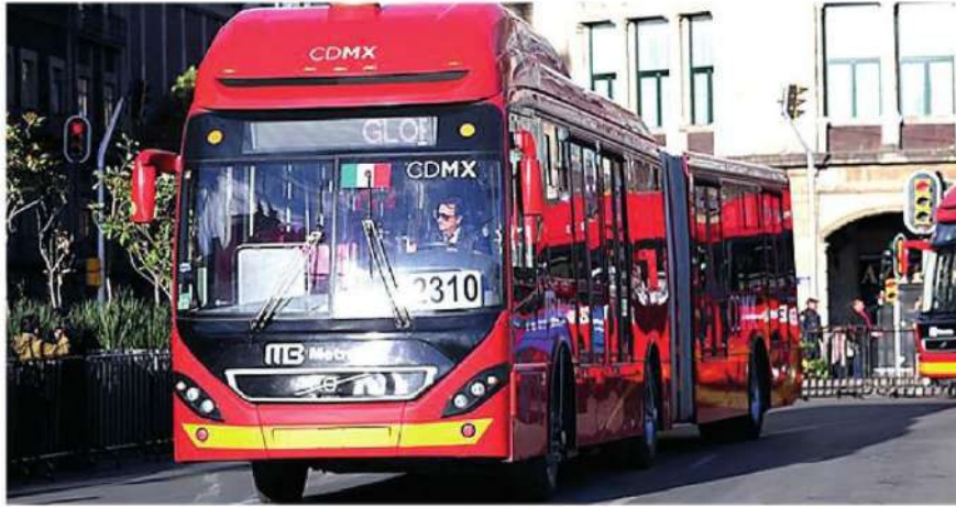
- Febrero y noviembre, son los meses que registraron el mayor número de bloqueos