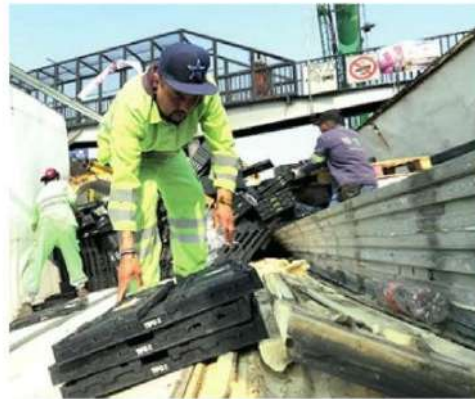
Los servicios de auxilio descargaron el tráiler

Las labores de remoción se prolongarán de 8 a 10 horas