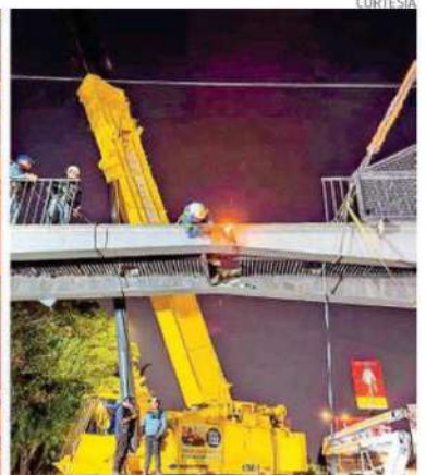
Los trabajadores llevaron a cabo diversas maniobras para realizar el retiro de una estructura del Metro, conocida como rampa antisúidicios