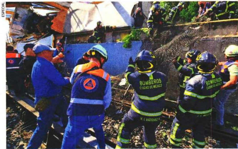
Durante la mañana y tarde del martes se realizaron trabajos para retirar el tráiler y el puente dañado.

"Se calcula que hoy [martes] por la noche se estará terminando, pero realmente ya estará todo restaurado en la madrugada o mañana [miércoles]"