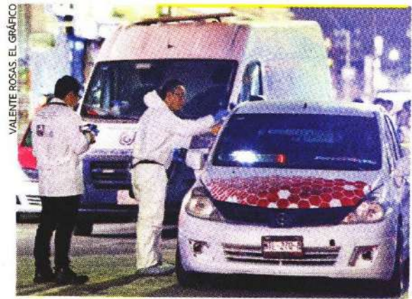
Vecinos aseguran que a unos metros hay un "punto rojo".