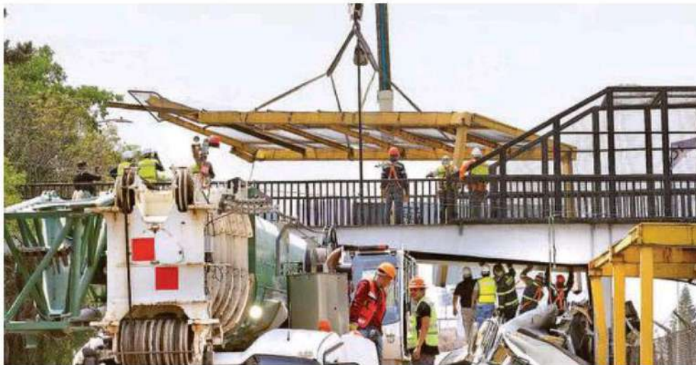
Por varias horas la circulación de Poniente a Oriente se vio afectada a causa de los cierres viales por parte de uniformados de tránsito