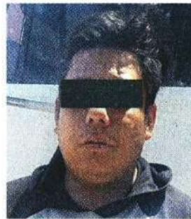
ROSTRO CUBIERTO POR LA AUTORIDAD

“El hombre, de 27 años de edad, fue detenido, informado de sus derechos de ley, para posteriormente ponerlo a disposición, junto con el camión, ante el agente del MP”.