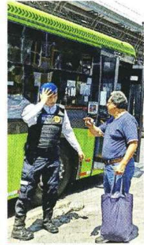
■ Usuarios padecieron ante el cierre de las estaciones de la L-5.

/// Tal vez voy tarde a la chamba, pero podré decirles a mis compañeros que llegue en una patrulla, algo que nunca me había pasado".