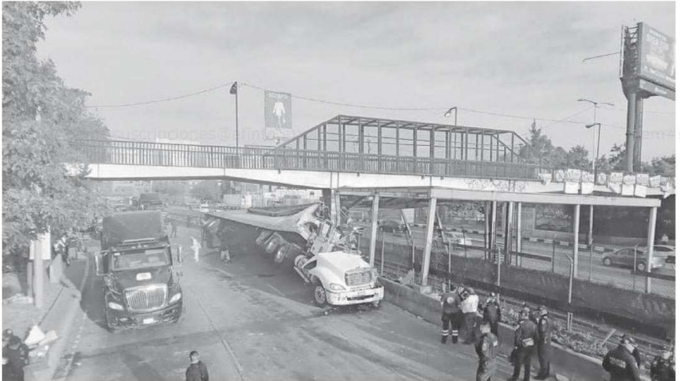
El accidente de un tractocamión, del que se desconoce al propietario, causó caos en Circuito Interior.