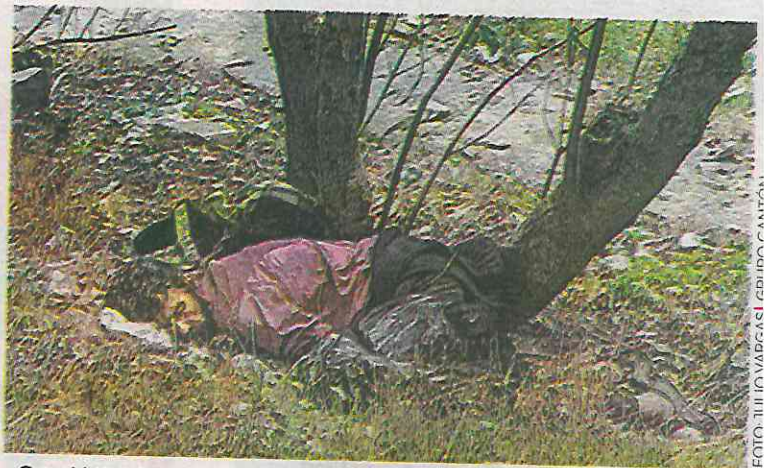
Quedó tirado sobre el pasto, bajo las ramas de un árbol

○ Será el resultado de la necropsia el que determine de qué murió el indigente