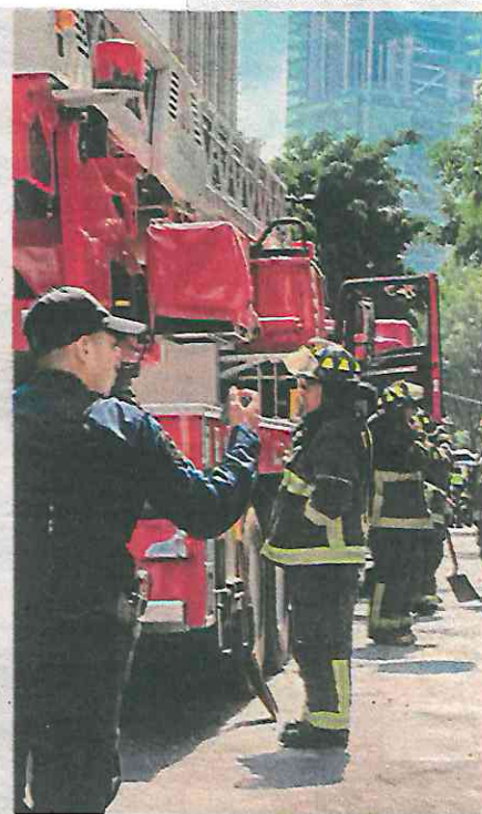
Bomberos acudieron al lugar