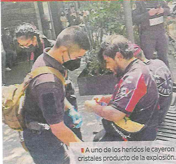
■ A uno de los heridos le cayeron cristales producto de la explosión.

Sólo los dos primeros fueron trasladados al Hospital Rubén Leñero.