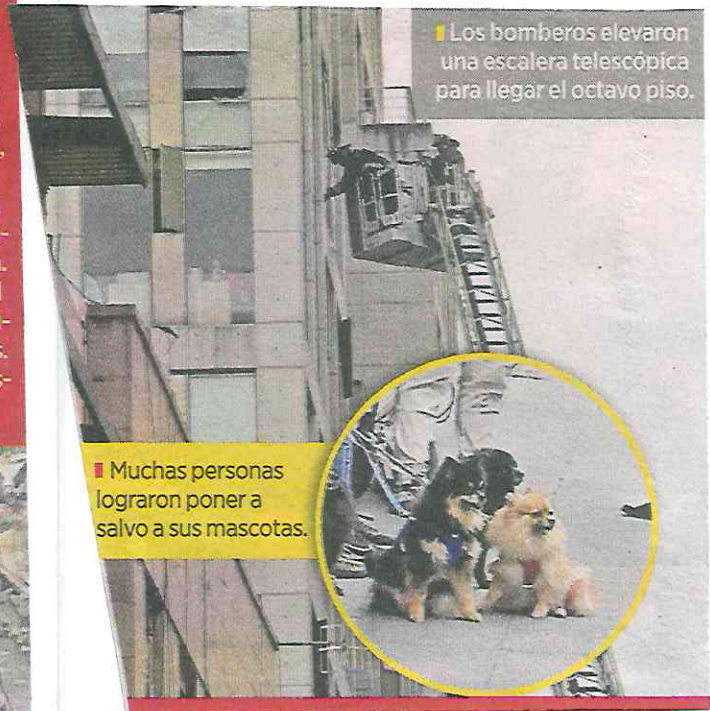
■ Los bomberos elevaron una escalera telescópica para llegar el octavo piso.