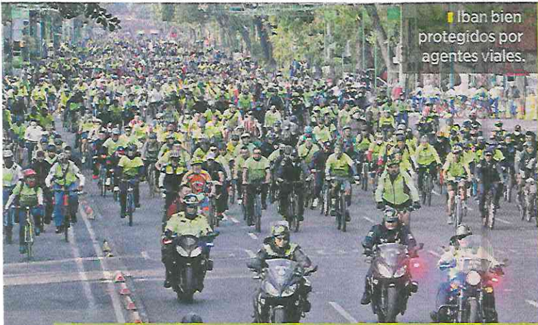
Iban bien protegidos por agentes viales.