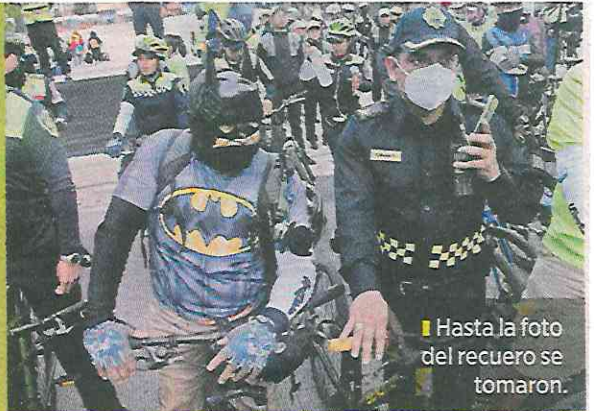
Hasta la foto del recuerdo se tomaron.