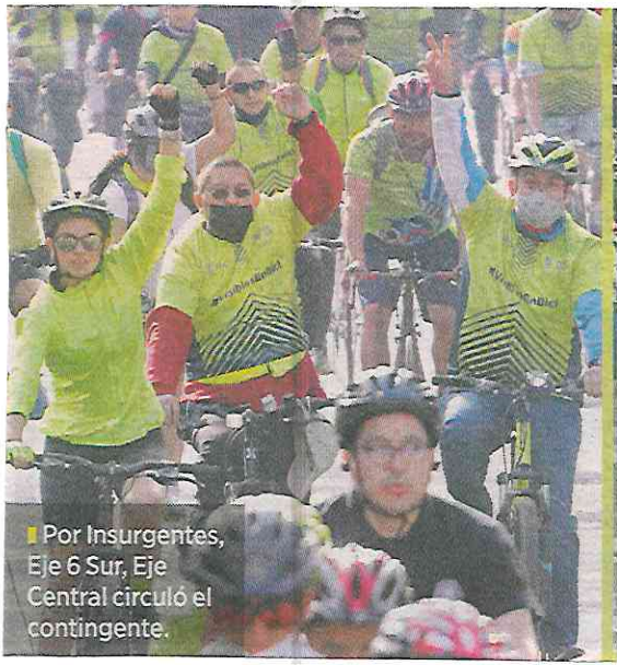
Por Insurgentes, Eje 6 Sur, Eje Central circuló el contingente.