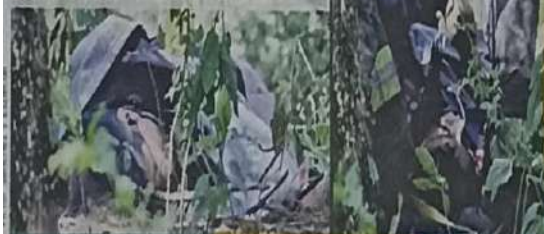
Un hombre falleció en el lugar y otro, en el hospital.

2 HOMBRES fallecieron debido al accidente carretero