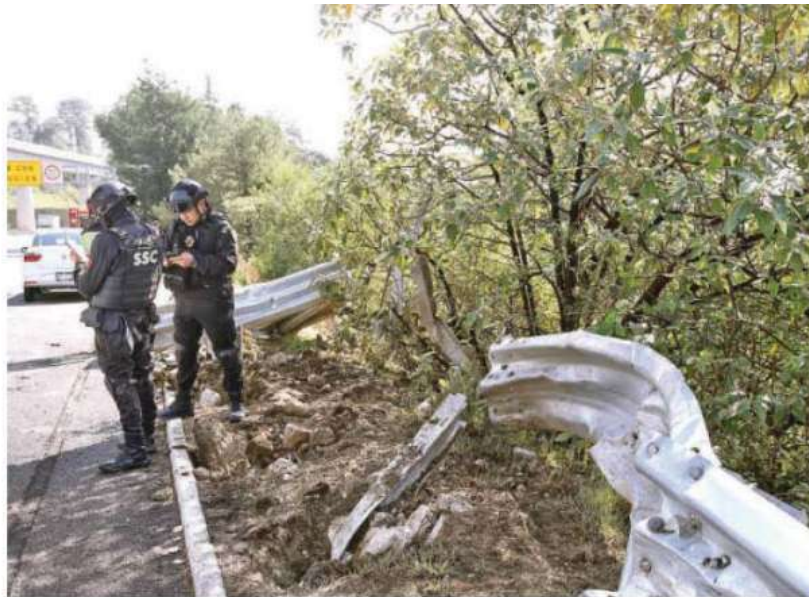
Las víctimas , provenientes de Lerma, viajaban a bordo de una camioneta con dirección a la CdMx cuando ocurrió el siniestro

El hecho san- griente ocurrió la mañana de este domingo cerca de las 06:00 horas a la altura del kiló- metro 22 , en la zona conocida como el Valle de las Monjas