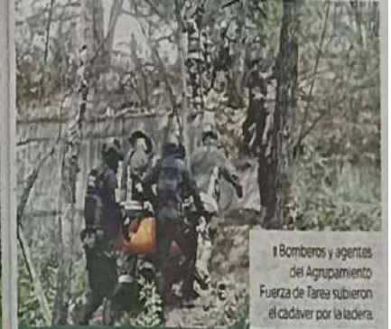
Bomberos y agentes del Agrupamiento Fuerza de Tarea subieron el cadáver por la ladera.