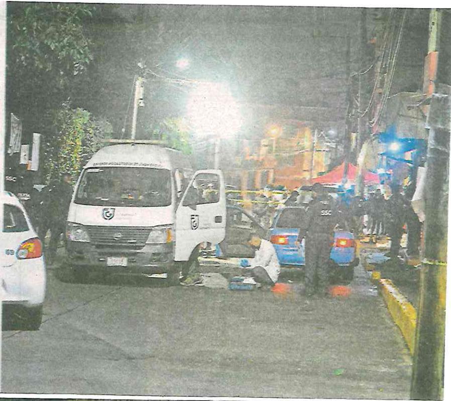
Personal de la Fiscalía ya investiga el motivo del tiroteo en "punto narcomenudista"