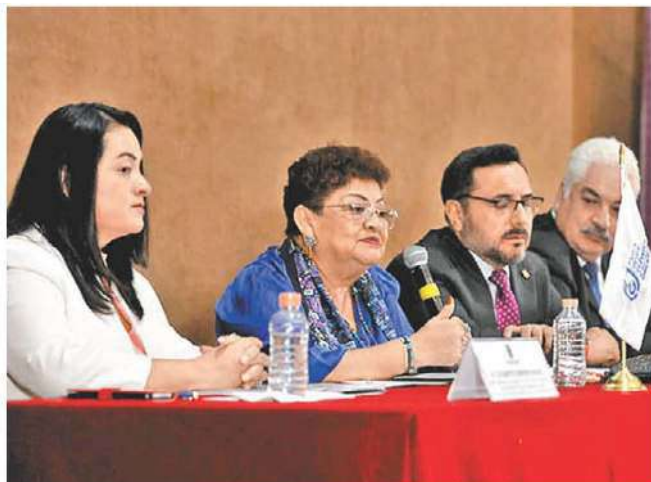
La funcionaria capitalina junto a directivos del IPN.