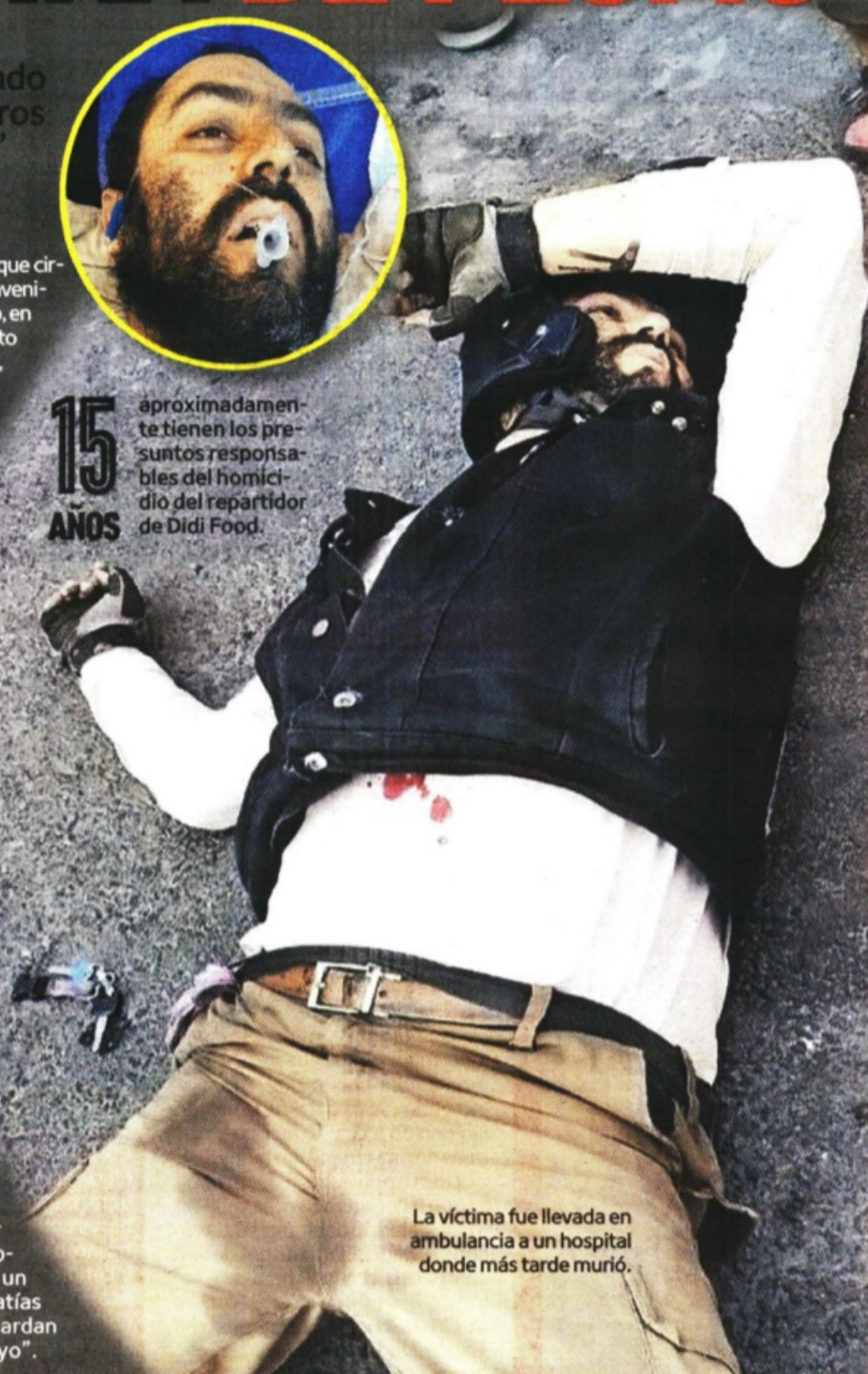
La víctima fue llevada en ambulancia a un hospital donde más tarde murió.

aproximadamente tienen los presuntos responsables del homicidio del repartidor de Didi Food.