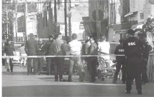
- El caso se perfila como una venganza